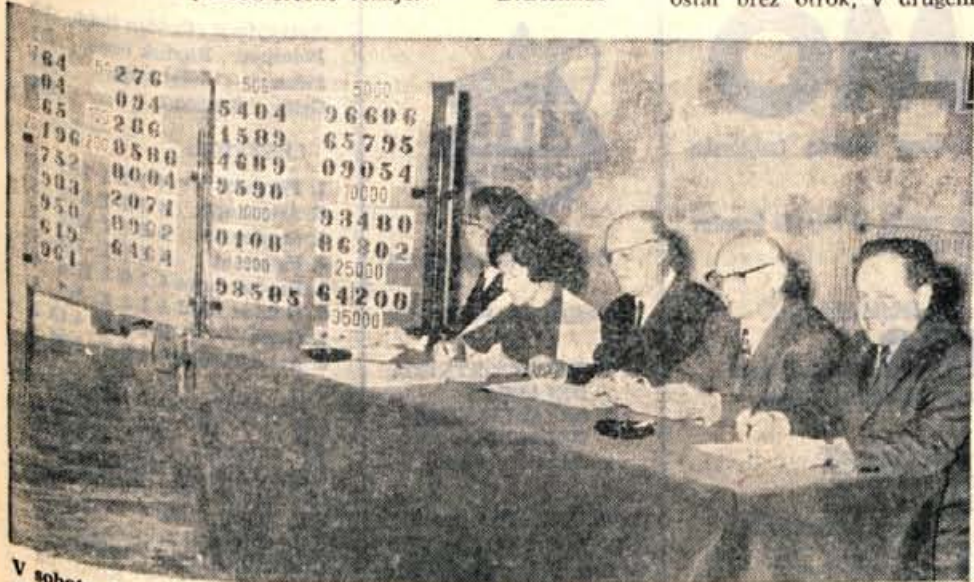
V soboto dopoldne je bilo v avli občinske skupščine žrebanje denarne loterije, ki jo je organiziralo Planinsko društvo Kranj.