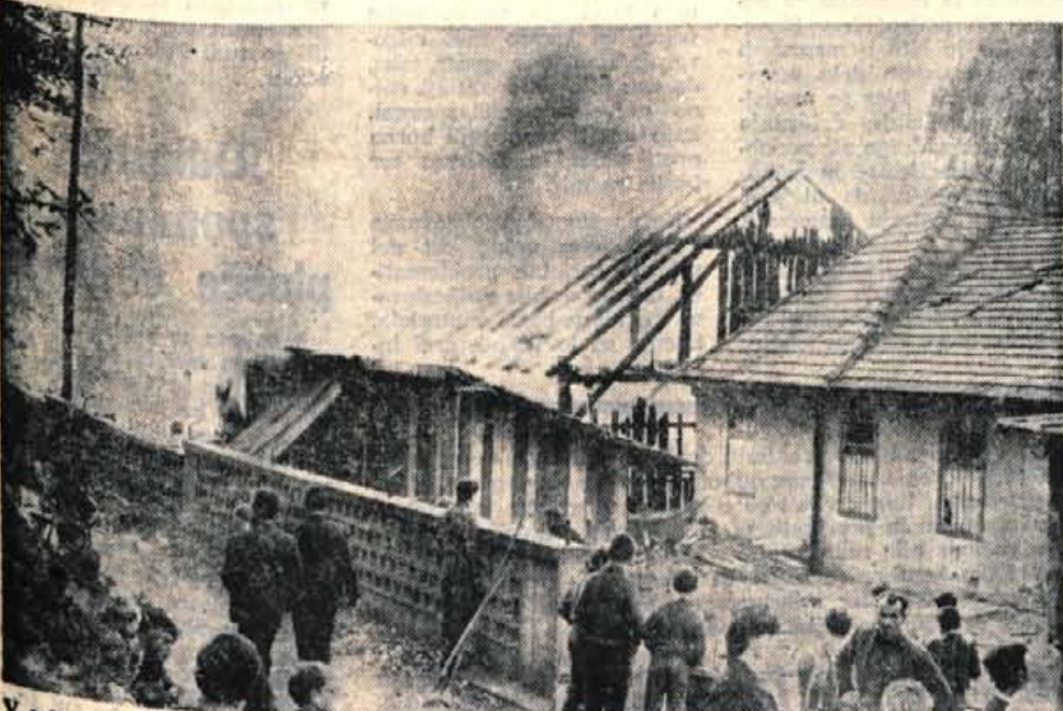
V soboto, 23. oktobra, dopoldne je izbruhnil ogenj v lesenem skladišču obrata II tovarne Tekstilindus Kranj. Skladišče je pogorelo do tal, prav tako pa je pogorelo tudi okoli 30 ton odpadnega bombaža in sintetičke. V tem obratu je gorelo že dan prej, ko se je pokazal ogenj na nekem stroju. Odpadni material, ki je gorel prejšnji dan, so pogasili nedaleč od vrat skladišča odpadnega materiala. Komisija UJV meni, da je verjetno ogenj tlel v tem materialu še od prejšnjega dne, zgodaj zjutraj pa je ogenj izbruhnil. Škodo cenijo na okoli 350.000 din.