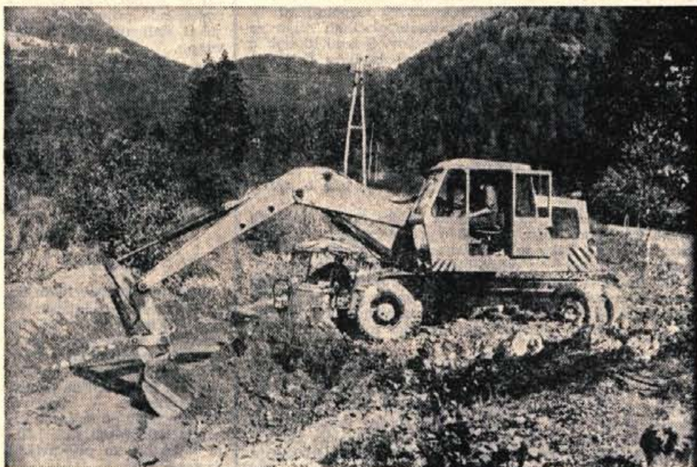
Ker je potok Jezernica na Jezerskem rada poplavljal, je začela Splošna vodna skupnost Gorenjske strugo poglobljati, in sicer odsek med Jezerom in mostom za Kazino. S tem je bil dosežen dvojni učinek. Jezernica nič več ne poplavlja, razmočvirila pa se je tudi precejšnja kmetijska površina v ravnem delu Jezerskega med Kazino in Jezerom na desni strani ceste. Zemlja, ki je družbena last, je sedaj kmetijsko uporabna, vendar raste na njej trst, pomešan z grmovjem. V suši se ta navlaka rada vžge, kar se je že zgodilo, kviri pa tudi videz kraja. Na Jezerskem smo slišali, da bi marsikateri kmet to zemljišče rad vzel v zakup, če bi kdo odstranil trste in grmičevje. — Jk.