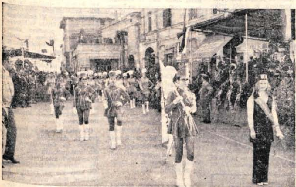
Tudi francoska dekleta so dala svoj prispevek k praznovanju pobratenja.

Ogled trgovine s pohištvo — Centro Arredamenti — je bil za marsikoga iz naše skupine poseben užitek. Izbrana pohištva je tako velika, da lahko zadovolji prav vsak okus. Sicer pa imajo mizarji v okolici Medicine že lepo tradicijo. Pohištvena zadruga, ki oskrbuje to trgovino, je bila ustanovljena takoj po vojni. Začetni kapital je vložilo deset zadrugnikov. Danes jih je zaposlenih petinštrideset, pet pa jih dela v upravi. Vsak delavec — zadrugnik — ima plačo, če pa je uspeh še posebno dober, mu poleg rednega zasluzka pripada še premija. Vse ostalo gre v nadaljnje investicije. Tudi trgovino so sami uredili.