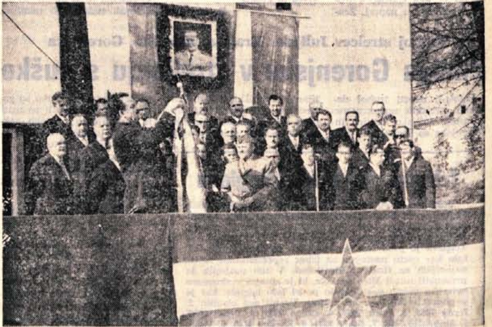
Združenje vojaških vojnih invalidov v Poljanah je v nedeljo razvilo svoj prapor.

V nedeljo popoldne se je končal s spretnostno vožnjo po ulicah Skofje Loke nočni avto rally Loka 71. Udeleženci so morali prevoziti kar 677 kilometrov v devetih etapah. Premagati so morali tri gorske preizkušnje, preizkušnjo pospeška in opraviti spretnostno vožnjo. Tekmovanja, ki ga je že četrtilč pripravilo AMD Skofja Loka in tokrat pod pokroviteljstvom Partizanske knjige iz Ljubljane, se je udeležilo 46 parov v petih kategorijah. Pred zadnjo etapo je prišlo do manjšega spora med tekmovalci in organizatorji, ker je prišlo do pritožb na račun tekmovalnih pravil. Rally se je točkoval tudi za republiško prvenstvo. V razredu do 785 ccm sta zmagala člana domačega AMD Vernik—Kemperle na zastavi 750, ekipno pa je bilo AMD Skofja Loka peto. (jg)