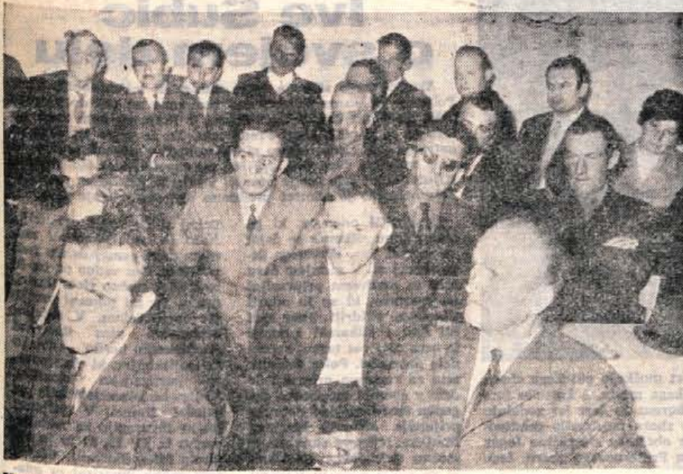
Kmetovalci so z zanimanjem poslušali predavanje o boleznih vimeca.