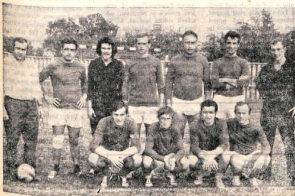
Nogometaši Tekstilindusa so zmagali na letošnjem tekmovanju v malem nogometu v okviru V. letnih športnih iger ObSS Kranj.