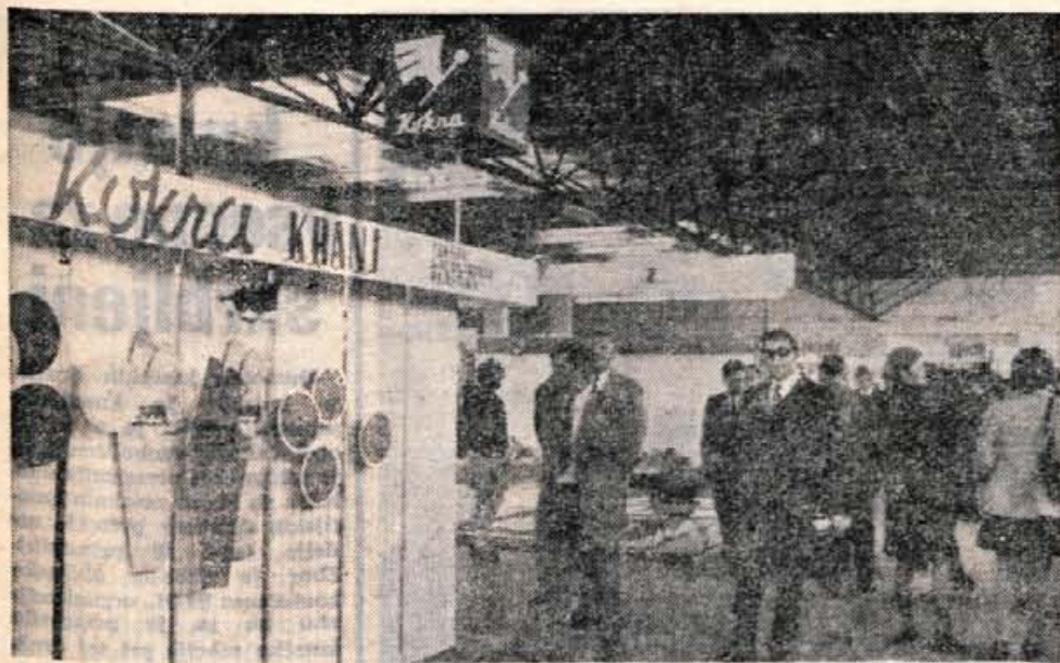
Veletrgovsko podjetje Kokra Kranj je že več let redni gost zagrebških sejmskih prireditev