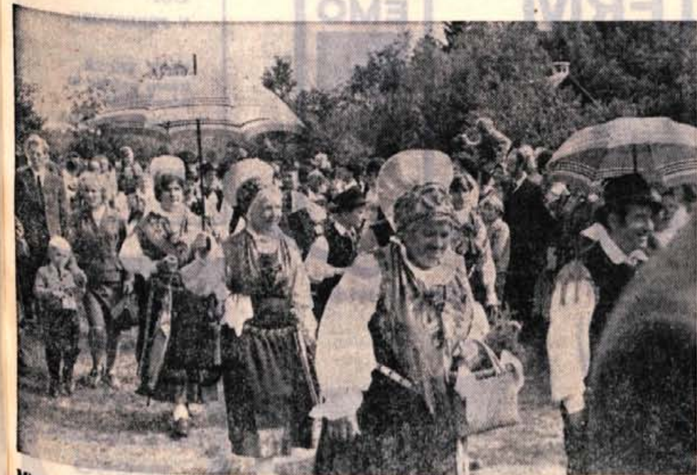
Minulo nedeljo je bil v Ukancu v Bohinju že tradicionalni Kravji bal, ki ga je skrbno pripravilo Turistično društvo iz Bohinja. V programu je nastopila pihalna godba iz Gorij, folklorna skupina iz Bohinja, pevski zbor iz Bohinja in skupina narodnih noš iz Skofje Loke. Planjarji in planjarice so prikazale nekaj običajev iz življenja v planinah, za zabavo pa je poskrbel instrumentalni ansambel Gorenjci. Na prireditvenem prostoru se je ob lepem vremenu zbralo veliko ljudi iz vse Slovenije, bilo pa je tudi nekaj gostov iz Avstrije in Italije.

Pokljuki, je sklenilo, da bo tekmovanje v nedeljo 3. oktobra. Tekmovanje so prejšnjo nedeljo odpovedali zaradi slabega vremena. Četrto tekmovanje harmonikarjev bo ob 11. uri pri gostišču ob tabornem ognju. A. Z.