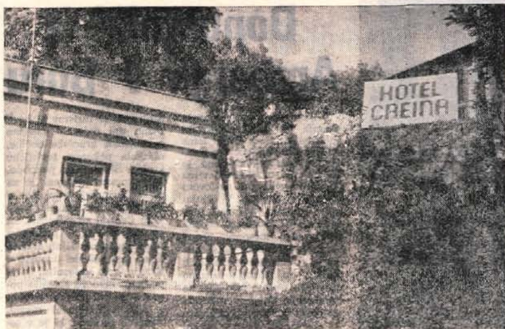
Hotel Crelna v Lenardičevi hiši: Ker so oznako za kranjski hotel postavili tako nesrečno, so nekateri že spraševali pri Lenardičevih, če imajo kaj prostih postelj.