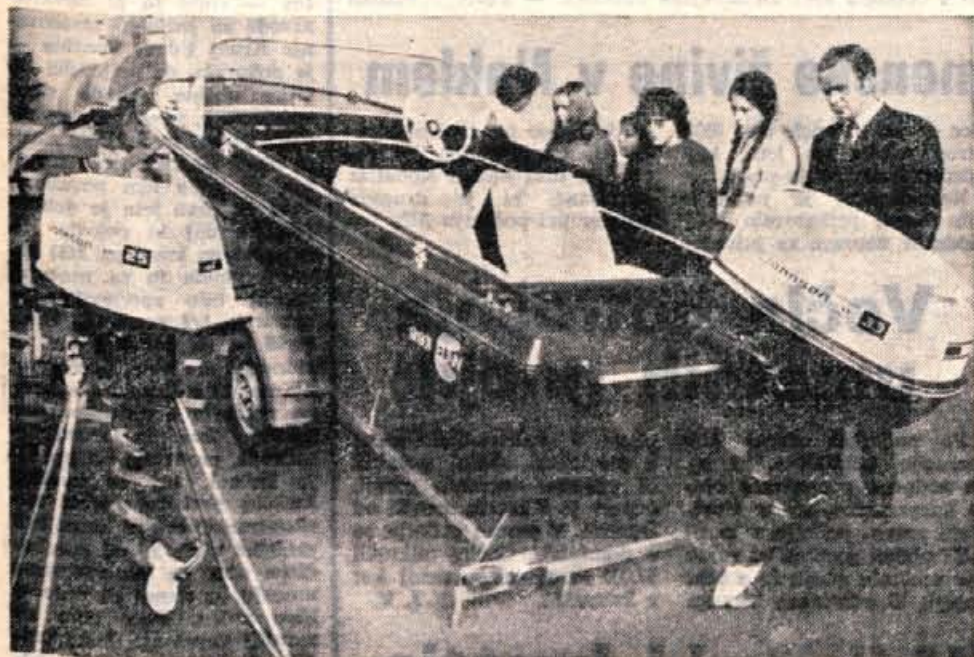
Efan je letos na sejmju prikazal športne čolne in magnetne smučl