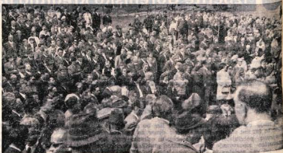
S tovariškega srečanja bivših koroških partizanov in borcev za severno mejo

● V četrtek se je sestala na svojem drugem zasedanju skupščina kulturne skupnosti Trzic. Po izčrpnih razgovorih, ki jih je izvršni odbor tega telesa opravil s poklicnimi kulturnimi zavodi na območju občine in z zvezo kulturno-prosvetnih organizacij, je bilo moč sestaviti predlog kulturne dejavnosti v sezoni in sprejeti poleg načrta dela tudi finančni načrt. Clani skupščine so razpravljali tudi o družbenem dogovoru z občinsko skupščino in republiškim izvršnim svetom glede financiranja kulturnih dejavnosti v Trzicu. Oba družbena dogovora so sprejeli in ju poslali v podobno obravnavo obema sopolisnikoma. — ok