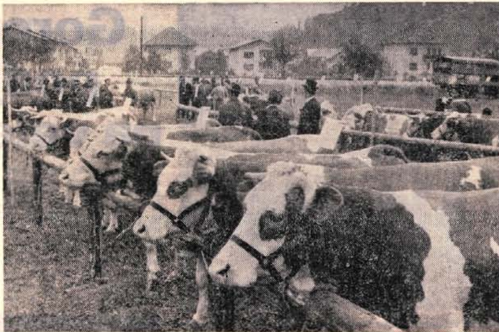
Po sedmih letih je bila v nedeljo v Naklem spet živinorejska razstava.