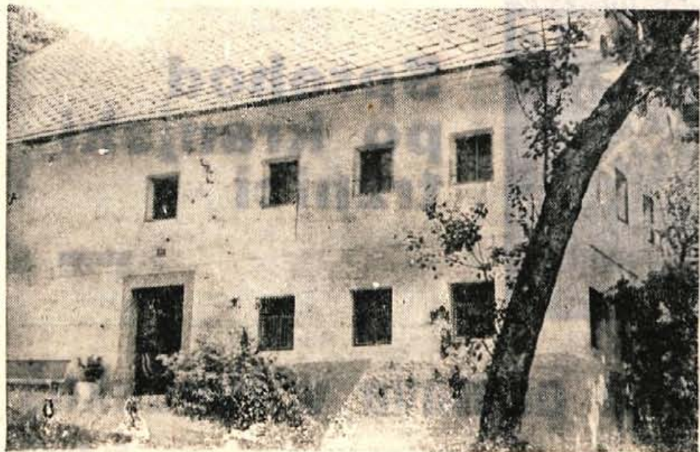
V Sorici je še veliko pravih kmečkih hiš. Vse so pokrite s škrlom.