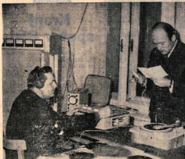
Začetki tržiškega radia.

Ustanovitelj lokalnega radia — občinska konferenca SZDL Tržič — je pred kratkim pripravila razgovor o programski problematiki lokalne radijske postaje. Le-ta deluje že deveto leto, od lani pa je organizacijsko povezana v mrežo slovenskih radijskih postaj pod okriljem RTV Ljubljana. Centralna slovenska radijska hiša je prevzela precejšen del bremena vzdrževanja radia, vendar je bila po toliko letih delovanja potrebna izdatnejša investicija za tehnično opremo studija. Z enako, oziroma celo zmanjšano dotacijo iz občinskega proračuna v preteklih letih, je lokalni radio zašel v precejšnje težave, ki jih je začasno rešil z najetjem posojila, je pa to kratkoročno in letne anuitete za ta majhen zavod niso malenkostne.