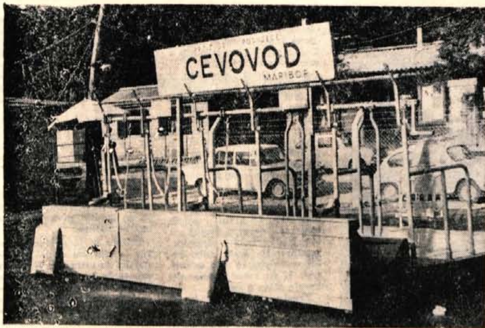
Cevovod iz Maribora je na letošnjem Gorenjskem sejmu razstavljal tudi opremo za sodobne hleve. Na fotografiji »mehanizem« za privezovanje živine.