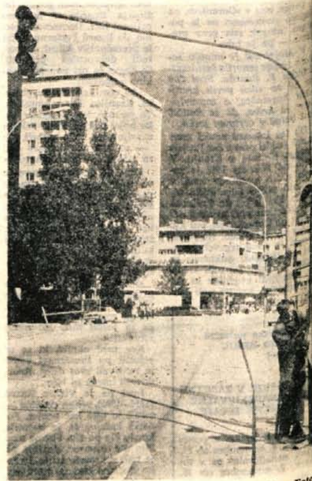
Pri semaforju na križišču pri Tancarju na Jesenicah

Lani pa so kamniški gasilci kupili orodni gasilski avto znamke IMV Novo mesto, ki so ga šele letos za občinski praznik izročili svojemu namenu. Tako so kamniški gasilci v letu dni dobili dva nova avtomobila. J. Vidic