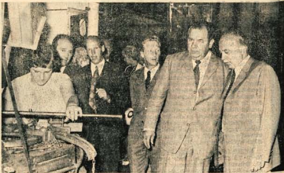
Med obiskom v Verigi si je predsednik zveznega izvršnega sveta ogledal nekatere proizvodne obrate.