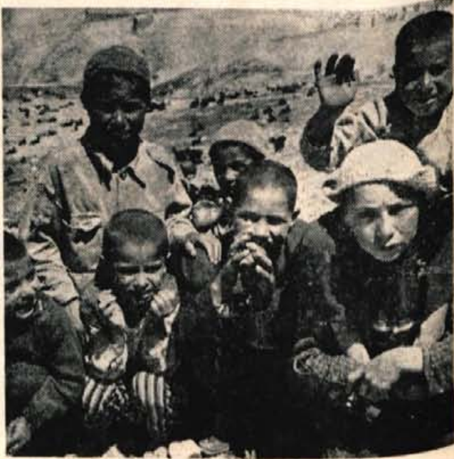
(Perzija) Iran: Občudovalci