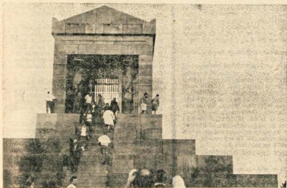
Nekdanji izgnanci so si ob koncu obiska v Srbiji ogledali tudi spomenik neznanemu junaku na Avali, delo kiparja Ivana Meštrovića.