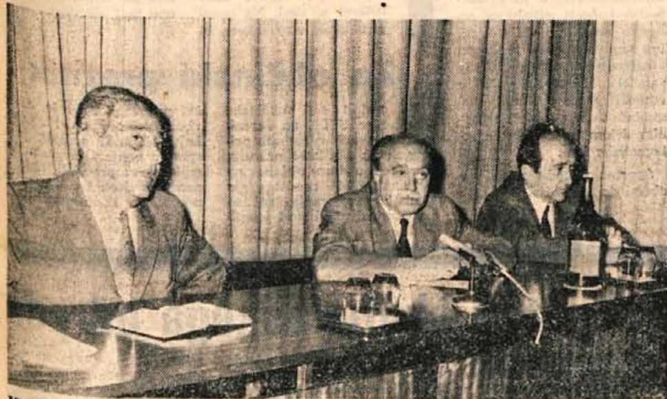
Mitja Ribičič med pogovorom s predstavniki gospodarstva in družbenopolitičnih organizacij radovljiške občine.

Gorenjski turistični delavec so minulo nedeljo zabeležili največji obisk oziroma zasedenost v letošnji poletni sezoni. Vsi turistični kraji so napolnjeni z gosti. Prevladujejo tuji gostje. Na Bledu so v nedeljo zabeležili 4300 gostov, od tega več kot dve tretjini tujcev. V kampu Zaka so dosegli rekord: prek 1200 obiskovalcev, v kampu Sobec pa je bilo več kot 2200 gostov.