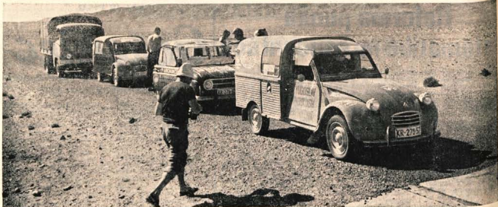
(Perzija) Iran: V puščavi