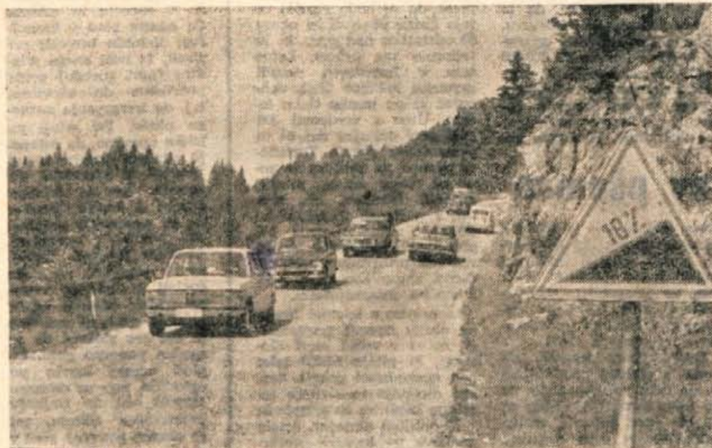
Takole je v teh poletnih dneh na najbolj strmih delu ceste od Podkorena do Korenskega sedla.

Med znanimi naravnimi kopališči na Gorenjskem je tudi precej hladno Bohinjsko jezero, potem Završnica pri Zirovnici, Sobčev bajer in morda še kje. Pred kratkim so odprli bazen tudi na še ne določeno urejenem kopališču v Zg. Besnici pri Kranju.