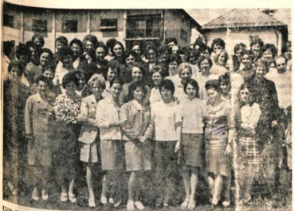
Učiteljice in učitelji 1. razreda iz kranjske in tržiške občine, zbrani na seminarju o sodobnem pouku matematike v osnovni šoli