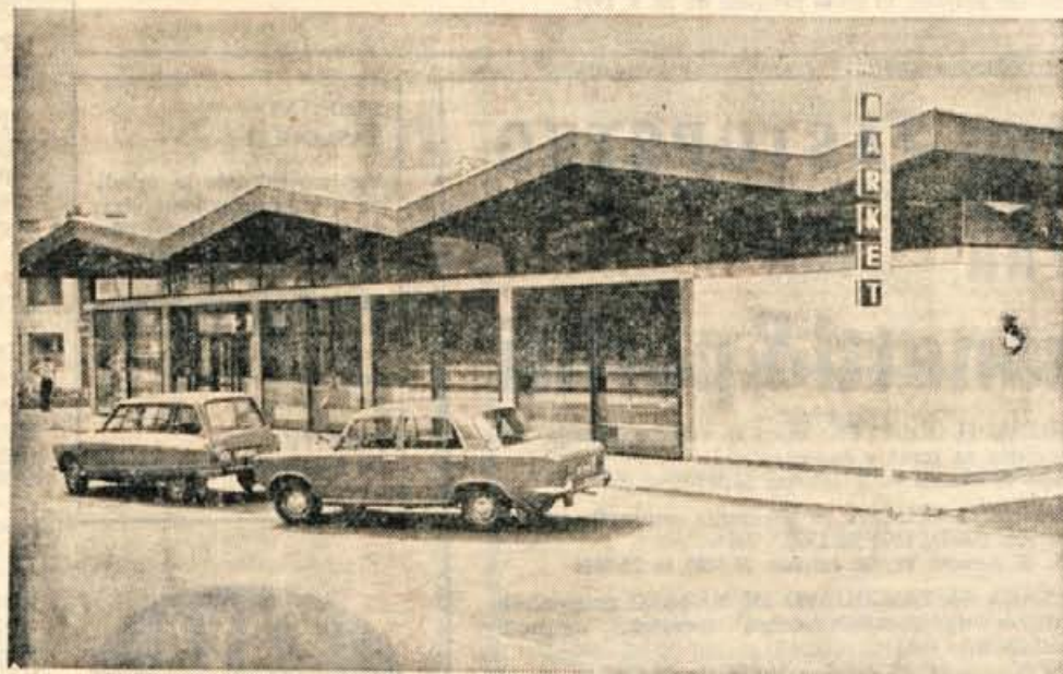
Veletrgovina Zivila Kranj s poslovno enoto na Bledu čestita vsem prebivalcem krajevné skupnosti Bled za njihov praznik in jim želi tudi v prihodnje veliko uspehov.

Samopostrežna trgovina bo odprta vsak dan neprekinjeno, ko bo odprta cesta na Pokljuko, pa tudi ob nedeljah. Medtem ko bo bife že sedaj odprt tudi ob nedeljah. Omenimo še to, da bodo prebivalci Gorj in okolice oziroma kupci lahko dobili vse prehransko in drugo blago in vsak dan tudi sveže meso.