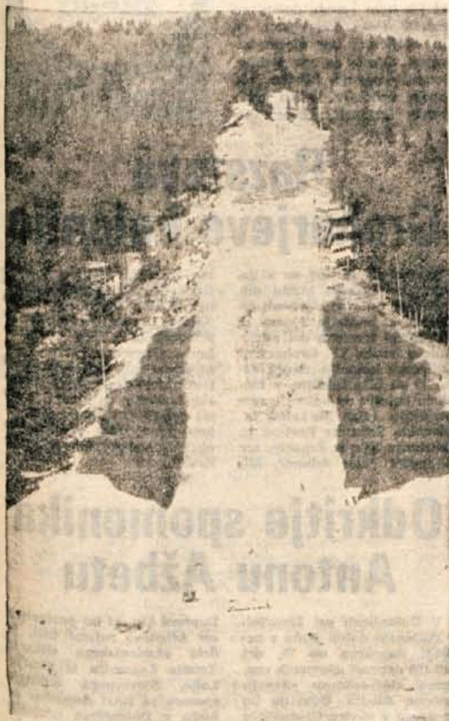
Delavci podjetja Hudournik — delovna enota iz Kranjske gore — popravljajo skakalnico v Planici in jo pripravljajo za svetovno prvenstvo.