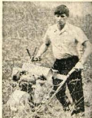
Taka kosilnica je kar primerena za hribovit teren.

V zadnji točki so kmetje pokazali dve vrsti strojev za pobiranje krme. Največ občudovalcev je pri gledalcih vzbudil specialni traktor »Reform Muli«. Stroj obvlada skoraj vsak teren. Ima 4-cilind-