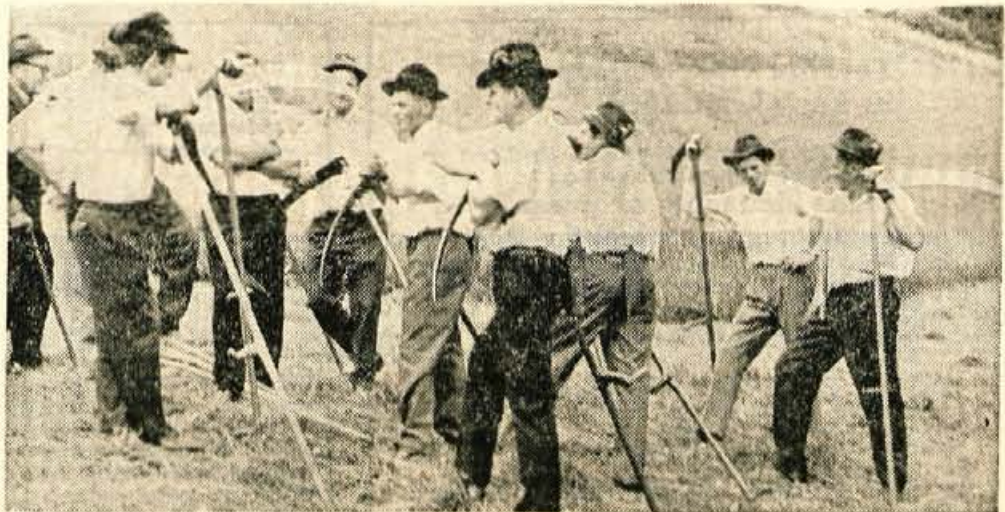
Po končani košnji so se kosci zbrali k prijetnemu pomenku