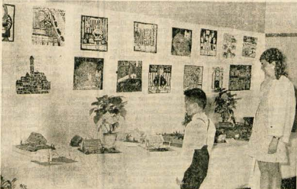
Ob krajevnem prazniku v Stražišču so v soboto v osnovni šoli Lucijana Seljaka odprli razstavo, ki so jo pripravili učenci. Člani zgodovinskega krožka so pripravili zgodovinski del razstave, katere osrednja tema je bila NOB. Razstavljani so bili tudi razni tehnični izdelki učencev, mladinska organizacija pa je pripravila razstavo raznih zbirk: znamke, prtičkov, starega denarja, značk itd. Razstavni prostor so opremili učenci — člani likovnega krožka. Ob krajevnem prazniku so učenci šole Lucijana Seljaka pripravili tudi športna tekmovanja in koncert šolskih pevskih zborov. (lb)