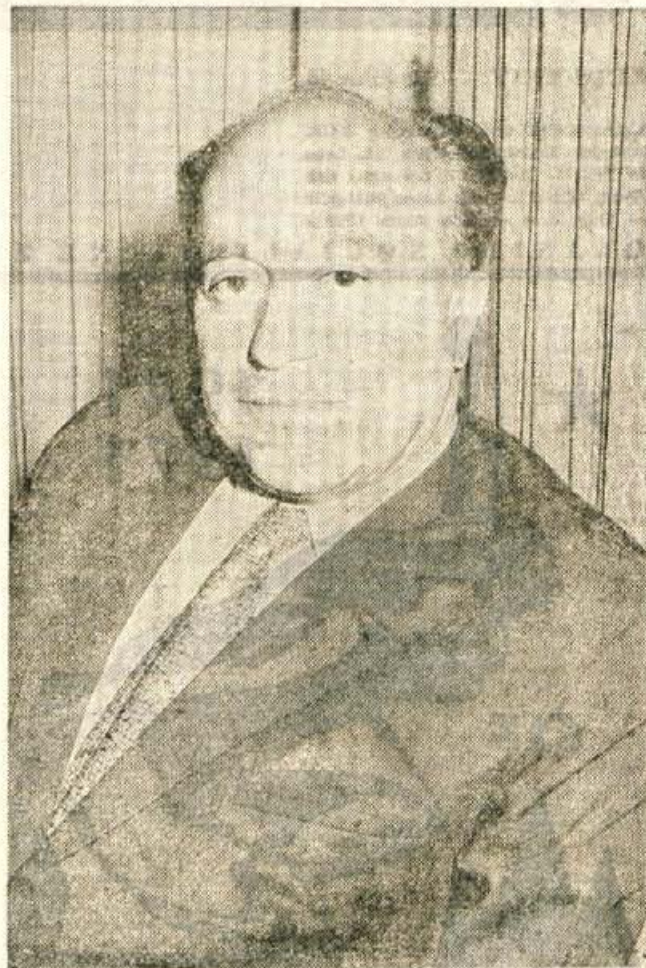
MITJA RIBIČIČ je bil rojen 29. maja 1919 v Trstu. Studiral je na pravni fakulteti v Ljubljani. V NOV je sodeloval od 1941. leta in je nosilec Partizanske spomenice 1941. Po osvoboditvi je delal v sekretariatu za notranje zadeve, bil je član izvršnega sveta skupščine LRS, sekretar okrajnega komiteja ZK Ljubljana itd. Zdaj je član predsedstva ZKJ, republiške konference SZDL, poslanec zbora narodov zvezne skupščine. Predsednik izvršnega sveta skupščine SFRJ je dve leti.

»Ni mi všeč izraz dopolnilo, ker vidim v amandmajih ne samo neko dopolnilo ali izboljšave sedanje ustave, pač pa izredno pomembne temeljne ustavne spremembe, ki menjajo odnose med republikami, med narodi in središčem. Spreminjevalni ustavni predlogi so sprožili razprave ne samo znotraj Jugoslavije, temveč po vsem svetu. Francoski premier Chaban-Delmas mi je dejal, da so oni zanimivi celo za enonacionalno državo. Najodločilnejše za nove ustavne odnose je, da se bodo republike in pokrajine potrdile kot neposredni dejavniki v federaciji, v iz-