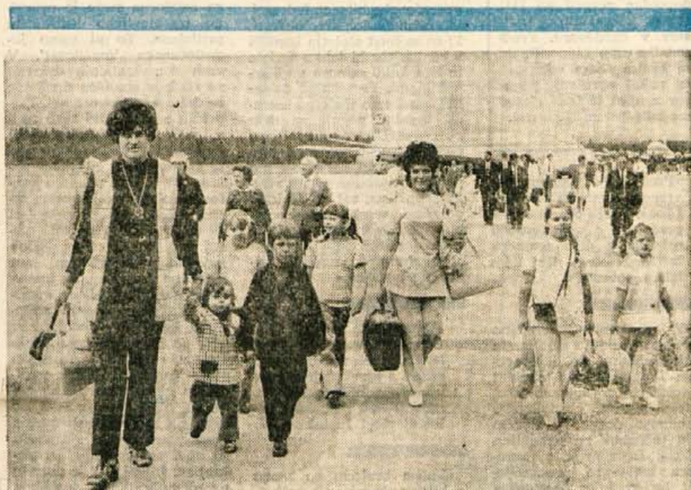
Minuli petek je na brniškem letališču pristalo in odletelo 29 letal; med njimi tudi trije boeingi 707. Dva orjaka sta popoldne pripeljala izseljence iz Avstralije in ZDA.