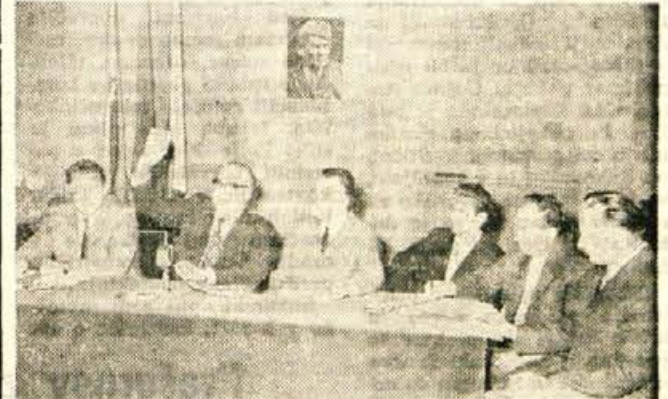
V nedeljo dopoldne je bilo v avli občinske skupščine v Kranju žrebanje srečk blagovno-denarne loterije športnega društva Borec iz Kranja. Tako kot prejšnja leta je bilo tudi tokrat med Kranjčani za žrebanje veliko zanimanje.

pripravljene in imajo možnosti sprejeti goste ter se čutijo sposobne, naj bi posredovali podatke o zmogljivostih najbližjemu turističnemu društvu in pa TD Skofja Loka. Podatki, ki jih ima TD Skofja Loka, so za vsakega interesenta velika ugodnost, saj mu ni treba iti, morda celo brezuspešno, na eno od TD v dolini. Mislim, da bi se vsa stvar res lahko uredila v obojestransko zadovoljstvo. -jg