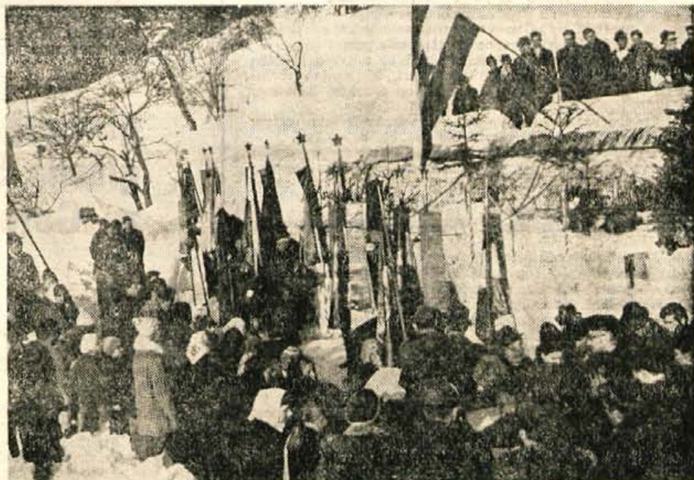
Komemoracija na dražgoškem pokopališču