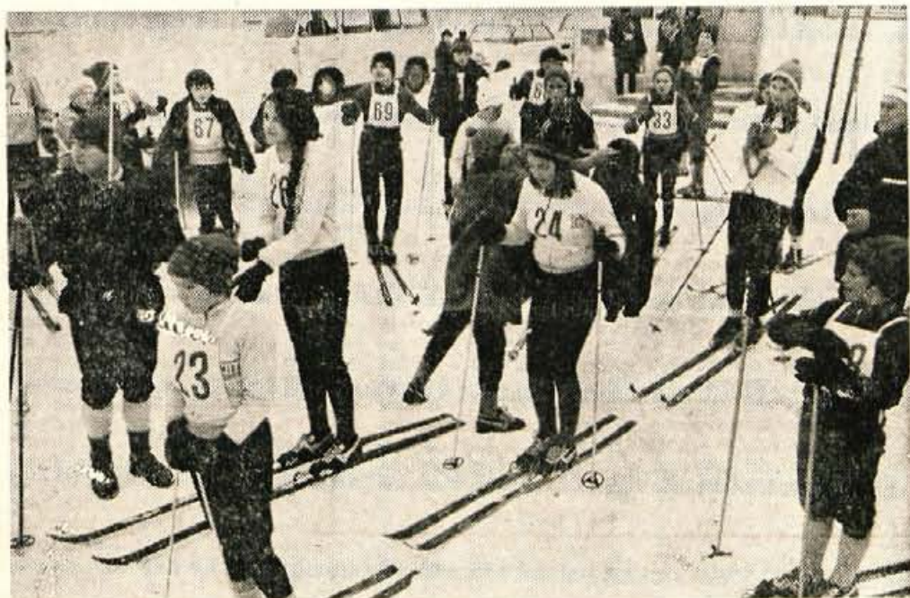
Učence in učenci gorenjskih osnovnih šol na štartu smučarskega teka v Lancovem. Proga je bila zahtevna, vendar dobro pripravljena.

Besedilo: J. Košnjek