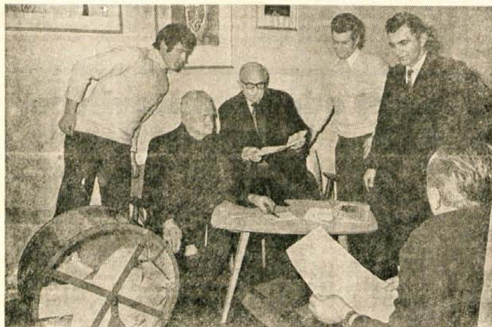
Napeto pričakanje: križanka je bila izžrebana, zdaj je pa treba preveriti, če je pravilno rešena.

Čeprav je zima, alpinisti iz Jesenic, iz Mojstrane, Tržiča, Ljubljane in Celja ne mirujejo. Pripravljajo se za zimske vzpone. Še pred pomladjo nameravajo premagati severno steno Spika, severno steno Triglav, Zmajev groben v trentarskih hribih in druge poti v Julijskih Alpah.