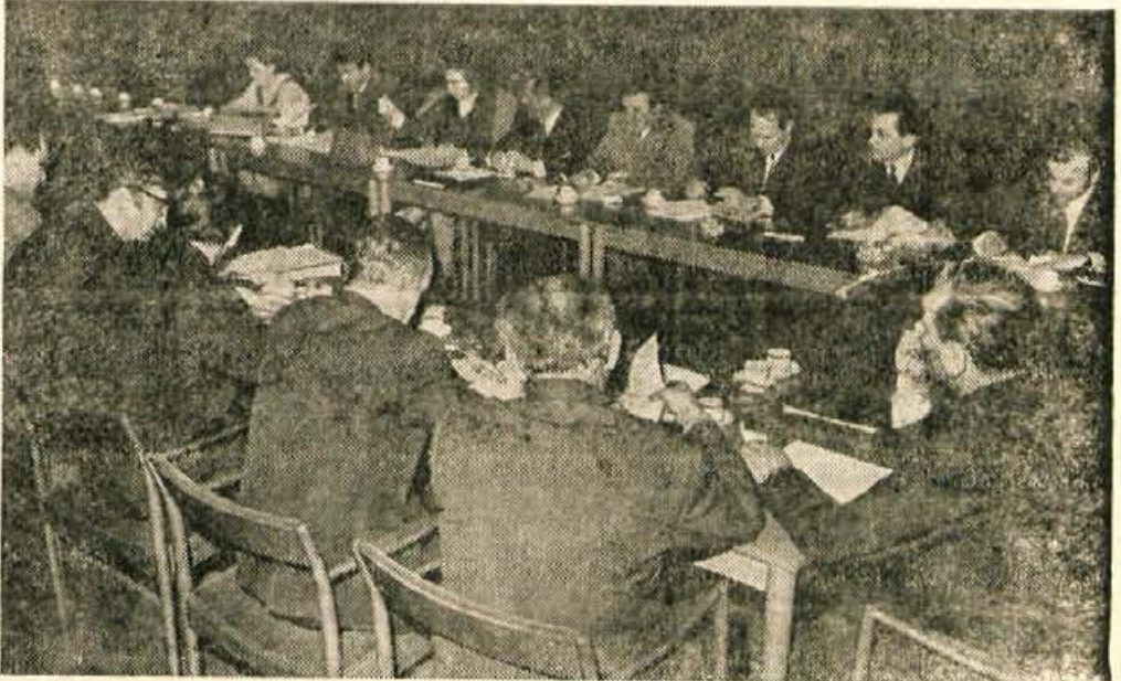
Medobčinski svet ZK za Gorenjsko je v ponedeljek popoldne razpravjal o težah za 18. sejo CK ZKS

Na seji so poudarili, da bo ZK zato v prihodnje morala vztrajati pri tem, da stališča dobijo praktično veljavo v ustreznih sistemskih in drugih rešitvah in da potem zagotovo tudi izvajanje novih predpisov. Vse to pa je tesno povezano z uveljavljanjem osebne odgovornosti nosilcev družbenih pooblastil, kar je doslej stalo ob strani. Vendar ni pomembna le odgovornost najvišjih funkcionarjev, marveč tudi tistih po občinah in delovnih organizacijah, katerih odločitve so prav tako važen sestavni del celotnega gospodarskega in vsega družbenega dogajanja.