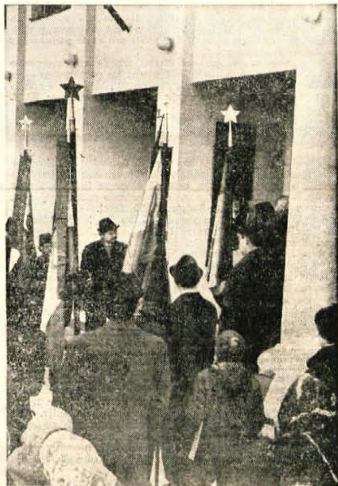
Odkritje spominske plošče 15. žrtvam NOB iz Češnjice