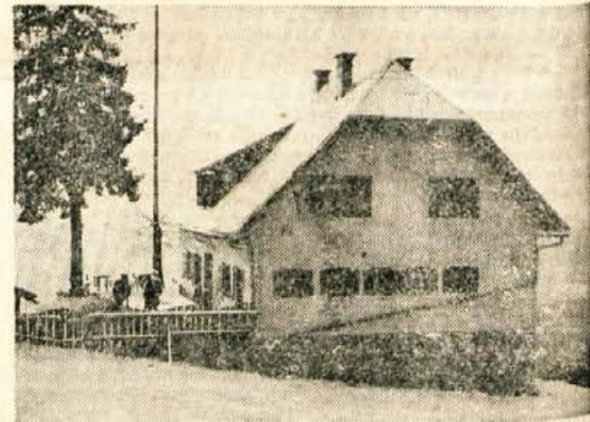
Šmučarski dom na Joštu.