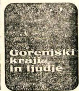
Gorenjski kraj in ljudje

Radi bi, da nam svoje mnenje o tem napišete tako stvarjši kot mlajši bralci Glasa. Urednik