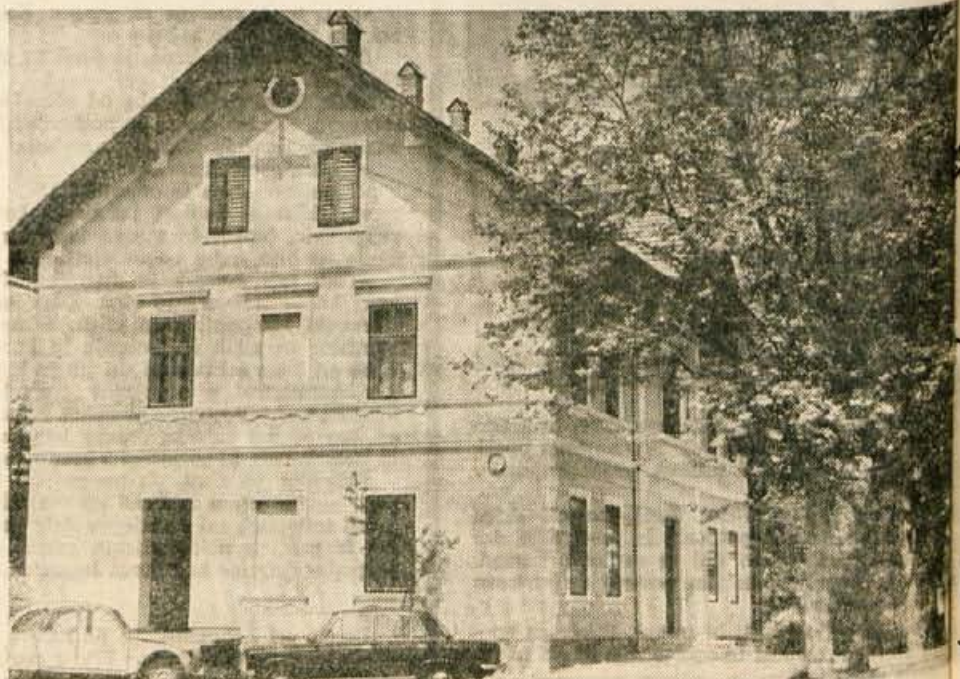
Veletrgovina Specerija Bled bo v petek ob 17. uri na Posavcu odprla preurejeno gostišče

Interesenti za štipendije naj oddajo prošnje do 15. junija 1971 v tajništvo podjetja Kranj, Ul. Moše Pijade 1.