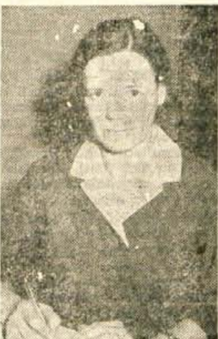
Perne Minka, Kranj, Kidričeva 36, je izžrebala naslednje naročnike: