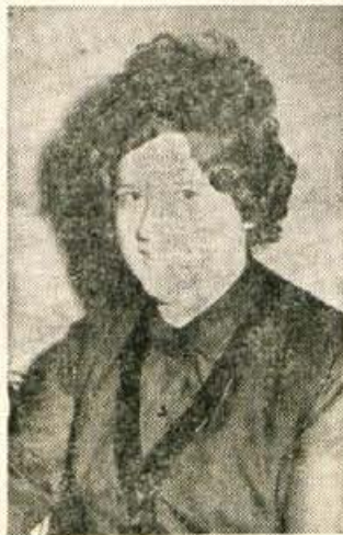
Gabrič Stefka, Reševa 7, Kranj, je izžrebala naslednje naročnike: