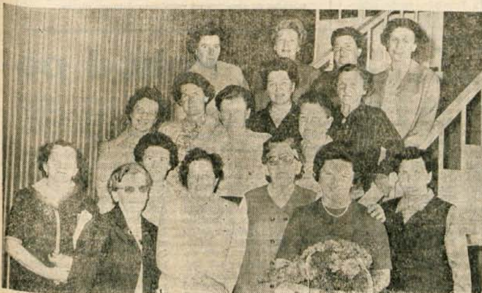
V nedeljo so se v hotelu Creina v Kranju srečale interniranke iz taborišča Grineberg, ki je bil podružnica zloglasnega taborišča Rawensbrück (lb).

in si popoldne ogledali nekatere blejske turistične objekte ter se pogovarjali s predsednikom radovljiške občinske skupščine. A. Z.