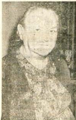
Podboršek Leni, Zlato polje 6, Kranj, je izžrebala naslednje naročnike: