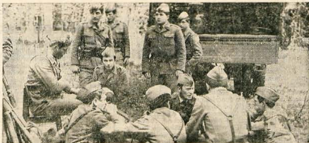
Najbolj sta se prilagela počitek in okrepitev po vaji

V soboto dopoldne so enote redne vojske in enote teritorialne obrambe iz Ljubljane, Kamnika, Domžal in Skofje Loke branile brniško letališče. Bila je to ena rednih skupnih vaj, v kateri so sodelovali tudi padalci in helikopterja, z njo pa so hoteli preizkusiti pripravljenost enot JLA in teritorialne obrambe. Posebnost vaje je bila tudi, da je v njej sodelovala večina vojakov, ki so šele pred nedavnim začeli služiti kadrovski rok.