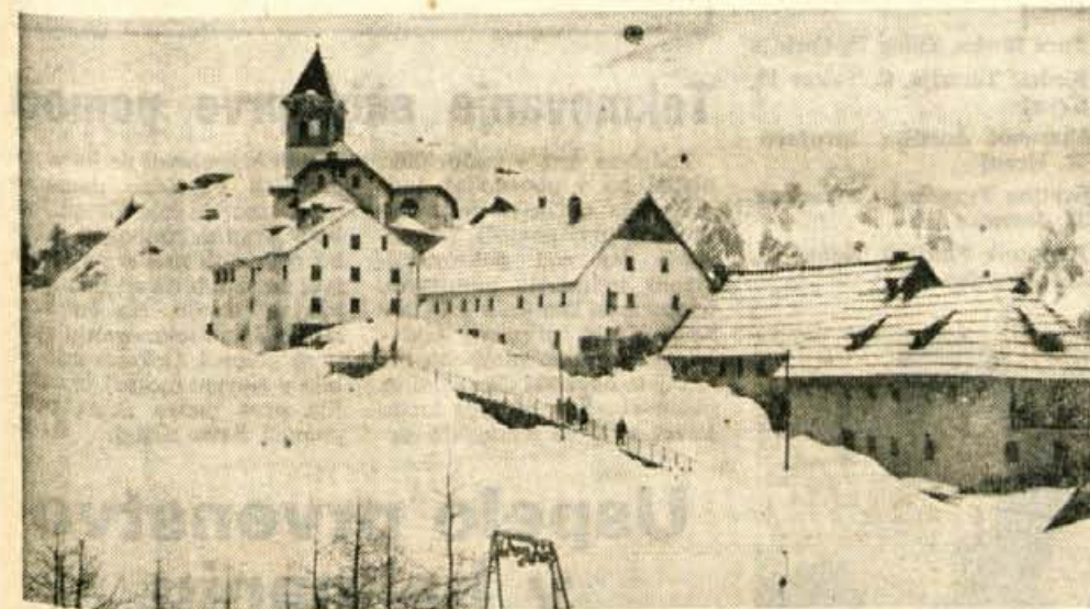
27. aprila je bilo na Višarjih še slab meter snega. Sredi zime ga je bilo dva metra in pol. Ker leži sneg na Višarjih skoraj do poletja, to izkoristijo smučarji iz okoliških krajev.