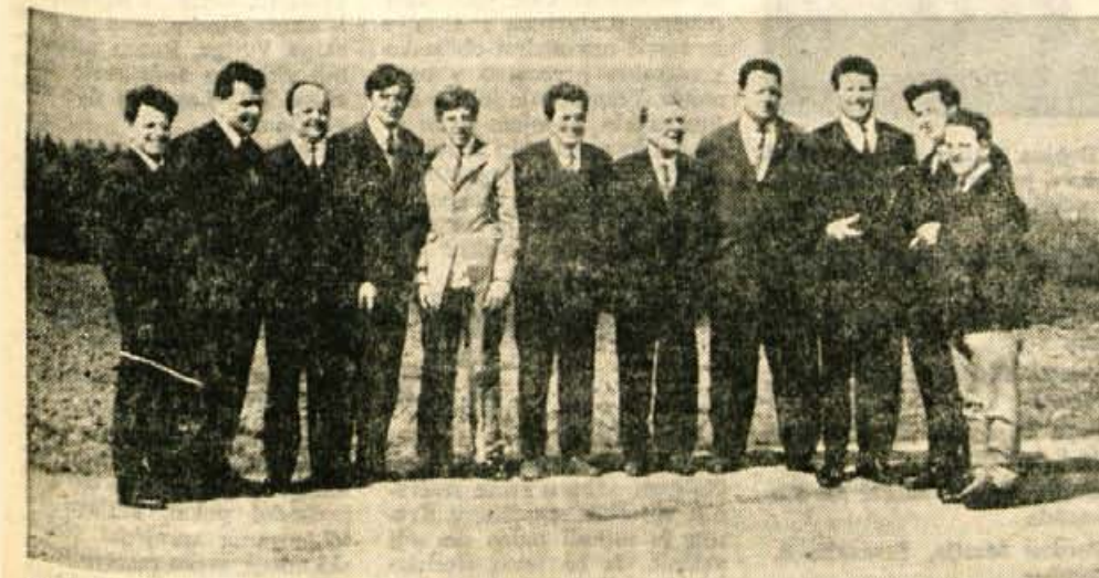
Na poti po Kanalski dolini in Rožu so Beljane in Trsteničane spremljali pevci z Bele, ki so jih bili še posebno veseli zamejski Slovenci.