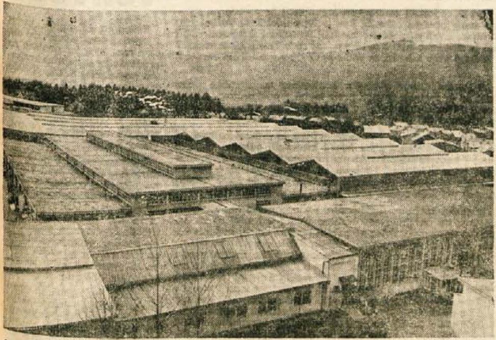
Nova proizvodna hala v LTH je že zgrajena. Konec meseca bo začel obratovati prvi trak za montažo hladilnih vitrin. (lb)

GLASILO SOCIALISTIČNE ZVEZE DELOVNEGA LJUDSTVA ZA GORENJSKO