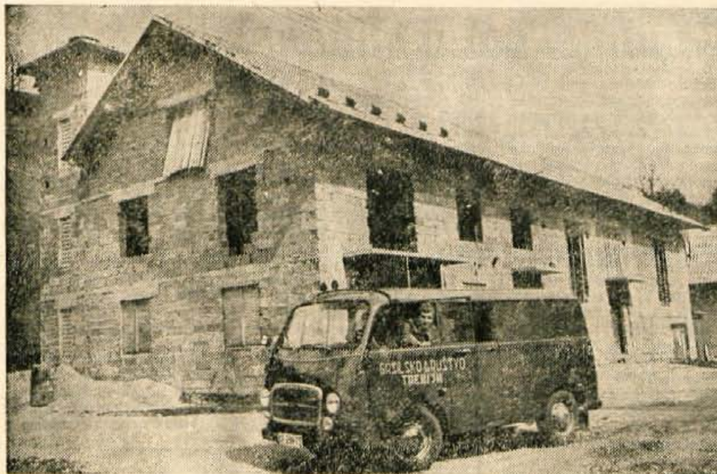
Dva uspeha prizadevnih trebijskih gasilcev: nov dom in gasilski avto.