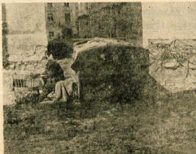
Kranjska (skrita) razglednica

Pokopališka uprava pri KS Predoslje—Britof