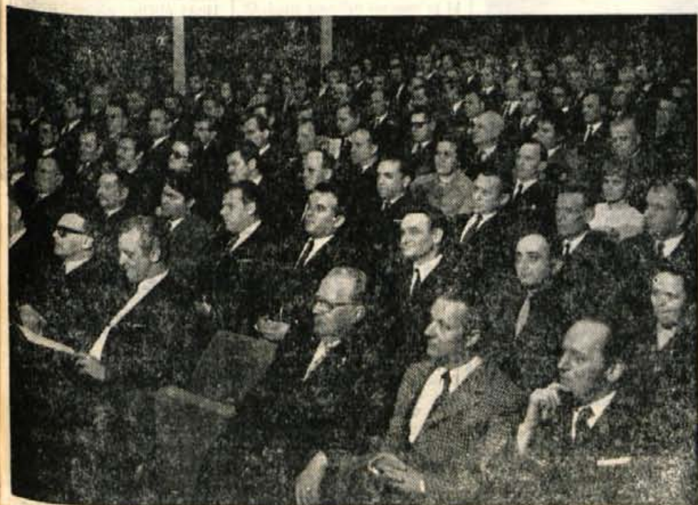
S slavnostno sejo delavskega sveta je kolektiv Save minuli petek proslavil 50. obletnico obstoja podjetja.

GLASILO SOCIALISTIČNE ZVEZE DELOVNEGA LJUDSTVA ZA GORENJSKO