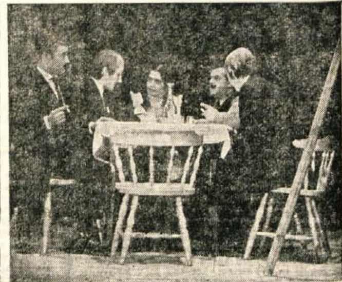
Prizor iz prvega dejanja

Toliko o predstavi sami. A v naslovu zapisa smo si naložili nalogo, spregovoriti o Cankarju na Koroškem.