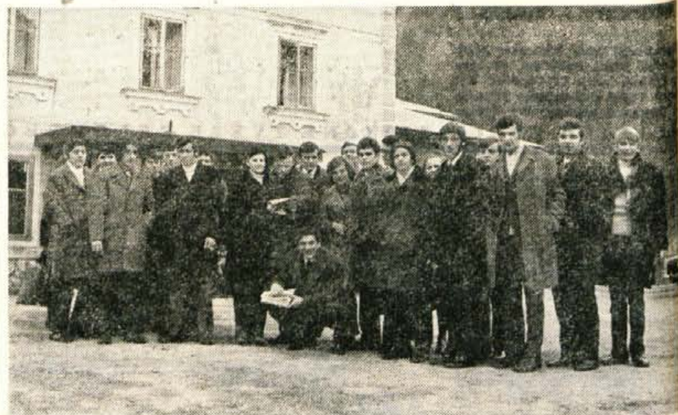
SEMINAR ZA MLADE SAVČANE — Mladinska organizacija v tovarni Sava je konec minule tedna pripravila na Jezerskem dvodnevni seminar za predstavnike vodstev mladinskih aktivov. Na seminarju so med drugim obravnavali položaj kranjske industrije, letni in petletni gospodarski načrt podjetja, vlogo in naloge mladinske organizacije v podjetju itd. (A. Z.)