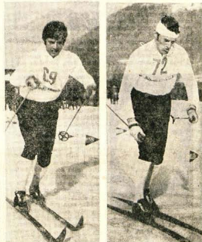
Kalan (Gorje) 1. mesto Kobilica (Gorje) 3. mesto