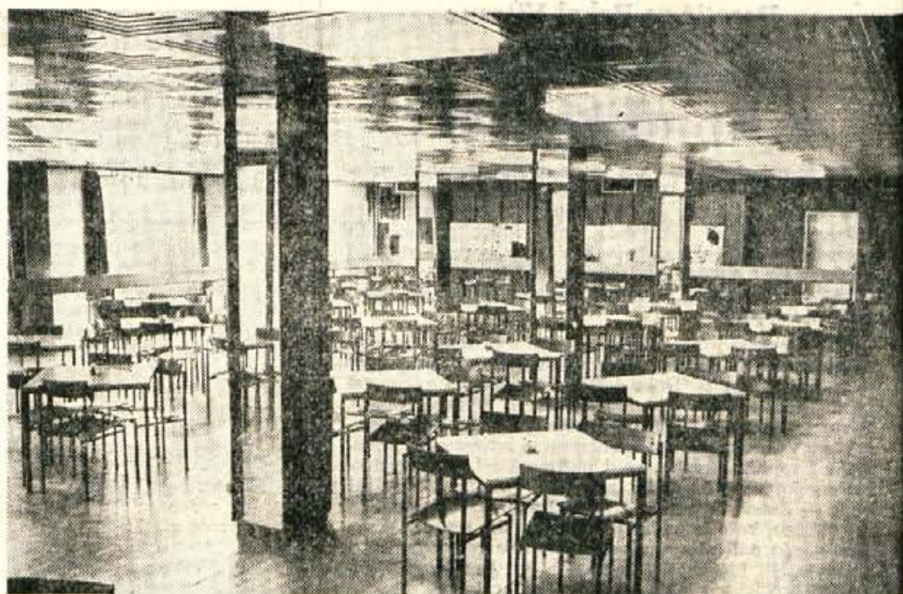
Delavci Alplesa in ostali prebivalci Zeleznikov se lahko hranijo v novi sodobni samopostrežni restavraciji. Hrana ni draga, saj stane kosilo od pet do sedem dinarjev.