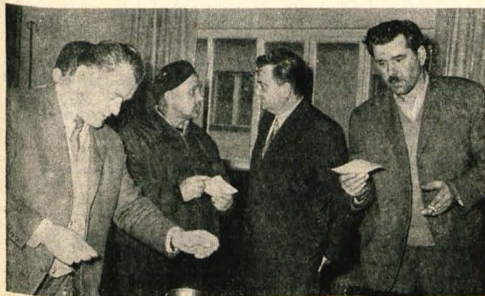
Pripadniki enot civilne zaščite so se hitro zbrali.