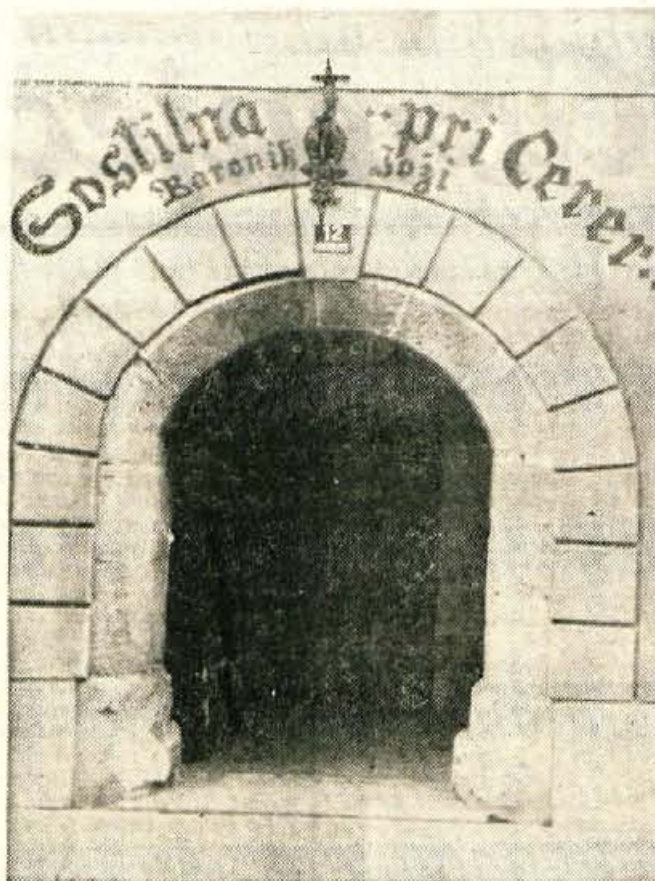
Vojna zaradi gotice. — Foto: J. Vidic