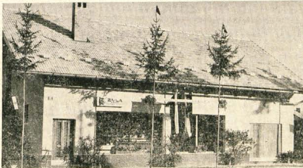
Za praznik nova trgovina, zbiralnica mleka in prostorj krajevnih skupnosti.

nega odbora občinske konference SZDL Jože Kavčič, predstavniki podjetja Zivila Kranj in drugi.