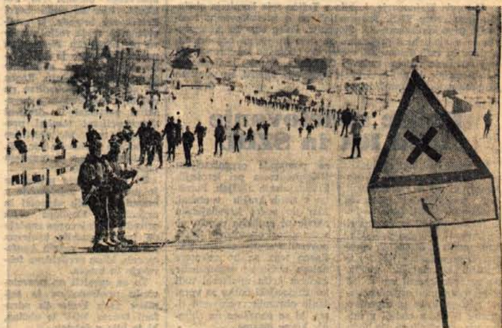
Smučarski živžav v Kr. gorl. Na desni novi smučarski (prometni) znak.