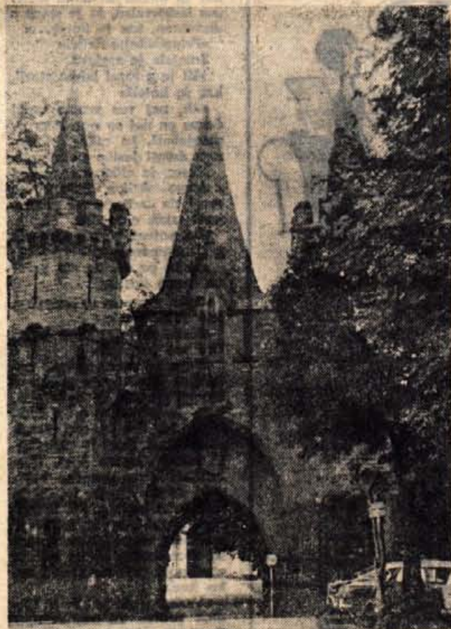
Hradec — vhod v dvorec