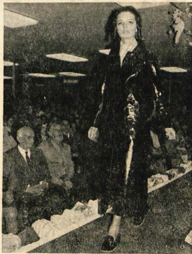
Podjetje Murka je na Jesenicah poznano tudi po modnih revljah. Ogledalo si jih je veliko obiskovalcev. Poleg modnih revlj v novembru (ob prikazu večernih cocktail oblek, usnjene in krznenе konfekcije, modnih pokrival), bo zanimiva tudi modna revija, ki bo v blagovnici na Jesenicah 29. oktobra. Obiskala jo bosta tudi Slovenski par 70 v narodni noši.