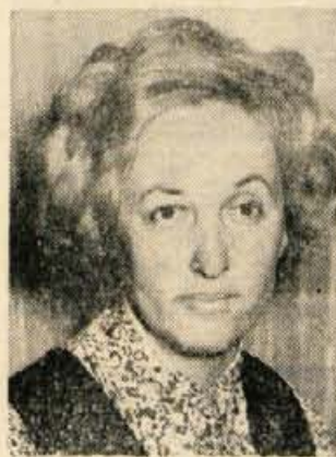
Zvab Olga, Valjavčeva 4, Kranj je izžrebala naslednje naročnike: