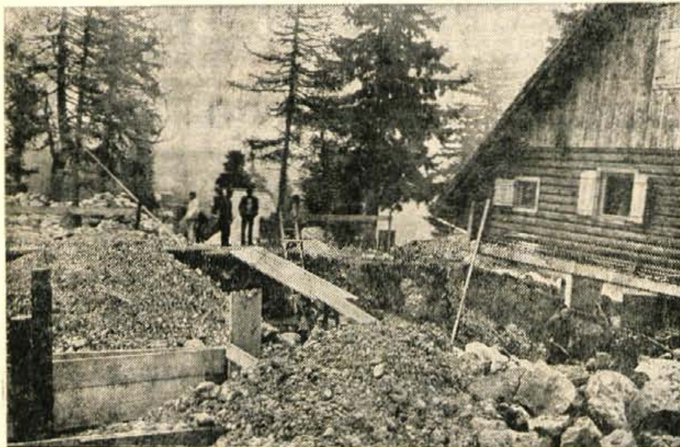
Letališče Brnik gradi poleg brunarice novo samopostrežno restavracijo.