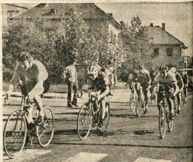
Na zadnji kolesarski dirki letošnje sezone so se v nedeljo na 9,3 km dolgi progi Kranj—Predoslje—Britof—Kranj pomerili najboljši slovenski kolesarji. Slika prikazuje vožnjo članov. (dh)