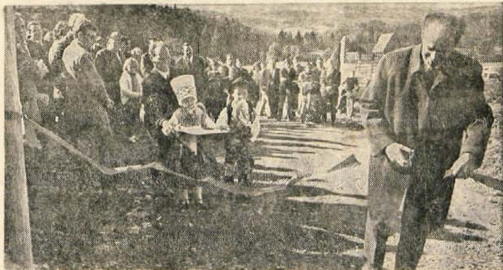
Gradnja okrog 5,5 km dolgega odseka nove ceste Stiška vas — Ambrož je veljala prek 30 milijonov starih dinarjev. V nedeljo jo je slovesno odprl predsednik kranjske občinske skupščine.