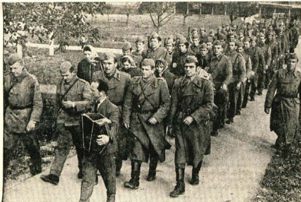
Po končani vaji so borci s prapori, harmoniko in partizansko pesmijo prikorakali v »osvobodilno« Cerklje