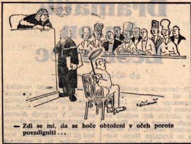
— Zdi se mi, da se hoče obtoženi v očeh porote povzdigniti...