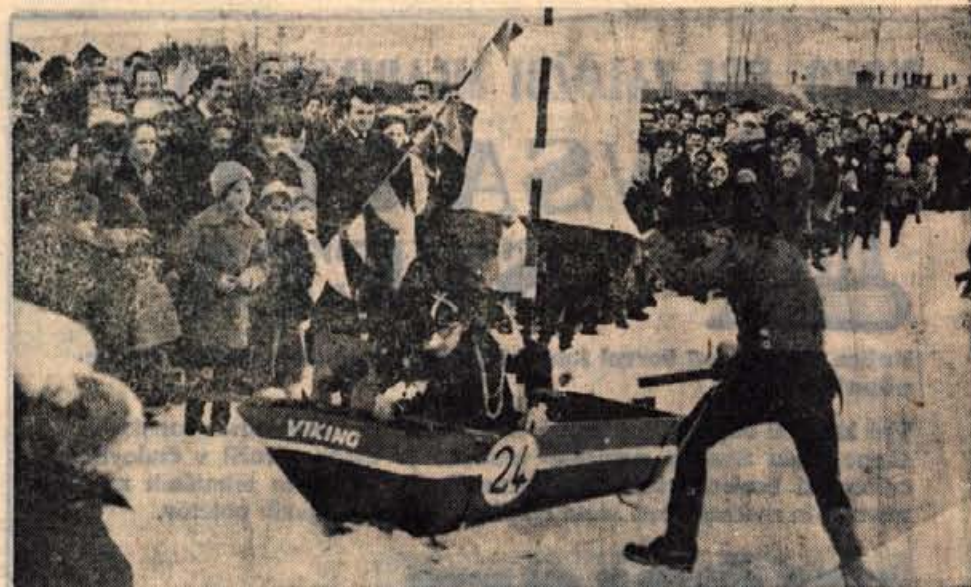
Z lanskoletnega smojkarskega tekmovanja v Hofavljah