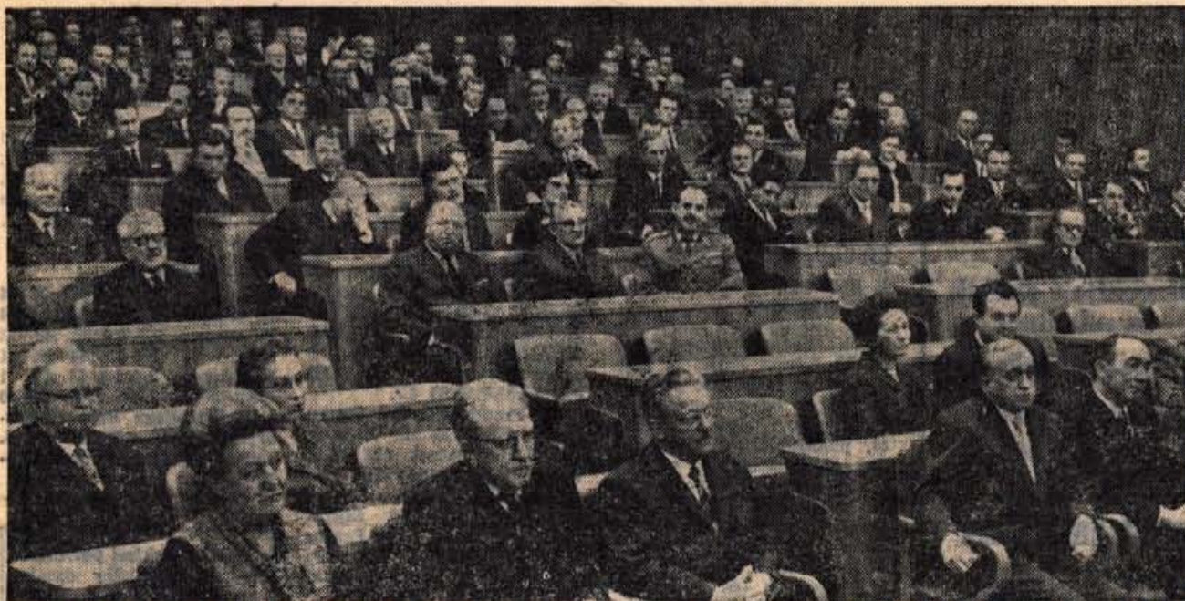
S slavnostne seje ob 60-letnici Edvarda Kardelja