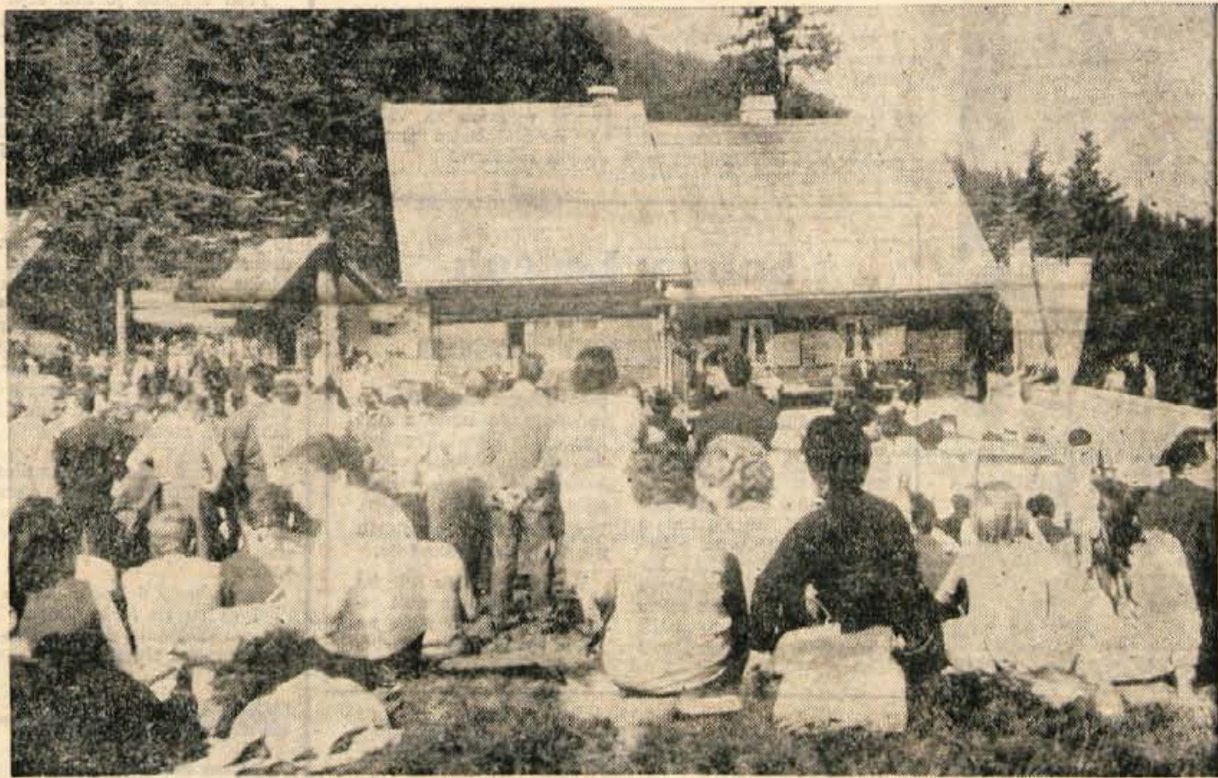
S prvega srečanja samoupravljalcev škofjeloške občine pri Litostrojski koči na Soriški planini