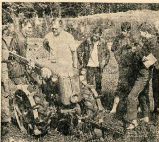
Za enoosni traktor rapid je bilo veliko zanimanje