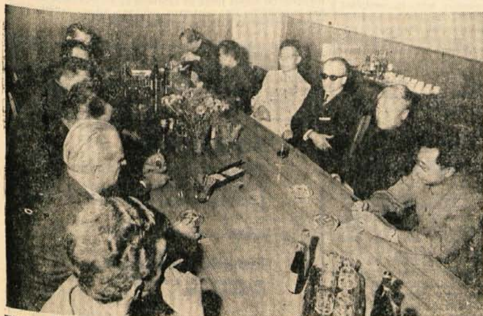
KITAJSKI GOSPODARSTVENIKI V KRANJSKI ISKRI — Gospodarska vladna delegacija LR Kitajske, ki je na obisku v naši državi in se te dni mudi v Sloveniji, je včeraj popoldne obiskala tudi kranjsko tovarno Iskra. Ogladali so si nekatere proizvodne obrate. O pomenu Iskre pa so se pogovarjali s predstavniki Združenega podjetja in kranjske Iskre. — A. Z. — Foto: F. Perdan