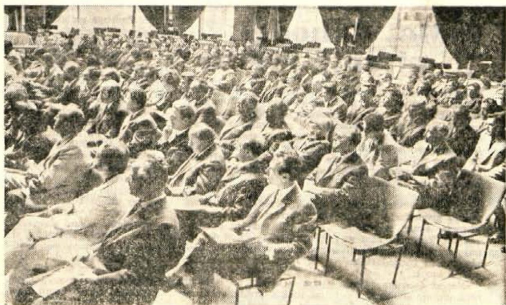
Na petkovi slavnostni seji delavskega sveta je kolektiv podjetja Ljubljana Transport praznoval 70-letnico obstoja podjetja in 20. obletnico samoupravljanja.