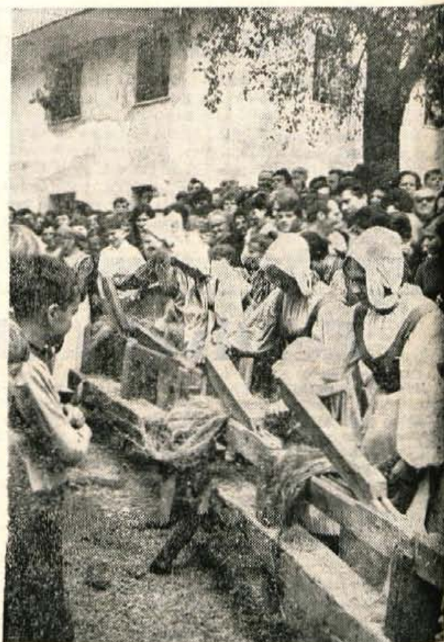
Tarice so urno obdelale lanene »butare«.

Ženin, le rad jo imej, in drugih nič več ne glej, ti pa mu, brhka nevesta, ostani do konca dni zvesta.