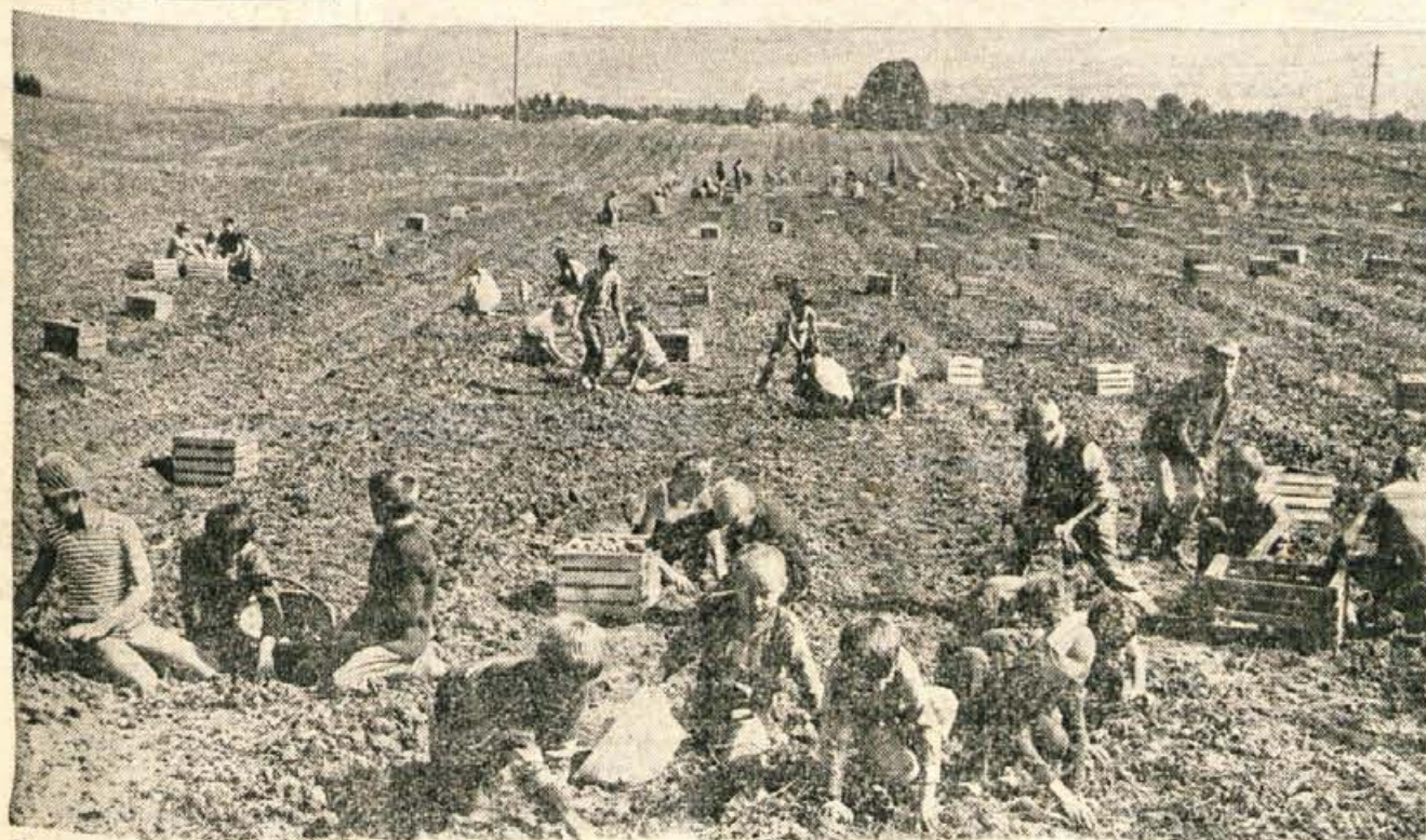
Krompirjeva letina na Gorenjskem je letos zelo dobra. Tako kot prejšnja leta so tudi letos Kmetijsko-živilskemu kombinatu Kranj pri pobiranju krompirja priskočili na pomoč učenci osnovne šole France Prešeren. Z denarjem, ki ga učenci dobijo od pobiranja krompirja, gredo potem ob koncu šolskega leta na izlet. — Pobiranje krompirja ni najbolj lahek posel. Mnogi kmetje pravijo, da je to danes najbolj zamudno delo na polju.

V dvorani Kazine na Bledu bo v petek opoldne slavnostna seja podjetja Ljubljana Transport. Z njo bodo proslavili 70-letnico obstoja oziroma delovanja podjetja. Ta dan dopoldne pa bodo v prostorih Doma podjetja v Ljubljani odprli tudi razstavo o razvoju podjetja. A. Z.