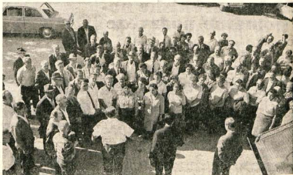
Dvodnevnega izleta upokoencev Save se je udeležilo okrog 150 nekdanjih članov kolektiva

»1966. leta sem šel v pokoj, pred tem pa sem delal v Savi 40 let. Nekaj časa sem delal v mehanični delavnici, potem sem bil šofer, nazadnje pa vodja transporta. Sedaj še malo »honorarčim«, pa veliko hodim v gozd. Na izletu sem bil že lani in predlanskim. To je lepa ideja in prav škoda, da se tudi druga podjetja na podoban način ne spomnijo svojih nekdanjih delavcev. Ni lepo, da ponekod nekdanje člane kolektiva tako hitro pozabijo.« A. Z.