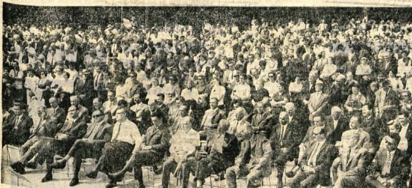
II. zbora gorenjskih aktivistov in srečanja borcev jeseniško-bohinjskega odreda v Bohinju so se v nedeljo dopoldne v Ukancu udeležili številni aktivisti, borci, prebivalci Gorenjske in tudi najvišji predstavniki republike.