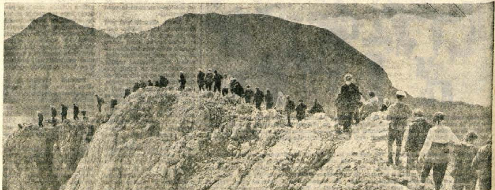
Med drugimi je ob Aljaževem domu na vrhu hrabre planinke pozdravil tudi predstavnik planinske zveze Slovenije. Zazel je vsem, ki so prvič prišle tako visoko, da to ne bi bilo tudi zadnjič, da bi postal beg v svet med vrhovi vse bolj množična navada in potreba sodobnega človeka.