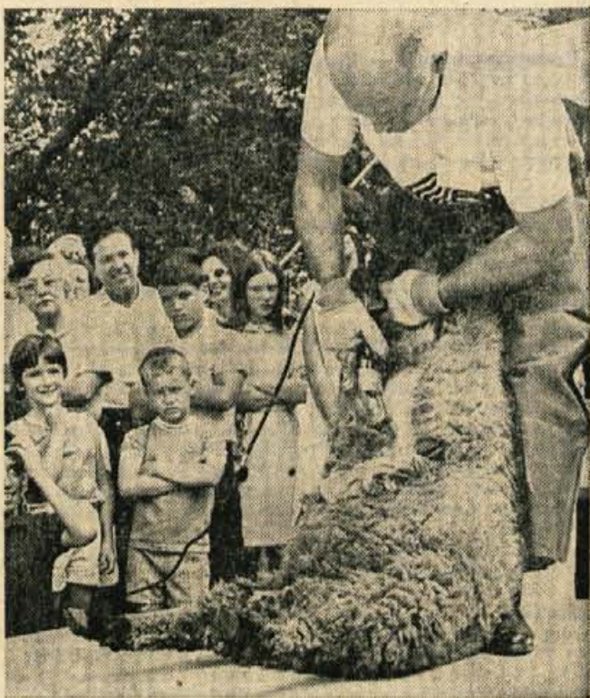
Prizor iz filma »Festival v Washingtonu« (ZDA).