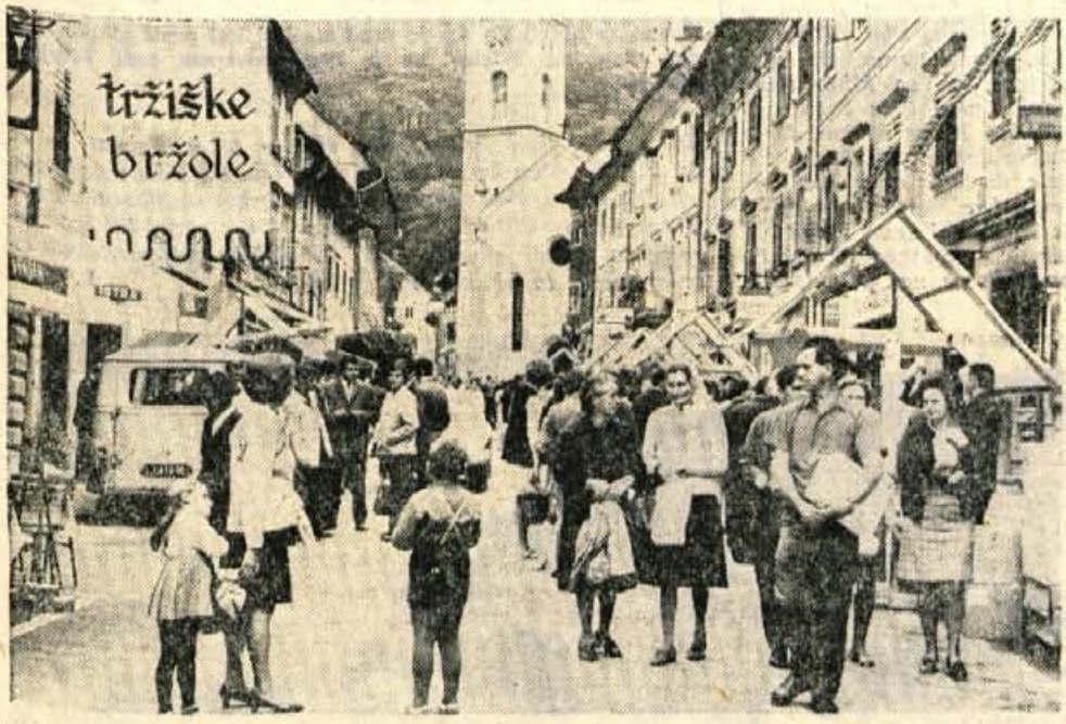
Šušarska nedelja v Trzinu je uspela. Dež je v soboto pa tudi v nedeljo malo zagodel organizatorjem in marsikakšnega obiskovalca odslovil, ni pa pregnal razpoloženja in šušarskega vzdušja. Ze sobotno prireditev ob 20-letnici delavskega samoupravljanja v tovarni Peko je obiskalo vsaj 2000 ljudi, lep je bil tudi obisk obeh razstav: čevljarske zbirke v muzeju in Pekovih izdelkov v paviljonu NOB.