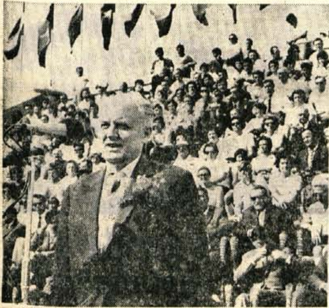
Jubilejno X. svetovno padalsko prvenstvo Bled 1970 je v nedeljo nekaj po 14. uri na letališču v Lescah odprl zastopnik pokrovitelja tovariša Tita, predsednik republiške skupščine Sergej Kraigher.

GLASILO SOCIALISTIČNE ZVEZE DELOVNEGA LJUDSTVA ZA GORENJSKO