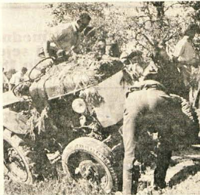
Kmalu po otvoritvi modernizirane ceste za Volčji potok je zdrsil traktor s ceste. K sreči brez posledic.