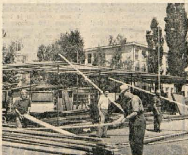
Priprave na Gorenjski sejem.

Zato ne oklevajte in kupite sobotni Glas. Mogoče čaka nagrada ravno vas!