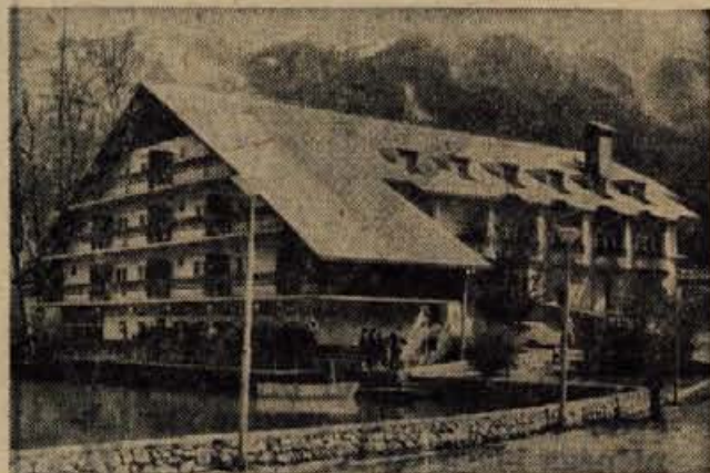
OBISČITE HOTEL BOR V PREDDVORU. VSAK VEČER, RAZEN TORKA GLASBA, PLES, V HOTELU JE NA VOLJO TUDI SAVNA.

Avto-moto društvo Kranj bo v soboto organiziralo na dirkališču v Stražišču drugo dirko v speedwayu z mopedi za odprto prvenstvo Gorenjske. Prireditve pa bo hkrati tudi v počastitev 25-letnice osvojitve. Prvo tovrstno tekmovanje letos je bilo na sporedu v začetku maja, tretja dirka pa bo v septembru. Prireditve v soboto 13. junija se bo pričela ob 16. uri