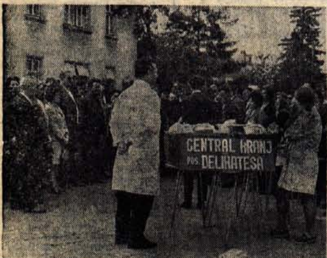
Pred odhodom na izlet sta uslužbenca kranjskega podjetja Central našim izžrebancem razdelila bogate popotnice.