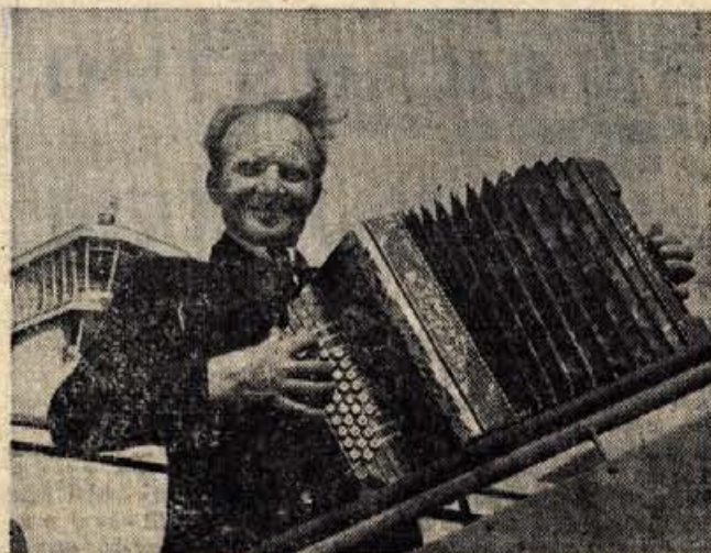
Harmonikarju Franciju, Grčiču domače, zlepa niso pošle moči. Ves ljubi dan je nategoval svoj meh in še v letalu, 3000 metrov visoko, ni prenehal pritiskati na tipke.

Dvajset minut kasneje smo znova ždeli v avtobusih, ki sta jo ubirala proti Brniku. Blížal se je veliki finale — potovanje z letalom DC-6, last podjetja Inex-Adria avio-promet. V restavraciji aerodroma Ljubljana so nam najprej servirali obilno ko-