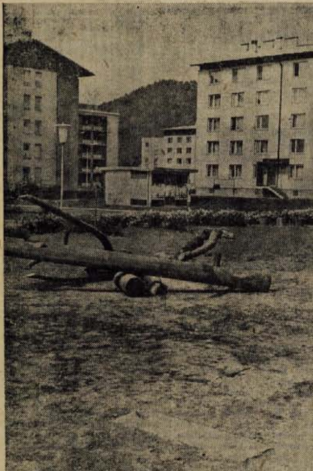
Z betonskega podstavka so objestneži odtrgali in prestavili gugalnico.