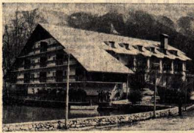
OBIŠČITE HOTEL BOR V PREDDVORU. VSAK VEČER, RAZEN TORKA GLASBA PLES. V HOTELU JE NA VOLJO TUDI SAVNA.