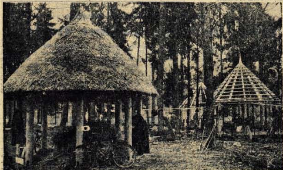
V smrekovem gozdiču blizu razstavnih prostorov stojijo lesene, s slamo krite stojnice, pod katerimi si bodo obiskovalci letalske razstave gasili žejo in lakoto.

Skica letališča in okolice prikazuje, kako bodo lahko vozili avtomobilisti, namenjeni na veliko letalsko razstavo, ki se začne jutri, 21. maja, dopoldan, konča pa 25. maja. Promet po odseku ceste Brnik—Kranj bo enosmeren. Za osebna vozila so pripravili več parkirnih prostorov, ki jih tudi lahko najdete na skici. Dobro je viden obvoz, s katerim nameravajo razbremeniti cesto mimo aerodroma. (-lg)