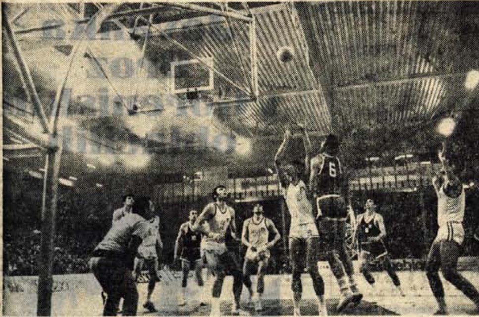
Prvo tekmo v finalu VI. svetovnega prvenstva je reprezentanca Jugoslavije odigrala z Italijani in jih premagala za tri točke (66:63). V ponedeljek pa so naši visoko premagali reprezentanco Brazilije z rezultatom 80:55. Danes ob 20.30 je na sporedu tekma med Jugoslavijo in CSSR. (L. B.)