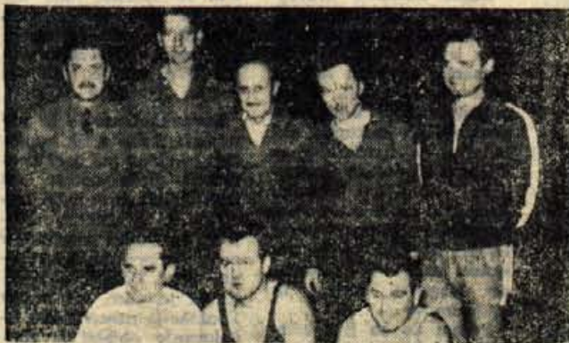
Kegljači Triglava so v nedeljo že sedmič osvojili naslov državnega ekipnega prvaka. Na drugo mesto se je uvrstil zagrebški Medveščak, Jeseničani pa so se uvrstili na deveto mesto.