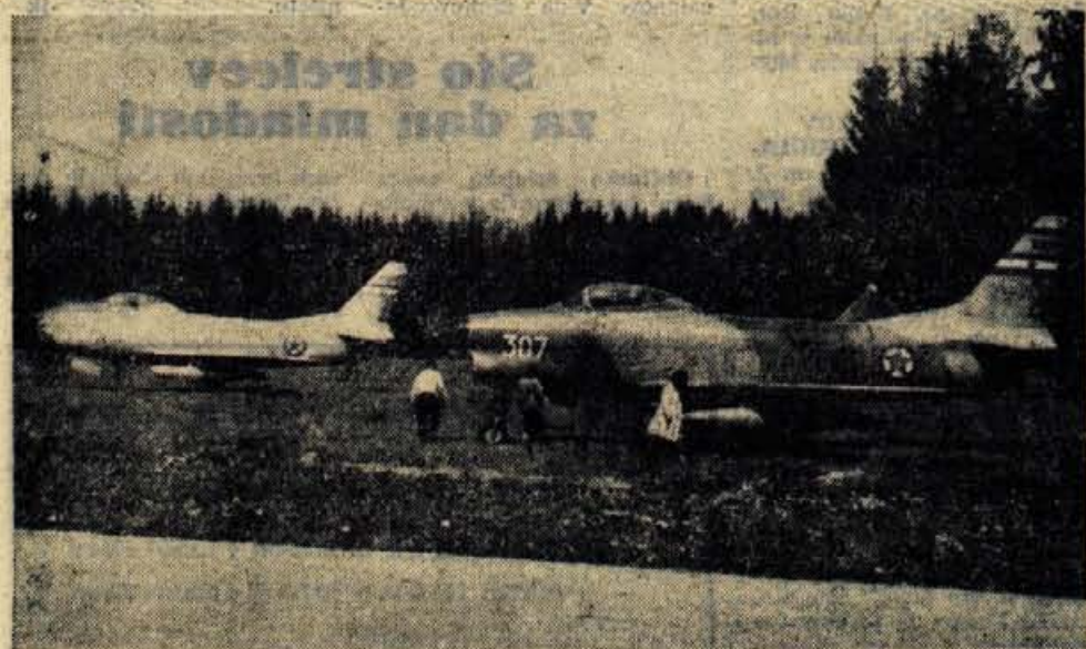
Prvi dve izmed kopice letal, ki jih bomo imeli priliko videti med šestdnevno razstavo na letališču Brnik, so pripeljali že pred štirinajstimi dnevi. Gre za nadzvočna lovca tipa sabre. Reaktivce te vrste so američani uporabljali med korejsko vojno, danes pa ne predstavljajo več zadnje besede letalske tehnike (-lg)