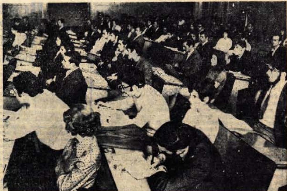
S tretjega majskega srečanja mladine v Kranju.

Pogoj: končana osemletka Prednost pri izbiri bodo imeli kandidati z odsluženim vojaškim rokom. Pismene prijave sprejema kadrovska služba (delovna razmerja) najkasneje do ponedeljka 25. 5. 1970.