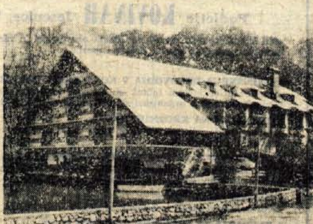
OBISČITE HOTEL BOR V PREDDVORU. VSAK VEČER, RAZEN TORKA GLASBA, PLES. V HOTELU JE NA VOLJO TUDI SAVNA.

GASILSKO DRUSTVO BREG ob Savi priredi v nedeljo, 24. maja, ob 15. uri veliko VRTNO VESELICO. Igrajo VESELI RETECANI. V primeru slabega vremena bo veselica 31. maja. Vsi vljubljeni! 2304