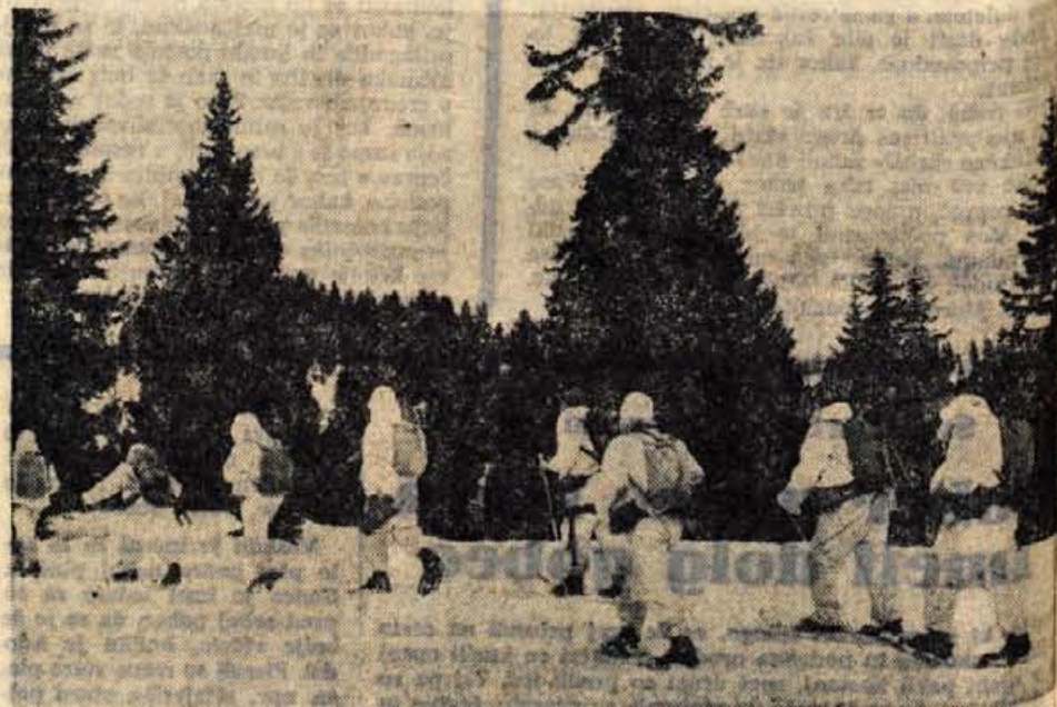
Pripadniki posameznih enot so bili dobro opremljeni