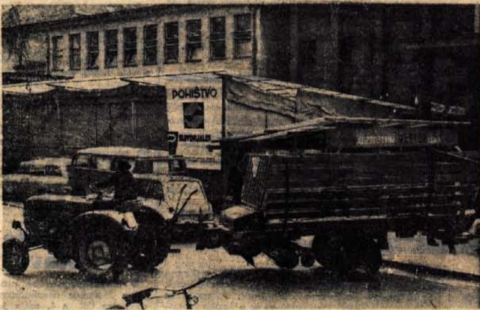
Na 6. spomladanskem gorenjskem sejmu so prodali precej kmetijskih strojev.