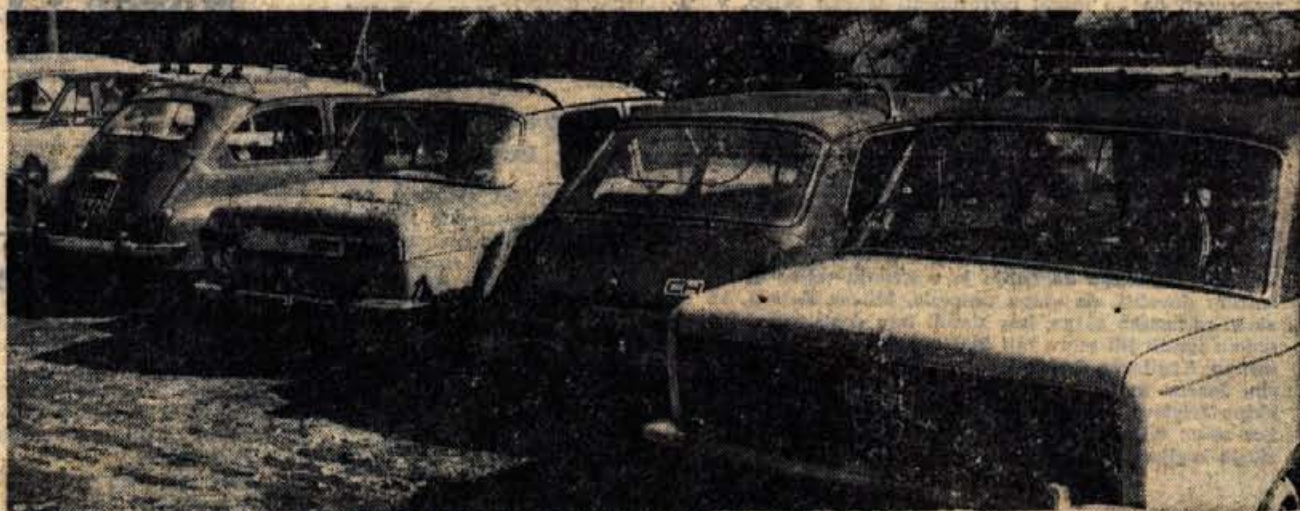
Na spodnji postaji krvavake žičnice je bilo letos videti tudi veliko tujih vozil (tujcev).