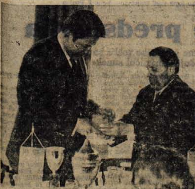
S strelskega dvoboja Celovec : Kranj: predsednika strelskih Celovec (levi) in Kranja (desni)

ODEBJKA — V drugi zvezni ligi so Jesenicani po pričakovanju na domačem igrišču položili orožje pred vodilnim železničarjem 1:3. Prihodnje nedeljo bodo Jesenicani nastopili spet doma in se pomerili z Brezo.