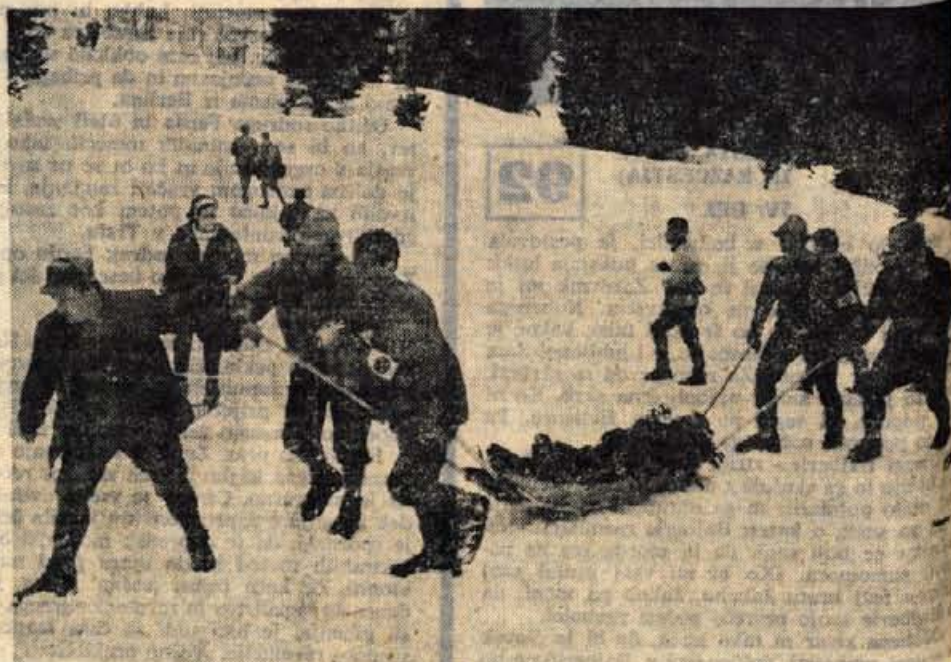
Enotam gorske reševalne službe med vajo ni bilo treba posredovati. Pomagali pa so nekaterim smučarjem, ki jih je bilo v soboto na Krvavcu kar precej in jih vaja ni prav nič motila.