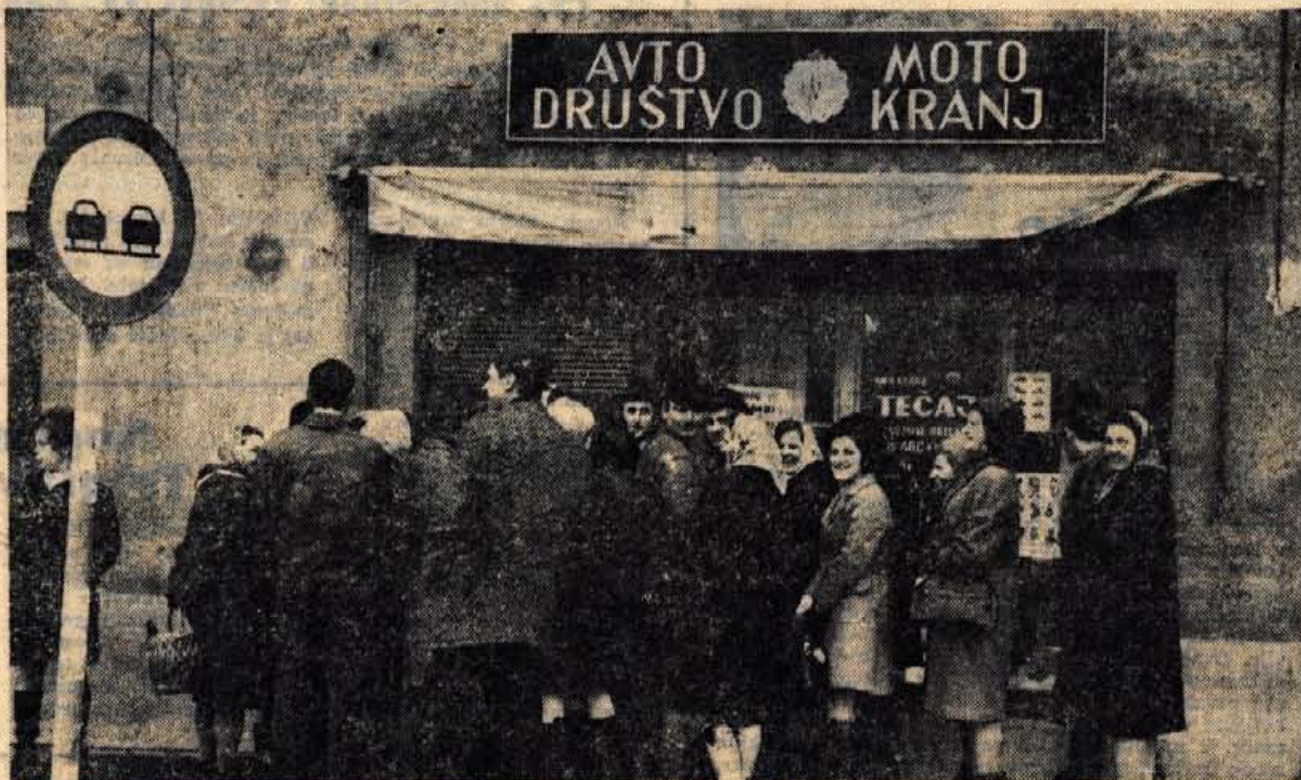
Vozniki šele bodo, zato se ne zmešajo za red, za prometni znak na levi.

Seznam naprav, ki naj bi jih pokazali, je izredno pester. Največ zanimanja bodo bržkone vzbudila vojaška letala: mig 21, galeb, jastreb, kragulj, NL-12, F-84 G in C-47, helikopter MI-4, protivzgonska raketa, reakcijski motorji, navigacijski instrumenti, radarji ter kompleti letalske opreme. Razen tega je predvidenih več desantov s padalci in nekajkratni nastop akrobatske skupne reaktivcev galeb in jastreb. Kot posebno zanimivost velja omeniti, da so se organizatorji odločili prirediti vrsto reklamnih poletov z letalom DC-6B, in sicer za učence vseh osnovnih šol v Sloveniji. Mladim potnikom, predvsem tistim z odličnimi ocenami, bo polovico stroškov plačal prireditelj, polovico — 50 do 60 novih din — pa bodo prispevale šole oziroma starši. —lg