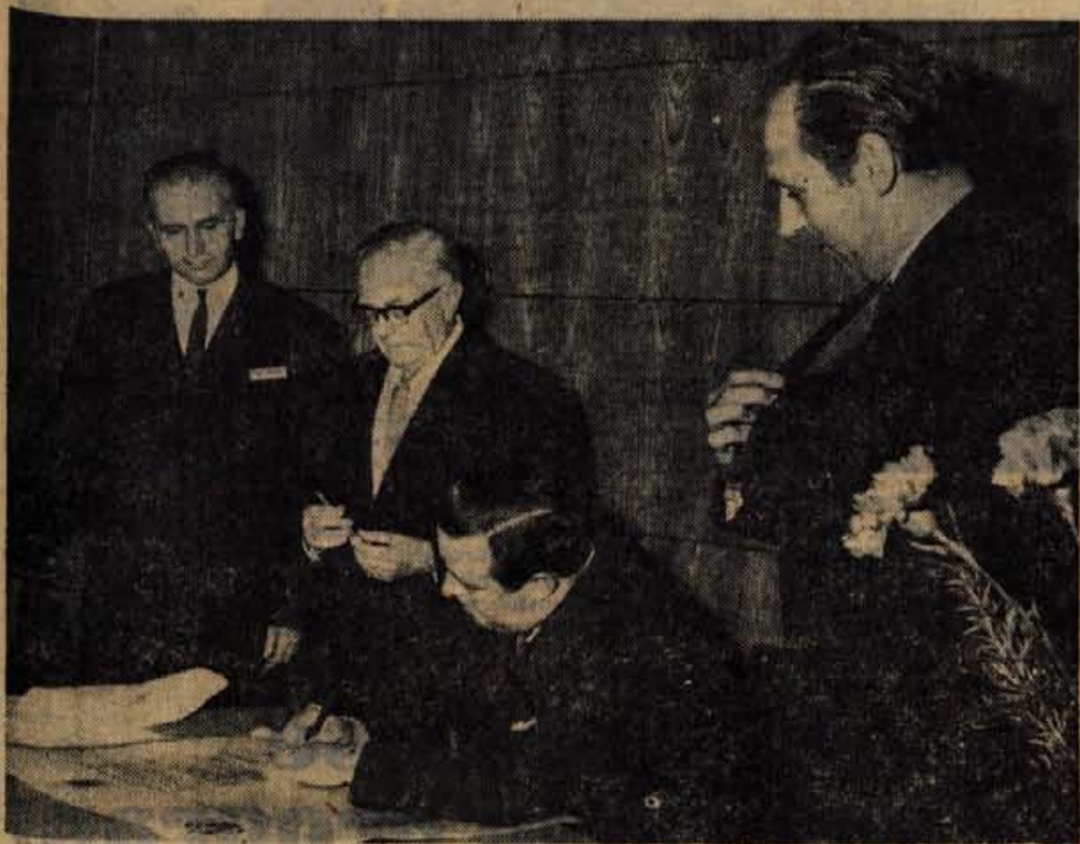
Na seji občinske skupščine so v četrtek popoldne ob 10-letnici prijateljstva med Kranjem in Oldhamom podpisali listino o nadaljnjem sodelovanju.

Ob 10. obletnici prijateljstva med Kranjem in Oldhamom