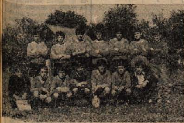
PIONIRJI NOGOMETASI! OD KOD JE TO PIONIRSKO NOGOMETNO MOSTVO?

In zdaj brž k novi uganki. Upam, da ni pretežka.