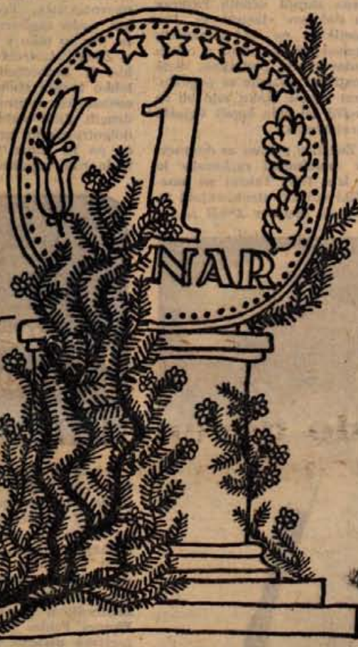
Prišla je pomlad zelena