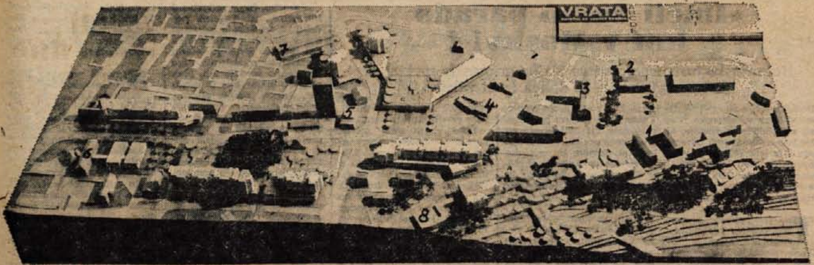
Objavljena maketa Vrata je v natečaju dobila prvo nagrado. Za lažjo predstavo oziroma razumevanje smo s številkami od 1 do 8 označili nekatere sedanje objekte: 1. gimnazija, 2. delavski dom, 3. občinska skupščina, 4. kino Center, 5. Gorenjska kreditna banka, 6. Bolnišnica za ginekologijo in porodništvo, 7. CP Gorenjski tisk, 8. Komunalno podjetje Vodovod