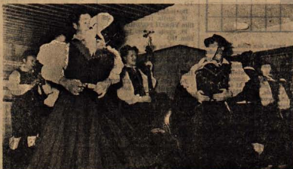
Člani folklorne skupine Bohinj so se predstavili z nekaterimi narodnimi plesi.

Najbrž so bili naslednji dan enakega mnenja tudi kolegi iz Ilustrovane politike.