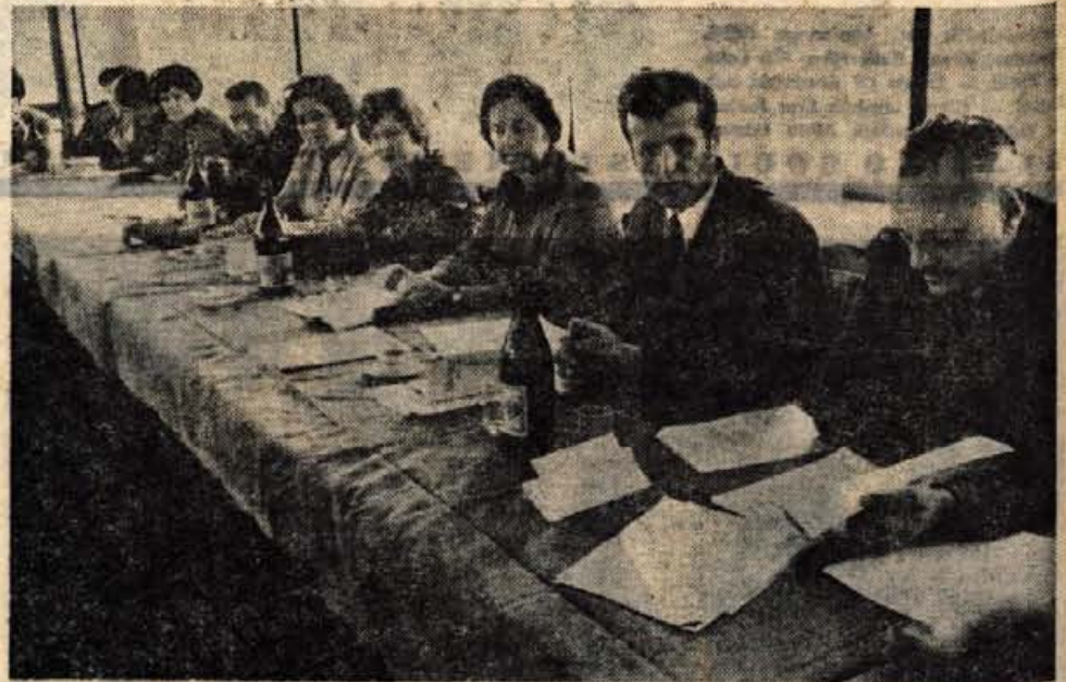
SEMINAR ZA PREDSEDNIKE SINDIKALNIH ORGANIZACIJ — V hotelu Krim na Bledu so bili v ponedeljek, torek in sredo celodnevni seminarji za predsednike izvršnih odborov sindikalnih organizacij prometa in zvez, industrije ter družbenih služb iz kranjske občine. Semškega sveta o političnih ocenah in nalogah slovej, na njih pa so razpravljali o stališčih republikarje je pripravil občinski sindikalni svet Kranjskih sindikatov in o samoupravnih aktih. — Na sliki: predsedniki izvršnih odborov sindikalnih organizacij v družbenih službah na sredini seminarju. (A. Z.)

Obenem vladno vabimo vse tečajnike, da po svojih možnostih podpro z denarnim zneskom gradnjo te šole. Denar nakažite na tekoči račun št. 5202-652-66 pri SDK Idrija — Sklad za izgradnjo osnovne šole Cerkno.