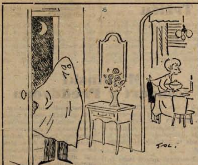
— Draga, zdaj grem po tvojo mamo ...