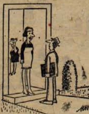
— Gospa ravno telefonira. Vrnite se čez tri ure ...