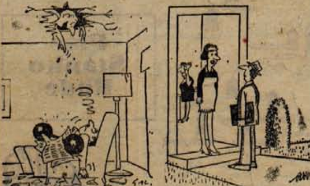
— Slišite vi, mi hočete vrniti mojo utež?