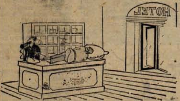
— Verjemite mi, tovariš, da je nocoj hotel res popolnoma zaseden!