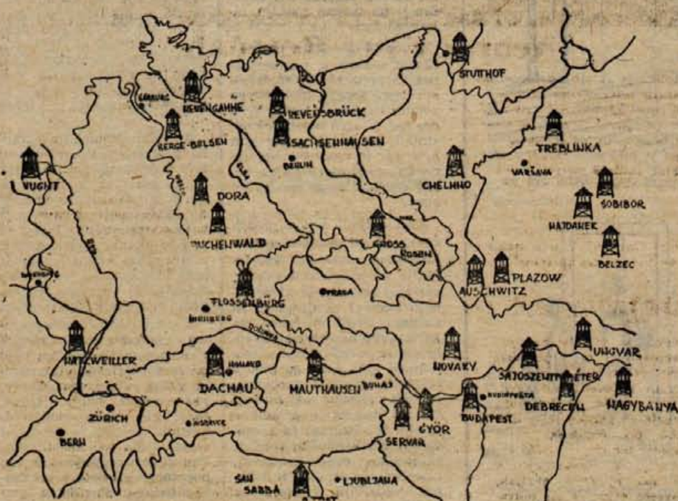
Nemška koncentracijska taborišča