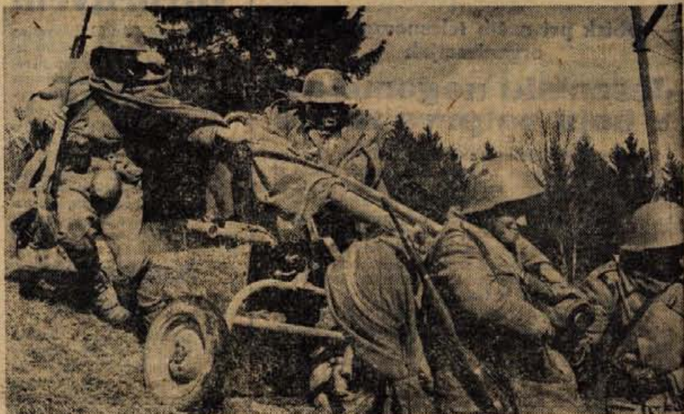
Blato, dež, sneg in izredno težki terenski pogoji so bili velika preizkušnja za enote JLA, teritorialno obrambo in civilno zaščito. Po končanih vajah pa smo na obrazih vseh opazili sicer utrujen, vendar zadovoljen nasmeh.