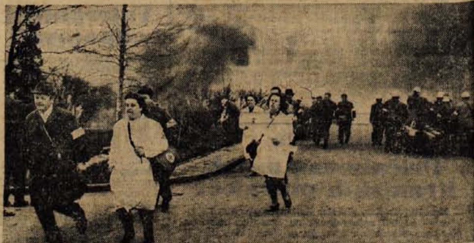
Letala so napadla tovarno Titan v Kamniku. Enote civilne zaščite so takoj stopile v akcijo in uspešno prestale preizkušnjo. — Na sliki: reševalna ekipa in gasilci iz Titana