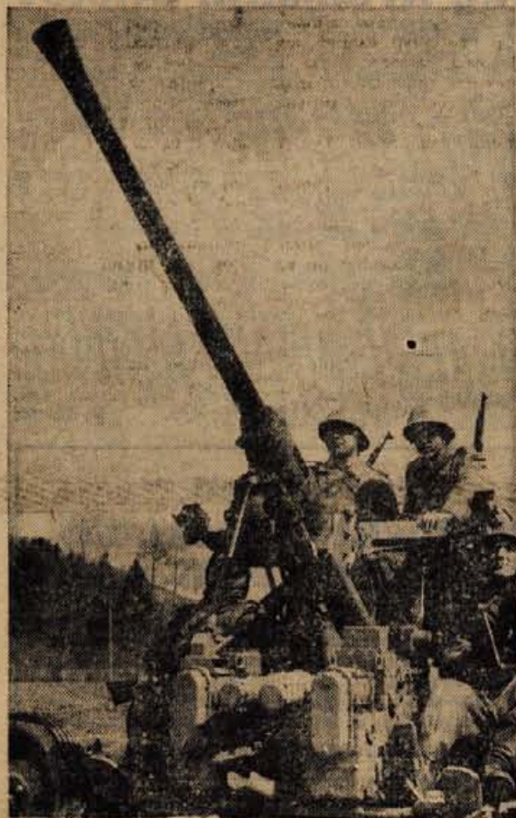
Na vajah so sodelovale enote z vsemi vrstami orožja. Pomembno vlogo je v tej »vojni« odigrala tudi protivzletna obramba. — Na sliki: protivzletni top v akciji

Pravzaprav bi lahko rekli, da je bila to prava vojna, v kateri so sodelovale vojaške enote ljubljanskega armadnega področja, enote teritorialne obrambe in civilne zaščite ter prebivalci. Razlika je bila le v tem, da so mrtve in ranjene v njej določali »sodniki«, ki so spremljali vsako enoto.