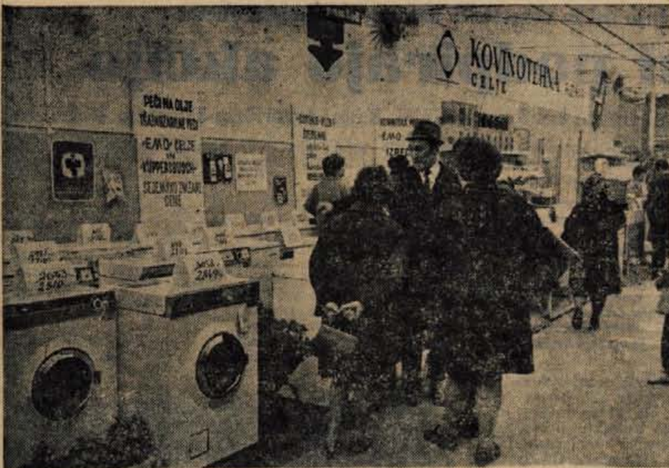
Obiskovalci so se na sejmu zelo zanimali za gospodinjske stroje.