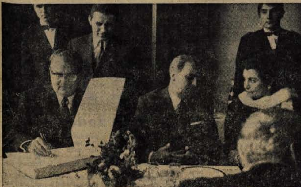
V nedeljo je predsednik Tito obiskal Golf hotel na Bledu.

List izhaja od oktobra 1947 kot tednik. Od 1. januarja 1958 kot poltednik. Od 1. januarja 1960 trikrat tedensko. Od 1. januarja 1964 kot poltednik, in sicer ob sredah in sobotah