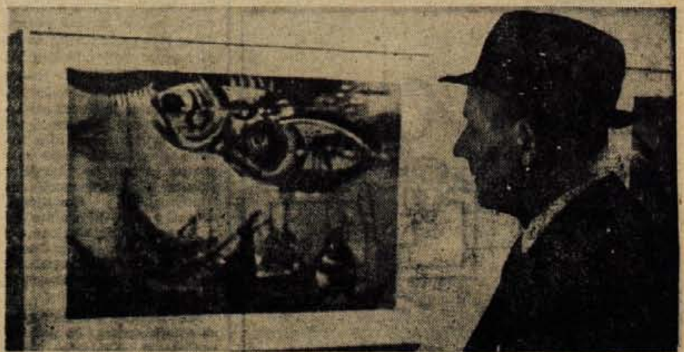
Detajl z razstave akademskega slikarja Miligoja Dominka, ki so jo odprli minuli petek, 3. aprila, zvečer v galeriji Mestne hiše.