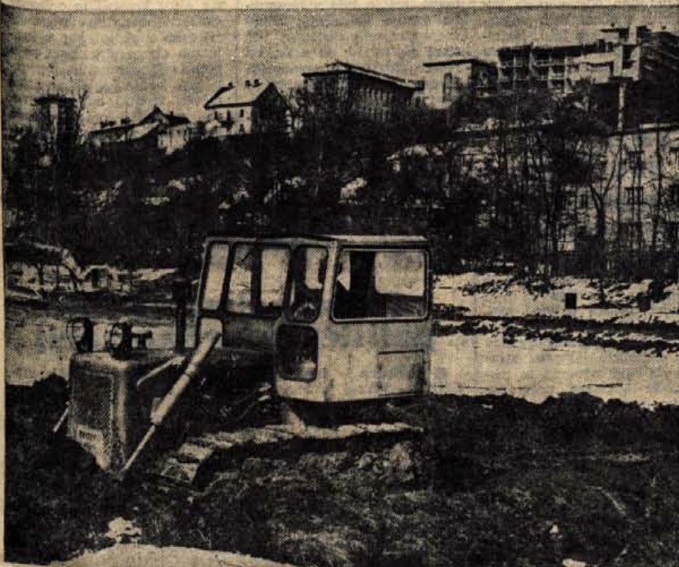
V Savskem logu, na mestu, kjer bodo stali novi prostori Gorenjskega sejma, so pred kratkim zagrmeli bagri in zasadili prve lopate.