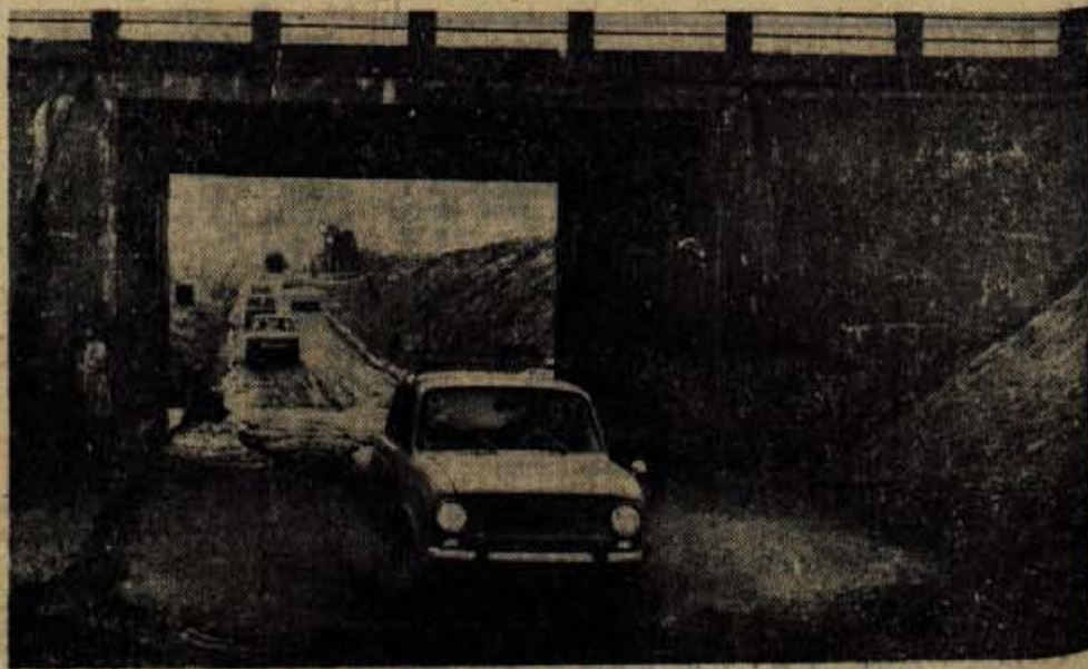
Vozniki, avto lahko zastoj operete pod »radovljiškim podvozom«.