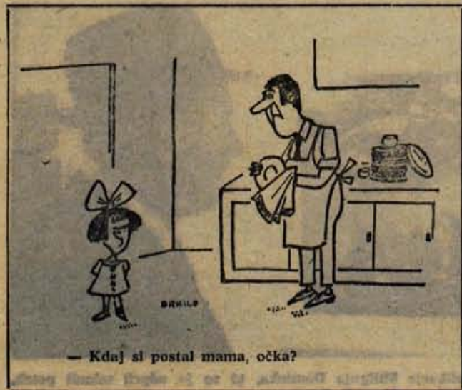
— Kdaj si postal mama, očka?

Na univerzitetni kliniki v Moskvi so začeli preučevati kaj nenavaden način zdravljenja kožnih bolezni. Bolnik mora stradati in menda se na ta način reši neprijetne koprivnice in še nekaterih kožnih bolezni. Gladovanje traja sedem, deset ali dvajset dni, odvisno od tega, kako bolnik prenaša tako »zdravljenje«. Med tem sme bolnik piti samo mineralno vodo. Zdravniki priporočajo tudi kar najdaljše bivanje na svežem zraku. Po preteku stradanju posvečenih dni začne bolnik postopoma spet prehajati na prejšnjo prehrano. Najprej začne uživati redke, kasneje gostejše sadne sokove, sadje, zelenjavo in mlečne izdelke.