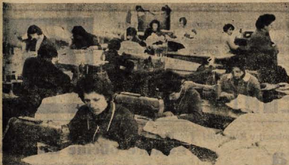
Tako prostori kot tudi stroji, ki jih uporablja kolektiv žirovskega obrata Modnih oblačil, so neprimerni in zastareli. Brez temeljitih izboljšav podjetje ne bo moglo prebroditi krize, v kateri se je znašlo.