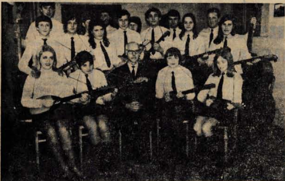
Tamburaški orkester KUD Janko Krmelj iz Rateč pri Škofji Loki.