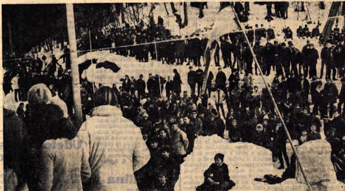
Mladina na Planici: tudi mi smo za cilje učitelja in revolucionarja Zagarja.