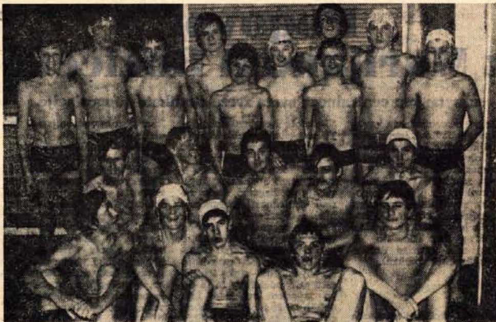
V Kranju pridno vzgajajo mlade vaterpoliste v okviru plavalnega kluba Triglav za novo sezono.