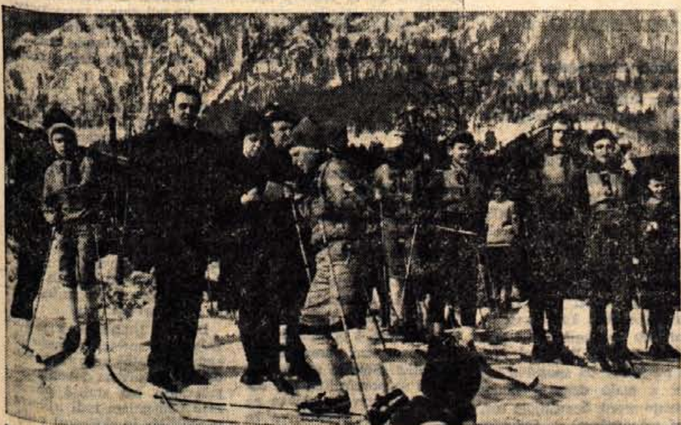
Preteklo nedeljo dopoldan je bil v Nemiljah pri Kranju troboj v smučarskih tekih. Nastopili so: SK Triglav, SK Alpes Zelnicki in SK Fužinar Ravne. Obenem je tekmovanje veljalo tudi za občinsko prvenstvo Kranja. Nastopilo je več kot 50 tekmovalcev. Tekmovanje je organiziral SK Triglav.

Sporod tekmovanja je naslednji: jutri bo smuk, v petek slalom, v soboto pa veleslalom. D. Humer