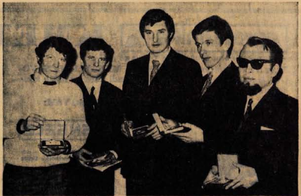
Najzaslužnejši člani kluba so prejeli posebna priznanja — plakete.

PETEK — 27. marca, ob 16. uri za red DIJASKI II: T. M. Plautus; DVOJČKA