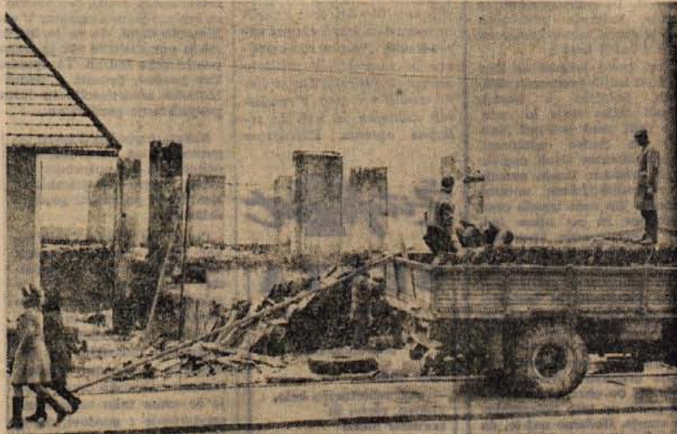
Na Jesenicah so pred kratkim začeli rušiti hišo nasproti starega gasilskega doma. S tem bodo napravili prostor novogradnjam, čeprav se ne vedo, kaj bodo zgradili na tem mestu, ker zazidalni načrt za to področje še ni izdelan (Jk)