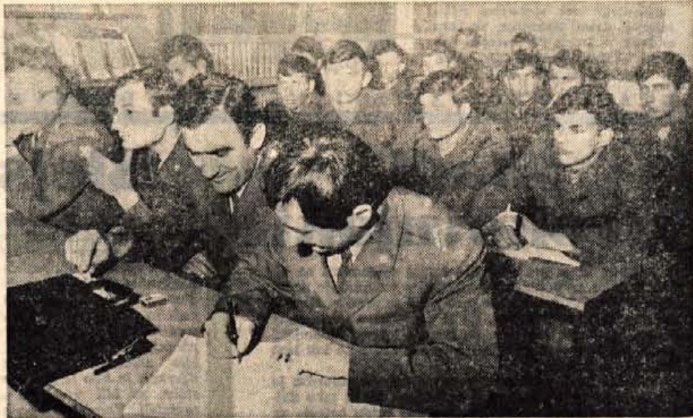
V garniziji JLA na Bohinjski Bell je bila minulo sredo seja konference zveze komunistov. Pripadniki JLA so sklenili, da bodo v prihodnje tesneje sodelovali z družbenopolitičnimi organizacijami v občini; predvsem na področju priprav na vseljidski odpor. Posebej pa bodo v prihodnje sodelovali z organizacijami zveze mladine in telesnovzgojnimi ter drugimi specializiranimi mladinskimi organizacijami. Konference so se udeležili tudi predstavniki občinskih družbenopolitičnih organizacij iz Radovljice.

V petek, 27. februarja, bo v Kranju 7. redna seja skupščine komunalne skupnosti za zaposlovanje občin Kranj, Škofja Loka, Trzin, Radovljica in Jesenice, na kateri bodo obravnavali statut komunalnega zavoda za zaposlovanje, sklepali o lanskem poslovnem poročilu zavoda in razpravljali o letošnjih izhodiščih zaposlovanja naših delavcev v tujini. —jk