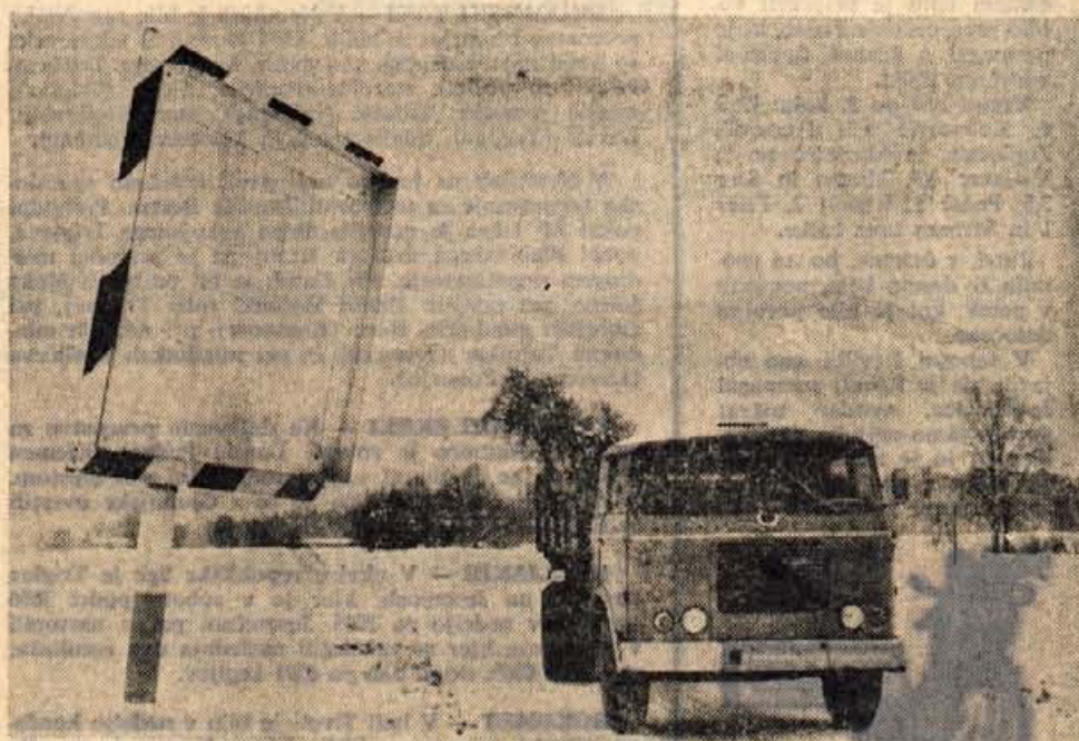
Cestna ogledala so danes precej draga. Eno stane okrog 70 starih tisočakov. — Vseeno pa bi bil že čas, da bi ga na križišču za Radovljico oziroma Begunje obnovili

Sicer pa tudi ureditev tega objekta spada v vrsto prizadevanj za lepšo podobo Kamnika. Po sklepu občinske skupščine bodo letos težišče dela usmerili k ureditvi mesta Kamnik. Ljubljanski urbanistični zavod je že izdelal potrebno dokumentacijo, oziroma idejne zasnove za ureditev mesta in okolice. Poseben problem so ozke ulice in ceste, ki ovirajo promet in so nenehno prisotna nevarnost tako za pešce kot motorizirane potnike.