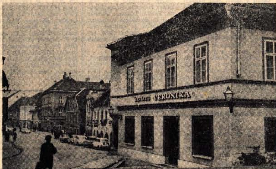
Na novo preurejena kavarna Veronika spada med najlepše tovrstne objekte v Kamniku. Nostanja ureditev je skladna s cenami, saj je v kavarni vse na visoki ravni.

Sicer pa tudi ureditev tega objekta spada v vrsto prizadevanj za lepšo podobo Kamnika. Po sklepu občinske skupščine bodo letos težišče dela usmerili k ureditvi mesta Kamnik. Ljubljanski urbanistični zavod je že izdelal potrebno dokumentacijo, oziroma idejne zasnove za ureditev mesta in okolice. Poseben problem so ozke ulice in ceste, ki ovirajo promet in so nenehno prisotna nevarnost tako za pešce kot motorizirane potnike.