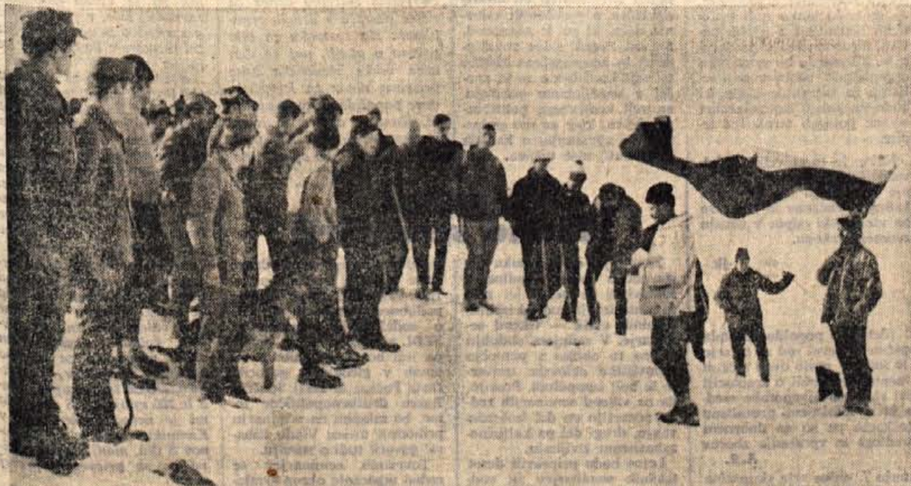
Ob lepem vremenu se je v soboto in nedeljo spominskega pohoda na Stol udeležilo kar 245 planincev, smučarjev, borcev in tabornikov največ z Gorenjske pa tudi iz drugih krajev. Na ta način so počastili spomin na bitko 40 prvoborcev Cankarjeve čete pred 28 leti. Vsi udeleženci so dobili bronaste spominske značke, trije udeleženci pa so za petkratni vzpon prejeli zlato, več planincev pa za trikratni vzpon srebrno spominsko značko.