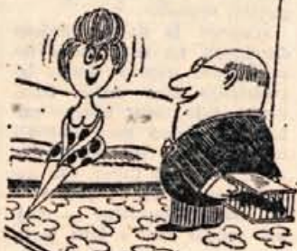
— Vedno si želela, naj ti kupim nekaj krznenega.