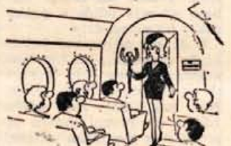
— Pilot sprašuje, če ima močče kdo kladivo pri sebi.