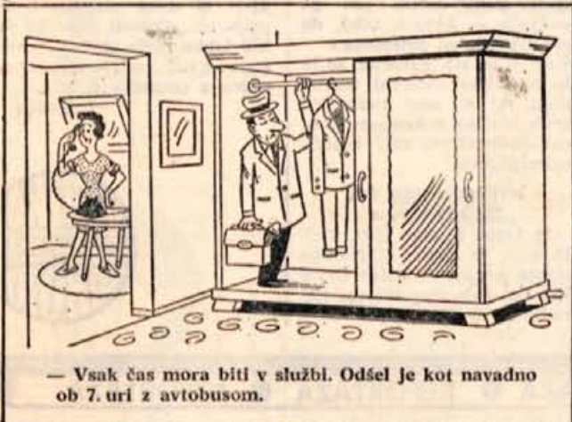
— Vsak čas mora biti v službi. Odšel je kot navadno ob 7. uri z avtobusom.