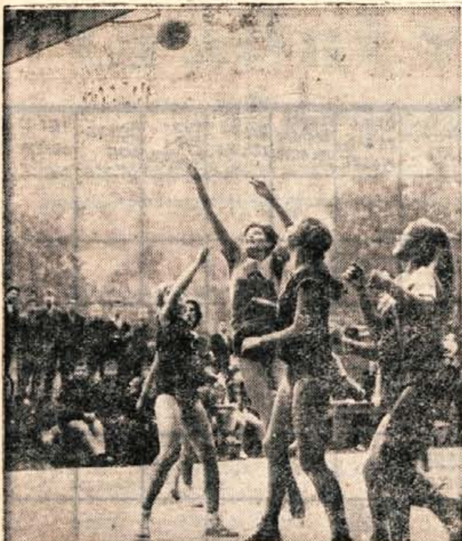
Košarkarice Jesenic so bile letos spet republiške prvakinje