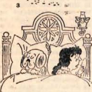
— Tone, ali si zapri psa v garažo?