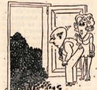
— Ko sem zavpil: »Postavite ga pred vrata, sem mislil, da je mlekar.«