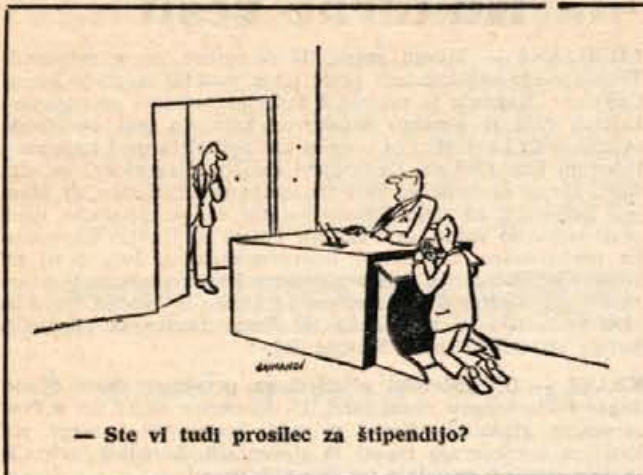
— Ste vi tudi prosilec za štipendijo?