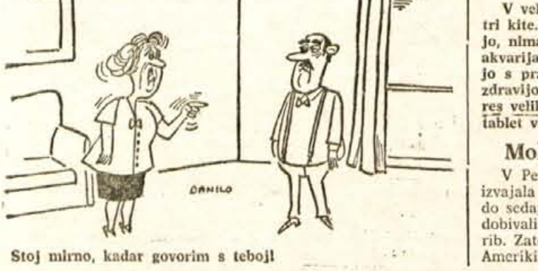
Stoj mirno, kadar govorim s teboj!