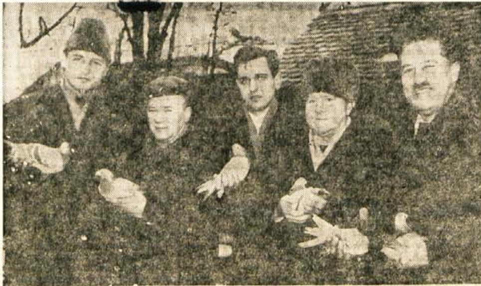
Člani kranjskega kluba rejcev golobov pismonoš pred odhodom svojih pernatih prijateljev na olimpiado.