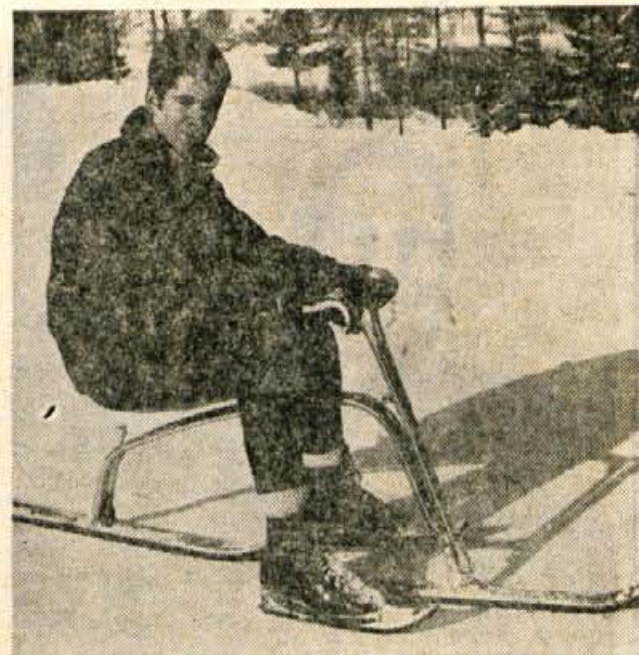
Čudno vozilo, na katerem sedi fant, se imenuje skl-bob. Nekakšen kržanec med sanmi in smučmi je. Vožnja z njim zahteva kar precej spretnosti — nič manj kot smučanje.

(Duplje), 3. Mohorič (Tržič), 4. Faganel (Podnart), 5. Zolokar (Križe), 6. Klančnik (Duplje), 7. Stare (Olševek), 8. Jazbec (Križe), 9. Hvastil (Triglav), 10. Pirih (Podbrezje) itd.