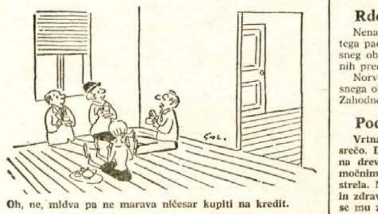
Oh, ne, mladv pa ne marava ničesar kupiti na kredit.

lo priznala, da je otroka so- vrazila. Očetje so bili ali al- koholiki ali pa za otroke ni- zo skrbeli. Največkrat pa so starši živeli v stalnih prepri- rij. Motnje v rasti pa so tak- roj prenehale, če so bili otroci v bolnišnici deležni ljubeče nege.