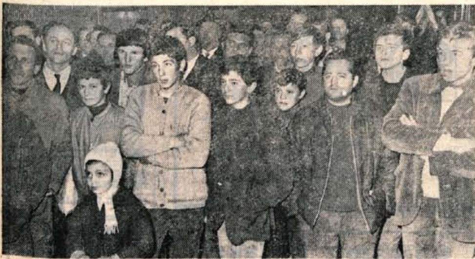
Kranjčani, ki so v sredo zjutraj prihтели v avlo kina Center, da bi na barvnem televizorju videli pristanek ameriških vesoljcev na Luni, so z zanimanjem sledili dogajanjem na ekranu.