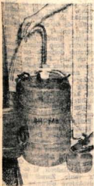
Plastična črpalka, s katero je moč doseči nadnormalni pritisk

Obrotno podjetje OKOVJE Kamna gorica je bilo ustanovljeno 1948. leta. Razvilo se je iz obrtne delavnice, ki je imela svoje delovne prostore raztresene po raznih hišah v Kamni gorici. Ze od vsega začetka pa je bil glavni izdelek tega podjetja stavbno okovje. Tako že vrsto let v tem podjetju izdeluje vseh vrst francoskih nasadil (pantov) za vrata in