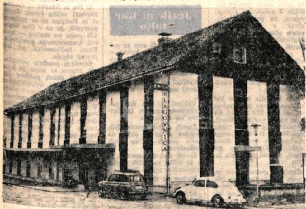
Najmodernejša blagovnica v kranjski občini bo močno polepšala središče Cerklj.

Zvedeli smo tudi, da bodo v ponedeljek ob otvoritvi blagovnice prva dva kupca nagradili. Razen tega bodo prvi mesec poslovanja vsaki teden enkrat nagradili kupca, ki bo kupil blago v pritličju in v prvem nadstropju. Do konca leta bodo kupcem, ki bodo nakupili za več kot 10 tisoč starih dinarjev industrijskih izdelkov, dali 3-odstotni popust. Hkrati pa bodo za industrijsko blago dajali potrošniška posojila. To pa je le del presenečenj, ki jih bo veletrgovina Živila v tej trgovini pripravljala kupcem v prihodnje.