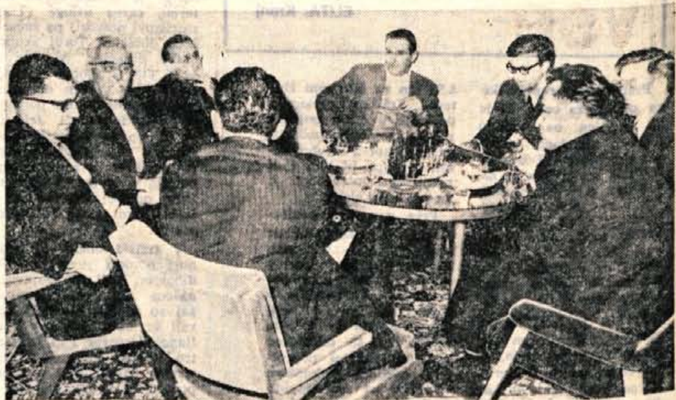
Delegacija iz Savone med razgovorom na občinskem komiteju ZK v Kranju.

(Za olje veljajo stare cene BEOGRAD, 17. nov. (Tan)