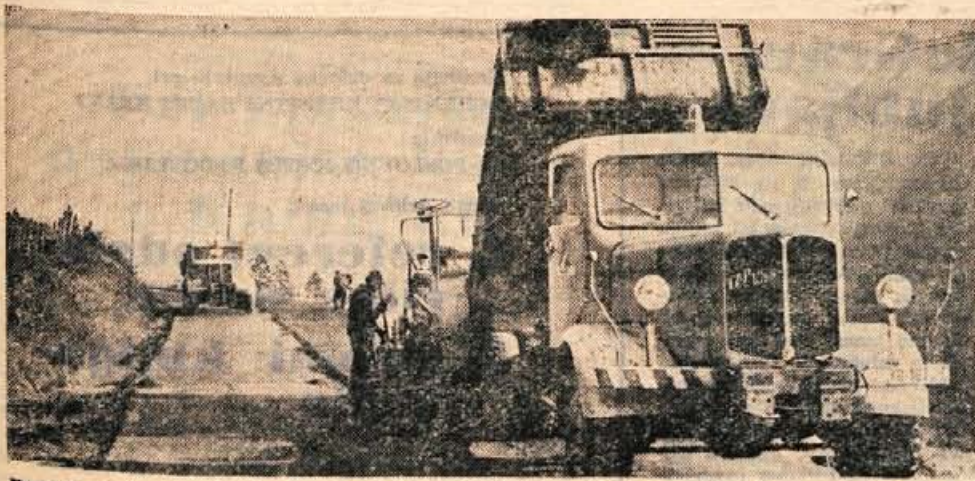
Delavci cestnega podjetja Kranj te dni dokončujejo asfaltiranje 3,5 kilometrov dolgega odseka ceste med Hrušico in Mojstrano. Doslej precej valovito površino bodo prekrili z izravnalnim slojem ter tako avtomobilistom omogočili udobnejšo vožnjo. Investitor del je Cestni sklad SRS. Kot smo zvedeli na upravi Cestnega podjetja, so imeli graditelji precej težav s prometom, ki je še vedno dokaj gost. Kljub temu bodo dela končana do 26. oktobra. Čeprav gre samo za izravnavo, so doslej porabili že 4000 ton asfaltne mase. (ig)