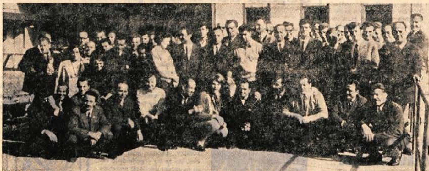
Seminarja na Jezerskem so se udeležili predsedniki in sekretarji krajevnih organizacij SZDL