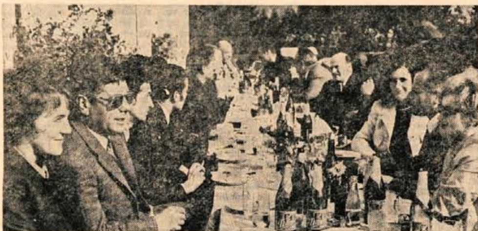
Ob Unionovem pivu in Alkovi alkoholnih ter brezalkoholnih pijačah je med povabljenici na degustaciji pred Porentovim domom kmalu zraslo razpoloženje.