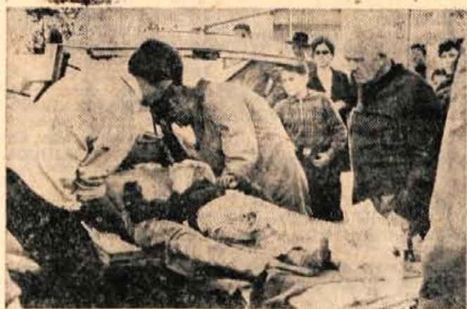
Reševanje ponesrečenca iz kanjona Kokre