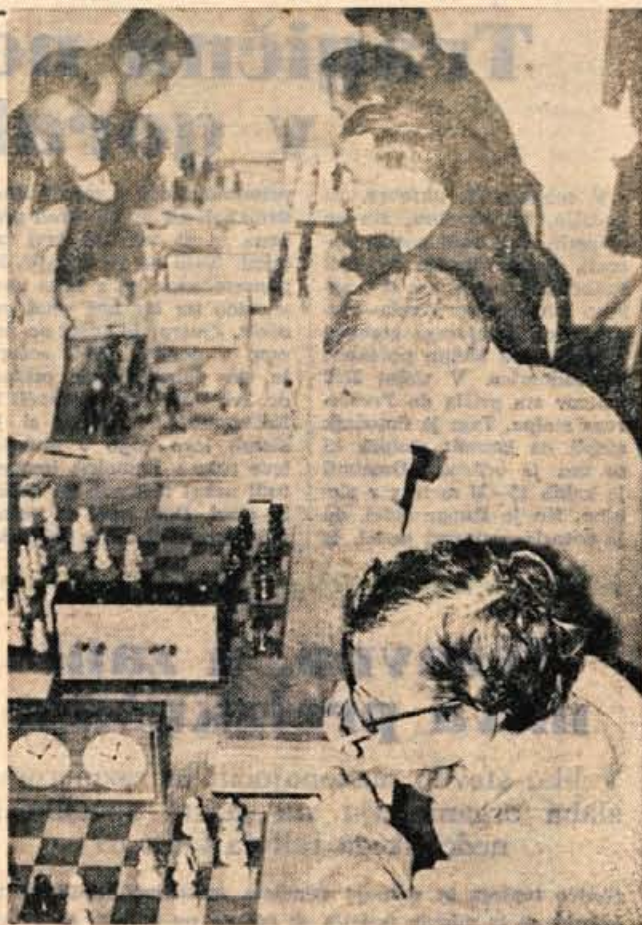
Z nedeljskega srečanja — Foto: Živulović

V naslednjih kolih bodo Kranjčani igrali takole: 26. oktober — Ljubljana : Borec, 2. november — Borec : Kočevje, 9. november — Novo mesto : Borec, 16. november — Borec : Domžale, 23. november — Koper : Borec, F. Stagar