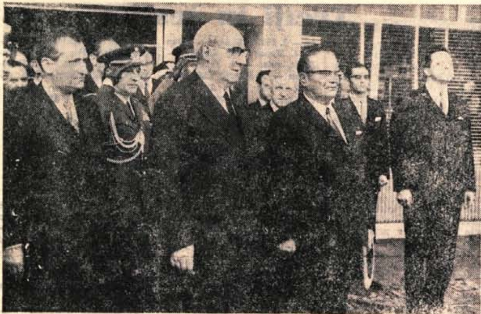
Med igranjem državnih himn na ploščadi brniškega letališča