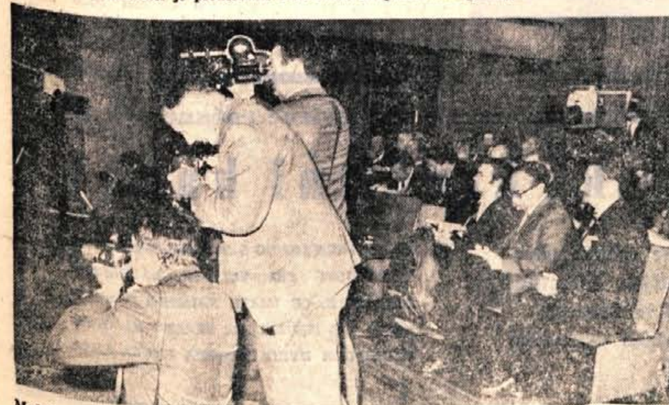
Med tiskovno konferenco so nenehno brnle kamere in fotografski aparati