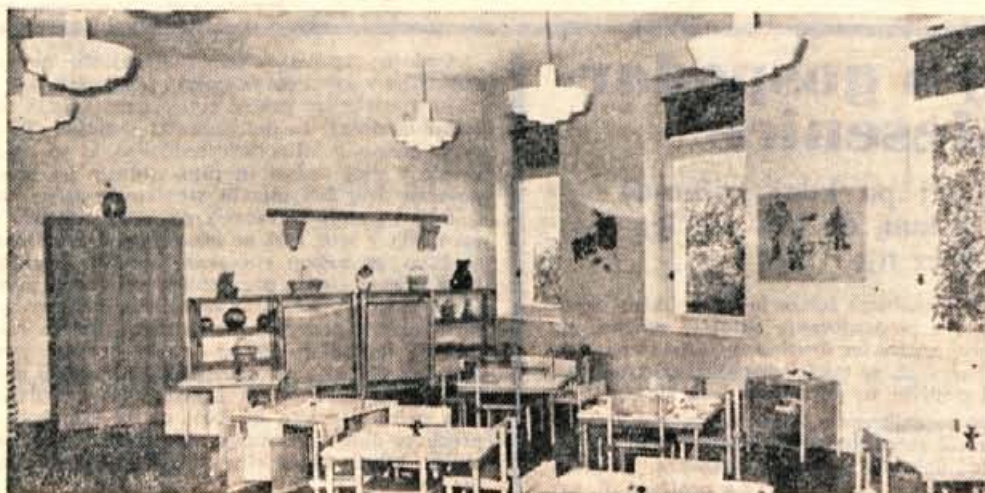
V soboto so v osnovni šoli v Žabnici odprli novo varstveno ustanovo

Pismene ponudbe z dokazili o izobrazbi sprejema upravni odbor do 18. oktobra 1969. Delo je možno nastopiti takoj. S stanovanji Solški center ZP Iskra Kranj ne razpolaga.