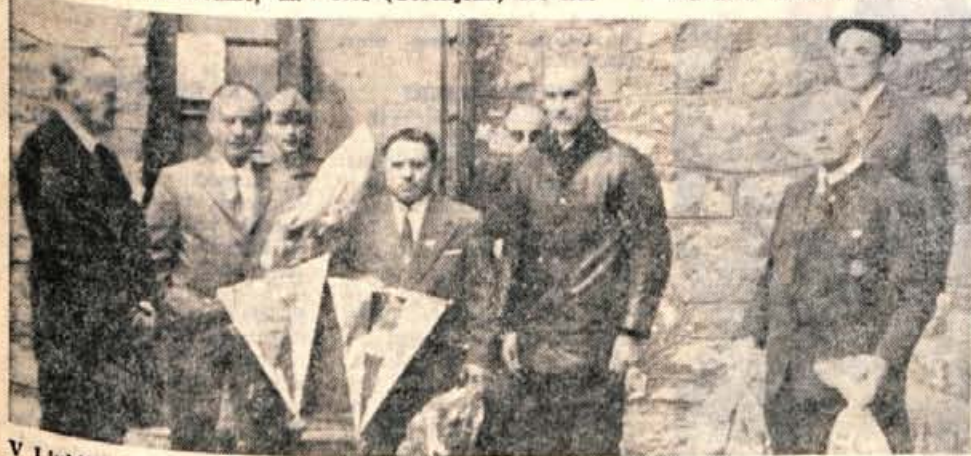
V Ljubljani so se pomerili v tradicionalnem troboju strelci Furlanije, Koroške in Gorenjske. Na sliki: otvoritev tekmovalja.