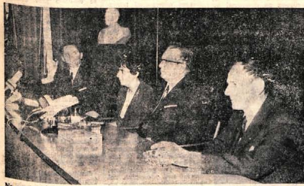
Na sobotni konferenci je predsednik Tito mirno in sproščeno odgovarjal številnim novinarjem