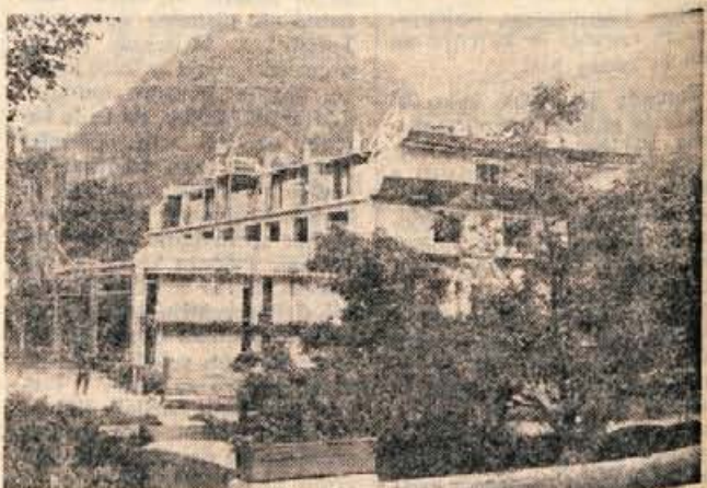
Zgradba v Kidričevi ulici v Kamniku bo v spodnjih prostorih namenjena trgovskim lokalom, v zgornjih prostorih pa bodo stanovanja.