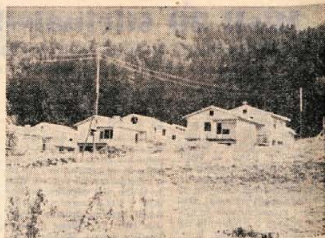
V Novem trgu v Kamniku nad Zavodom za usposabljanje invalidne mladine nastaja naselje montažnih hišic. Večina le-teh (vse so narejene «ekspresno», saj so jih začeli graditi šele letos pomladi) bo vseljivih že pred letošnjo zimo.

Gorenjska lovišča naseljuje torej jelenjad, ki ni avtohtona (prabitna) marveč umetno naseljena.