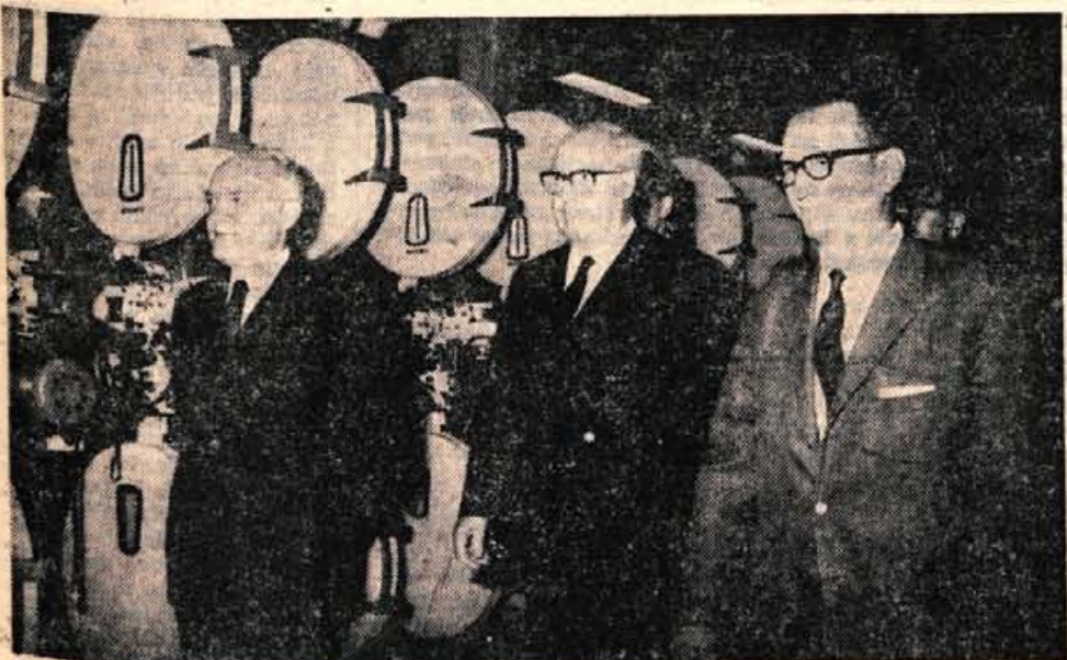
Predsednik italijanske republike Giuseppe Saragat je v ponedeljek obiskal kranjsko Iskro