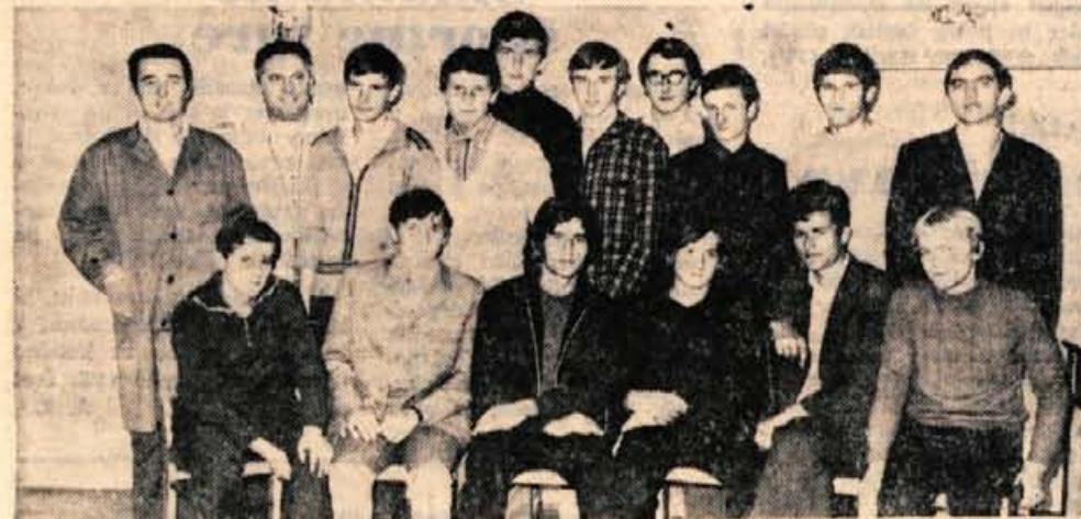
Učenci III. d razreda Pokljane šole za kovinarsko in elektro stroko, ki so na zveznem tekmovanju dosegli prvo mesto.

Program razvoja turizma, ki mu Ločani zadnje čase že tako posvečajo veliko pozornost, je vsekakor najbolj obširen in presega okvire priprav na bližnje praznovanje. Zajema mesto in njegovo okolico ter obe dolini. Med celo vrsto objektov, sprič katerih utegne Skofja Loka čez leta postati eden glavnih športno-letoviških središč na Gorenjskem, bomo našli samo največje: hotel B kategorije s 60 do 70 posteljami (gradnja naj bi stekla že ta ali prihodnji mesec), novi gostinski lokali, restavracije in bifeji, kamping z motelom, kavarna in nočno zabavišče, vlečnice in sankališča v okolici mesta ter mali golf, teniško igrišče, drsališče in kotalkališče. Poljanski dolini se obeta zimski bazen, kegljišče in nov parkirni prostor vse na Trebilj, smučarske vlečnice pri Gorenji vasi in v okolici Poljan ter moderno turistično središče na Visokem, kjer bodo zgradili letno kopalnico, kamping in mali golf. Tavčarjev dvorec pa preuredili v sodobne gostišče. Podobne novosti lahko pričakujejo tudi prebivalci Selške doline, saj načrt predvideva izgradnjo smučarske vlečnice na Sorški planini, ustanovitev trajne čipkarske razstave v Zelenikih in ureditev zimskošportnega središča Stari vrhovi. Čela vrsta univerzitetnih profesorjev, zgodovinarjev, arheologov, književnikov in publicistov piše knjige in razprave, ki bodo osvetlile to ali ono obdobje tisočletnega mesta ter predstavile bralcem še neobdelane podrobnosti iz življenja njegovih gospodarjev pa tudi prebivalcev. I. Guzelj