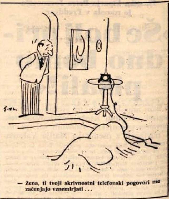
— Žena, ti tvoji skrivnostni telefonski pogovori me začenjajo vznemirjati ...

Na Nevskem prospektu so že tedaj nadomestili podrtje hiše z navideznimi fasadami. Sešili so jih iz vreč, ki so jih nato pobarvali v stilu prave fasade. Ker so oblasti uvedle tudi druge zdravstvene preventivne mere, je bilo spomladi mesto snažno in čisto kot v mirnih časih. Konec decembra so bili zaprti javna kopališča. Zdaj so jih spet odprli.