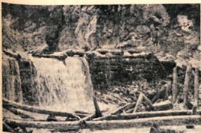
Za pregrado v Jasni v Kranjski gori, kjer teče Pišnica, lesena pregrada zadržuje 120.000 m 3 proda. Toda pregrada popuša.