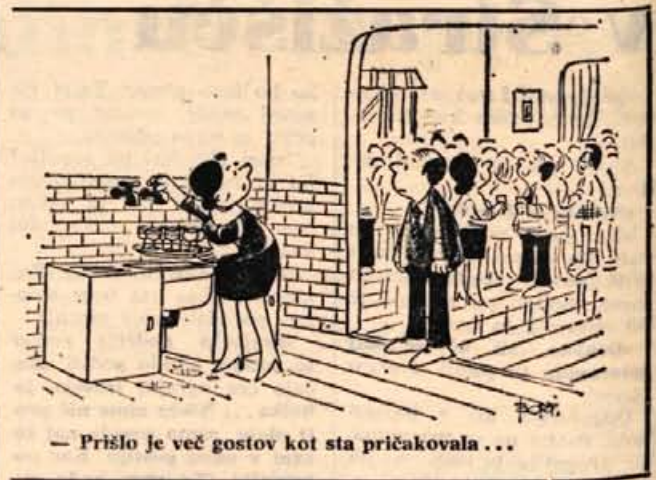
— Prišlo je več gostov kot sta pričakovala ...