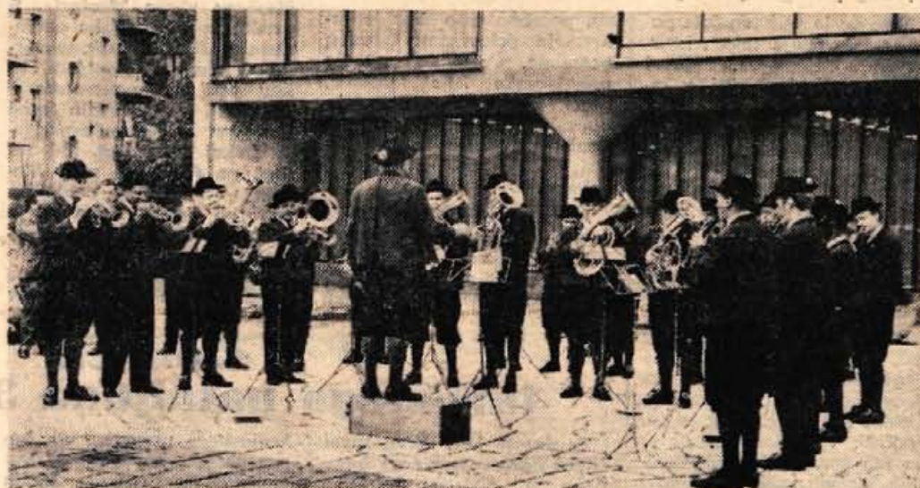
Po prihodu v Kranj je godba na pihala iz Zelezne Kaple priredila pred stavbo občinske skupščine promenade koncert, kateremu so prisluhnili številni Kranjčani.