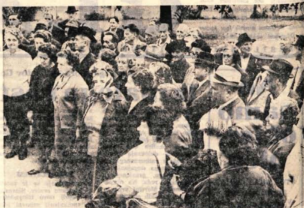
Industrija gumijskih, usnjenih in kemičnih izdelkov Sava Kranj je za upokojene člane kolektiva pripravila dvodnevni brezplačni izlet v Crikvenico. Na izlet so odpotovali v ponedeljek popoldne.

Visok je 12 metrov, težak 141.600 kilogramov, v svoje rezervoarje sprejme 89.137 litrov goriva, doseže približno 1000 kilometrov na uro in sprejme skoraj 200 potnikov. J. K.