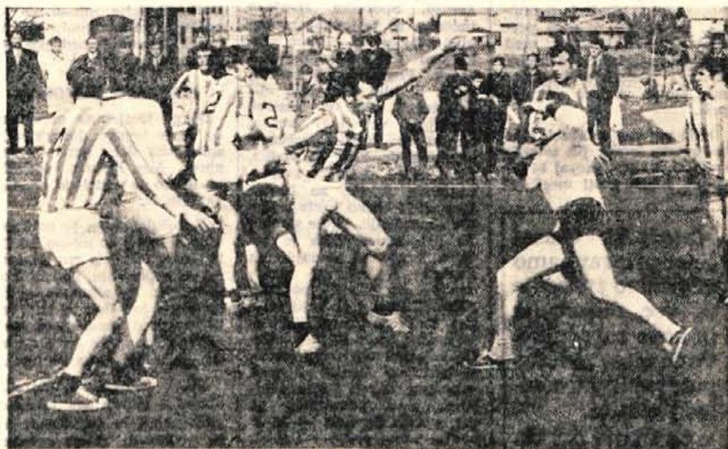
Zdaj so na Gorenjskem že oživelja vsa rokometna igrišča. Na sliki: prizor z rokometne tekme v Radovljici.

kord. Zbral je 575 krogov, kar je za dva kroga bolje od dosedanjega rekorda, ki je veljal od leta 1967.