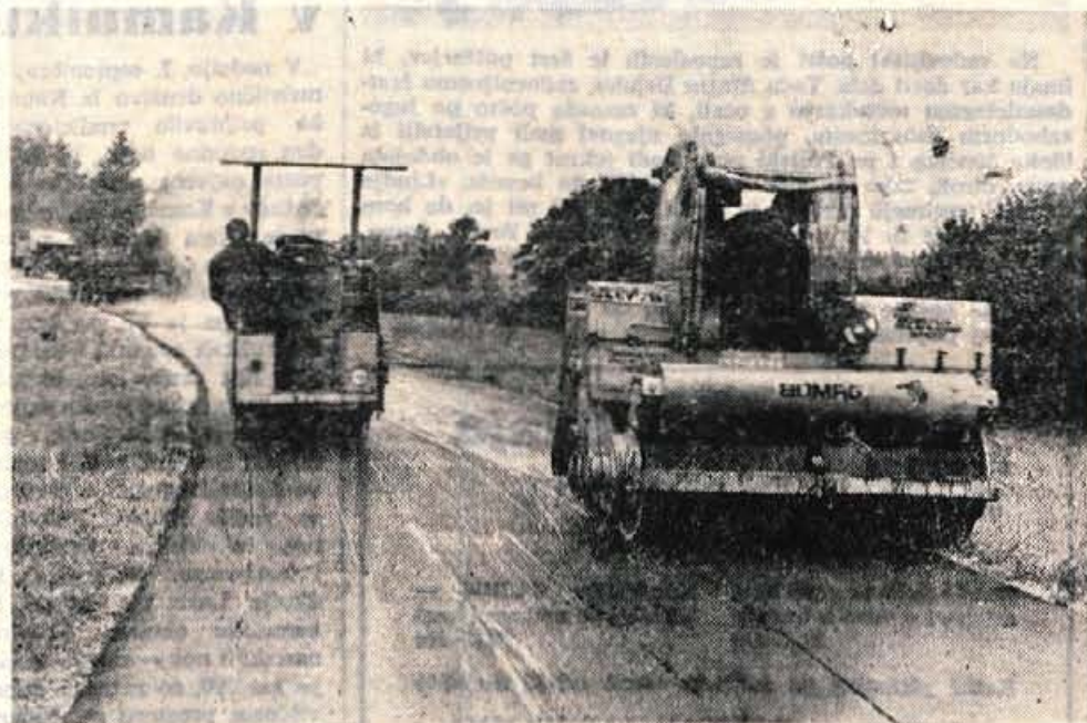
Asfaltni trak na cesti Bobovka—Bela je iz dneva v dan daljši. Odsek od Bobovka do Zgornje Bele je že gotov, jutri ali v petek pa bodo tudi prebivalci Srednje Bele rešeni vsakodnevnega prahu. Delavci Cestnega podjetja iz Kranja so v dobrem tednu asfaltirali 6 kilometrov ceste.