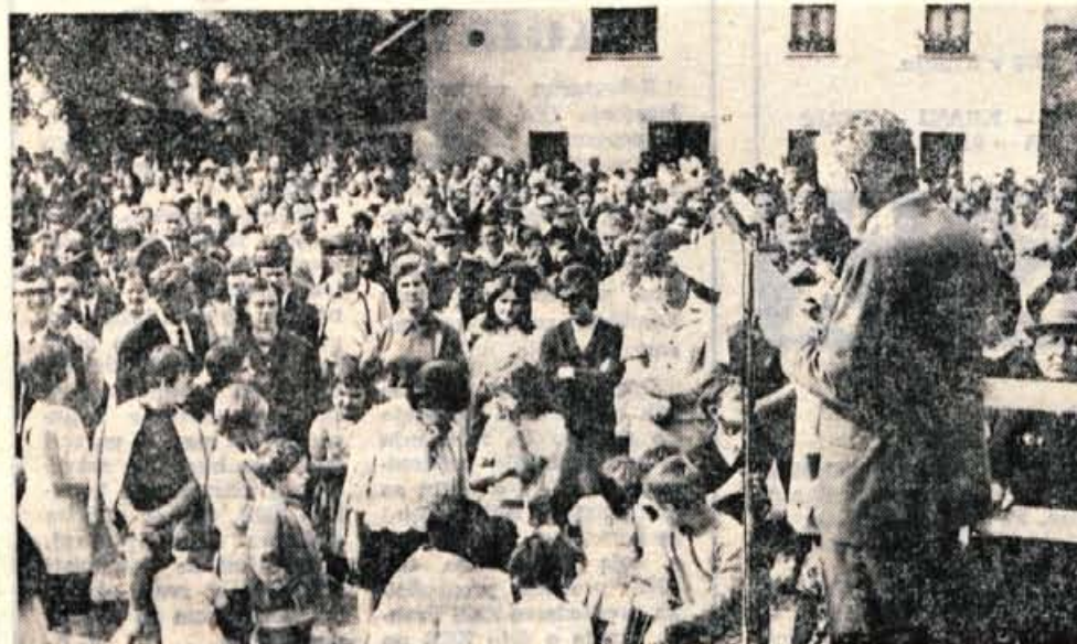
S prvega zborovanja aktivistov Gorenjske v Železnikih.