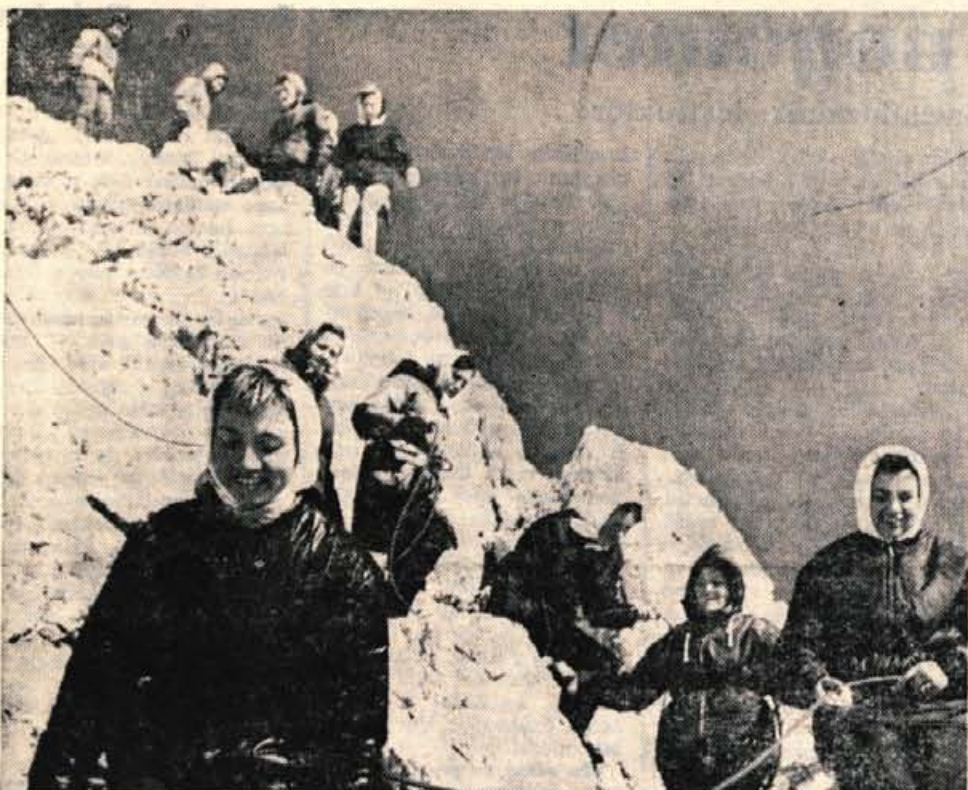
Počasi, previdno, navezane na dolge alpinistične vrvi, katerih konce so držali v rokah izkušeni gorski vodniki, se je karavana žensk pomikala po pobočju navzdol. Sestop ni lahka stvar in treba je biti previden, zlasti še, če se od utrujenosti že šibijo kolena.