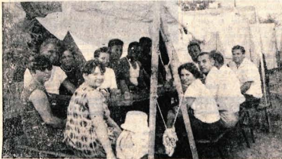
Zadnja skupina iz Uherskyga Broda