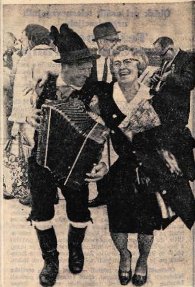
Nasi izseljenci na brniškem letališču