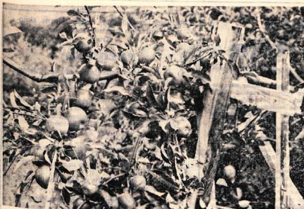
»Z letošnjo letino jabolk smo kar zadovoljni.«