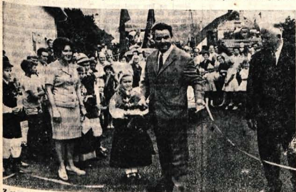
Z otvoritve ceste Naklo—Strahinj.

Ponudbe sprejema ČPG Delo, podružnica Kranj, Koroška c. 16