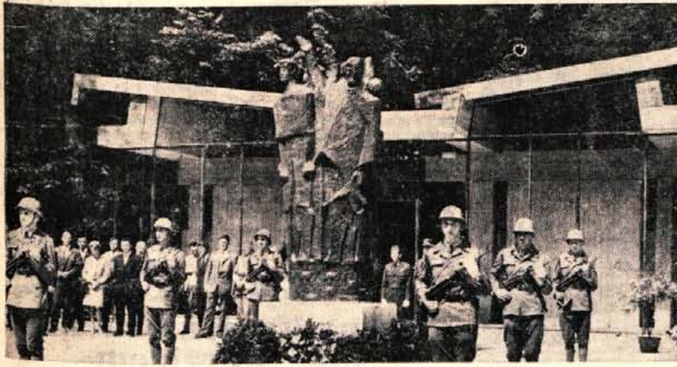
Ob občinskem prazniku v Tržiču so odkrili tudi nov spomenik žrtvam NOB v predilniškem parku.