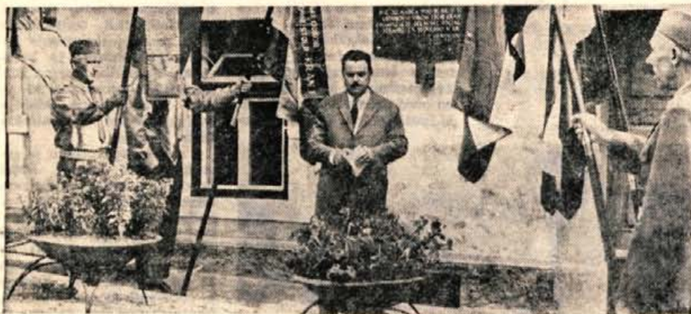
V Kranju so v petek odkrili spominsko ploščo »Pri Felnerju« (Vodopivčeva 9), kjer je bila 1920. leta ustanovljena Socialistična delavska stranka za mesto Kranj.