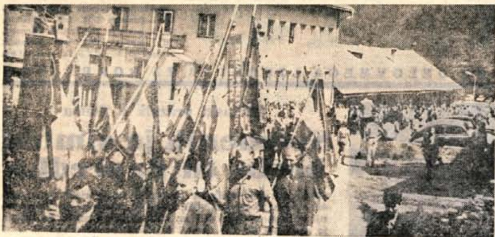
V nedeljo se je v Kropi zbralo nad 200 kurirjev