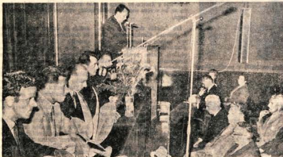
Slavnostna seja družbeno političnega zbora občinske skupščine v Trziču.