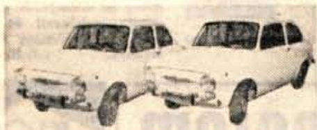
OSEBNA AVTOMOBILA FIAT 850