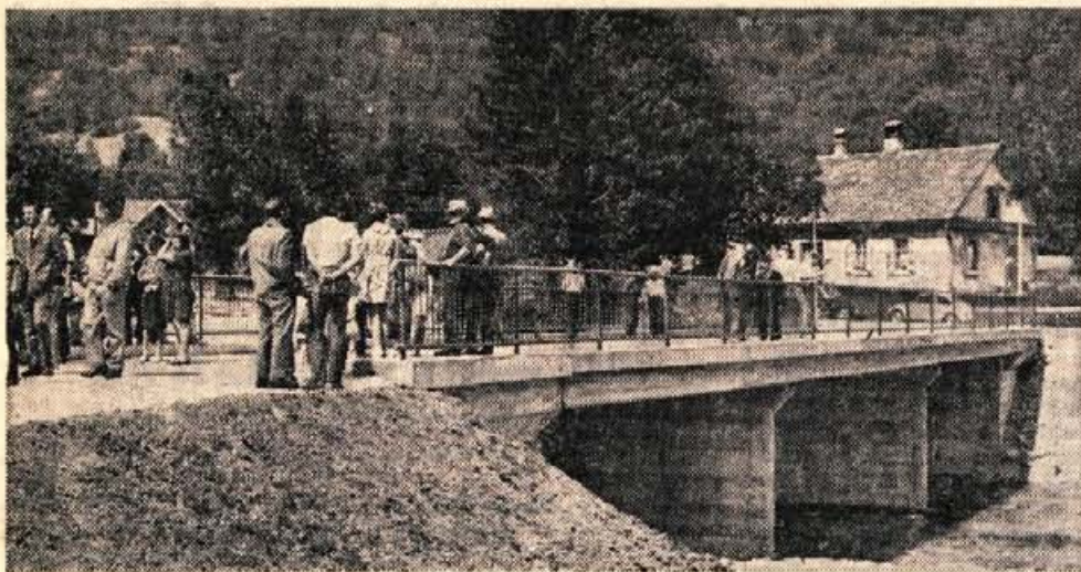
Nov most čez Savo v Mojstrani