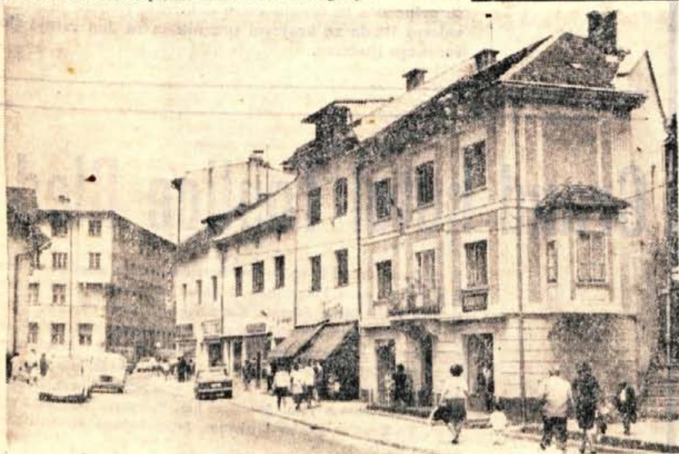
Obnovljena pročelja so precej polepšala ta del Jesenic

V juniju so bili najbolj polni hoteli v Istri ter v slovenskem in hrvaškem Primorju, medtem ko so bili v južnih predelih Jadrana še prazni hoteli A in B kategorije.