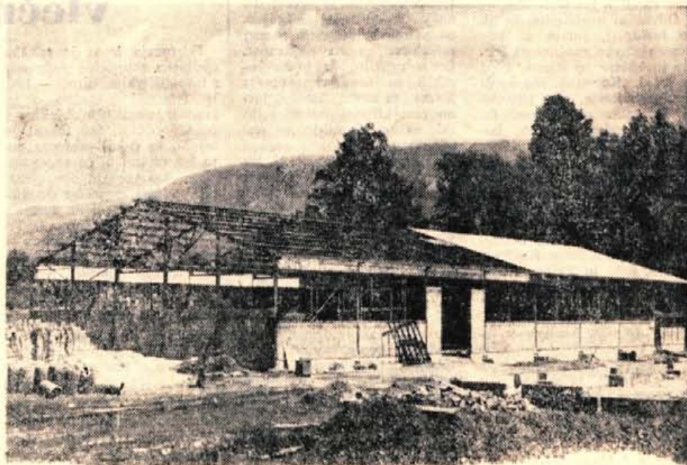
Zraven sedanje tovarne na Bledu bodo Vezenine do konca novembra zgradile novo vezilnico in barvarno

In če smo že začeli z obnovno blejske Vezenine, pa še končajmo z njo. Podjetje, ki je prav v zadnjih štirih letih doseglo zavidljive uspehe, bo svojevrsten uspeh zabeležilo tudi pri obnovi. Predvidevajo, da bodo z obnavljanjem del, ki bodo veljala 800 milijonov starih dinarjev, s pomočjo Gorenjske kreditne banke v Kranju končali v pičlih desetih mesecih.