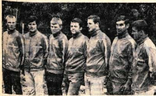
Vaterpolisti Triglava pred startom v II. zvezni ligi