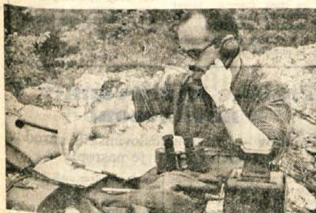
Potek vaje so spremljali tudi na posebni opazovalni postaji.