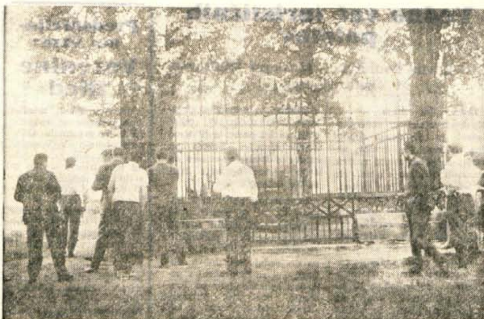
Z obiska na Koroškem: Vojvodski stol na Gosposvetskem polju