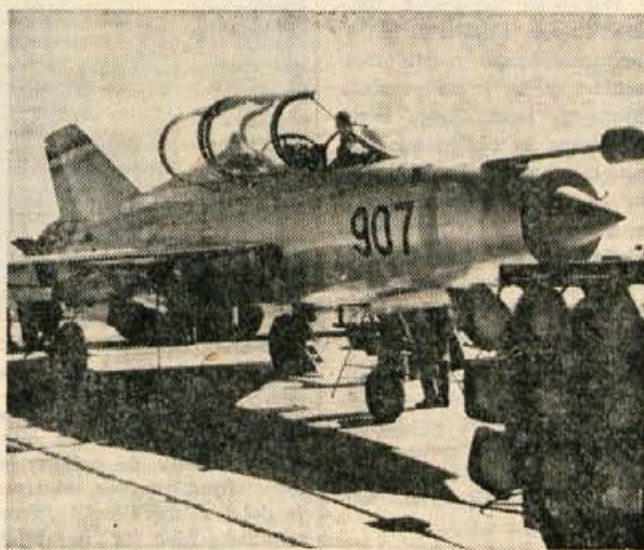
21. maj — dan letalstva: Danes jugoslovanski vojni letalci praznujejo svoj dan. 21. maja pred 27 leti sta partizanska pilot Franjo Kluz in Rudi Čajavec opravila prve bojne naloge in s tem položila temelje našemu vojnemu letalstvu.