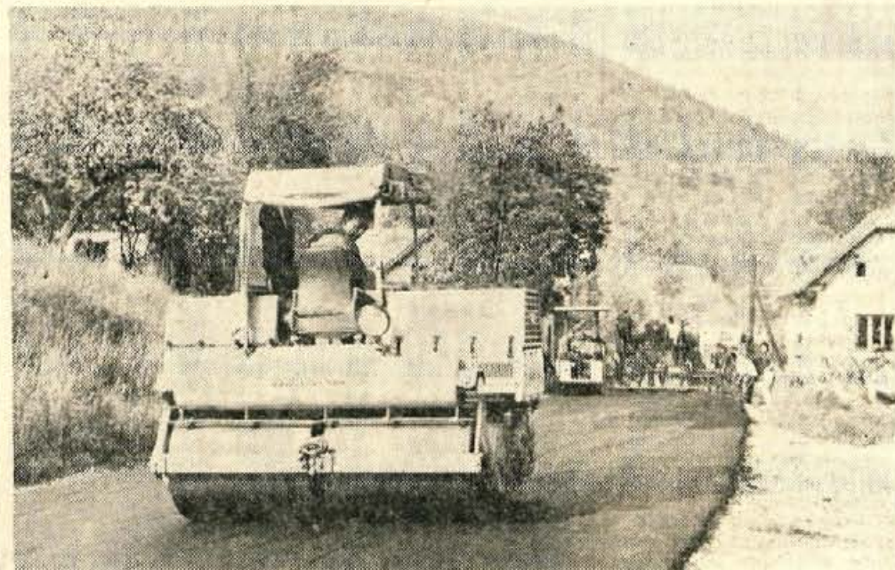
Se zadnji kilometri novega asfaltnega cestišča v Poljansko dolino te dni dobivajo tanko asfaltno prevleko. Posnetek je bil narejen danes teden na Logu pri Poljanah. Kot smo zvedeli od delavcev cestnega podjetja Kranj, ki je prevzelo gradnjo, bo asfaltiranje končano do konca tega meseca. Dnevno prekrijejo od 600 do 1000 metrov ceste