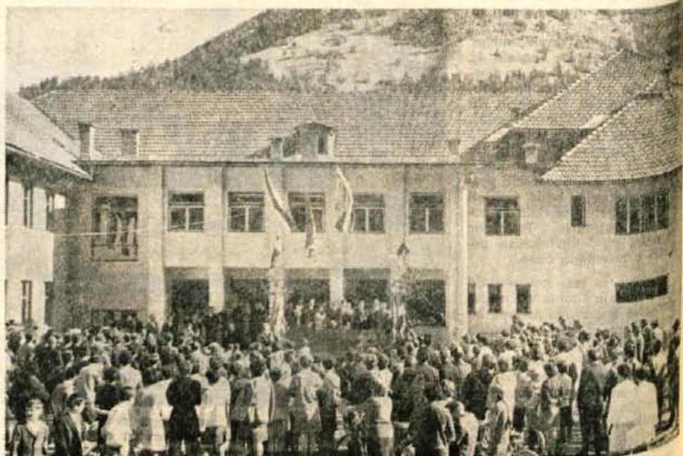
Češnjica: Mladi in stari ob izvedbi sporeda, — Foto: K. Mokuc