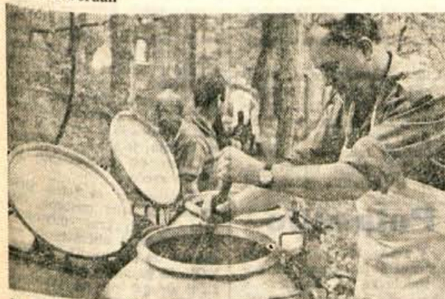
Po končani vaji pa se je dobro izkazala tudi terenska kuhinja.