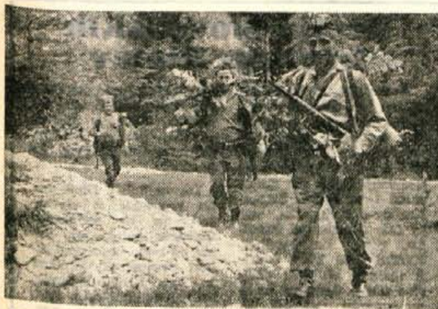
Maskirani delavci javne varnosti so naredili obroč okrog "sovražnika".