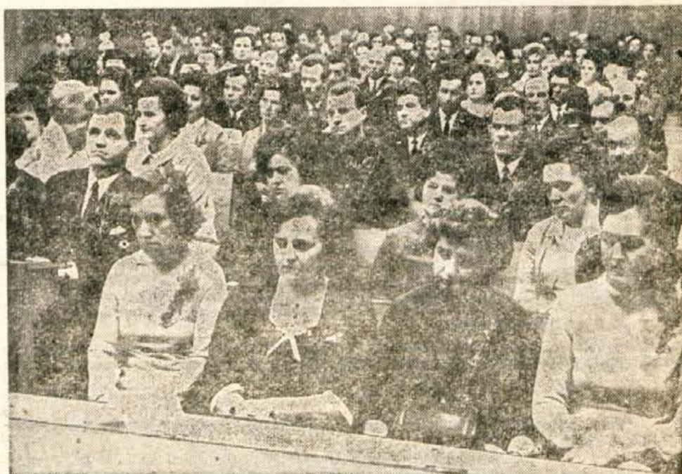
V petek, 27. decembra popoldne je bilo v prostorih kranjske občinske skupščine slavnostno zasedanje delavskega sveta tovarne elektrotehničnih in finomehaničnih izdelkov Iskra Kranj. Na seji so obdarili tudi vse člane kolektiva, ki že dvajset let delajo v tovarni.