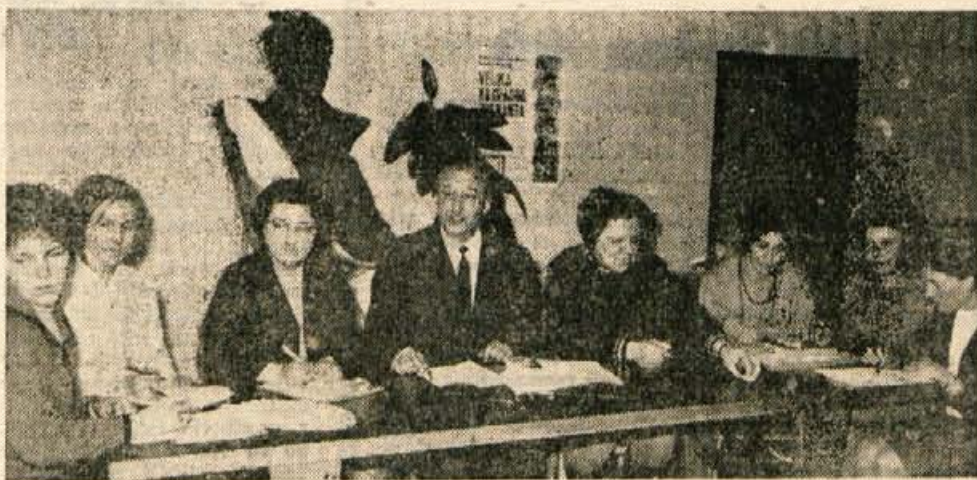
Veliko žrebanje GKB v Škofji Loki je vodila posebna komisija.

Da je to res, so ugotovili že mnogi pred vami. V dokaz pa tale podatek: 1968. leta so varčevalci pri Gorenjski kreditni banki oziroma vseh njenih poslovnih enotah dobili za pri varčevani denar še 770.813.952 starih dinarjev obresti.