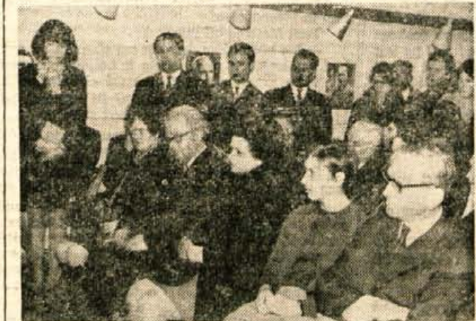
S torkovega večera »Prešernova pot v svetovno slovstvo«.