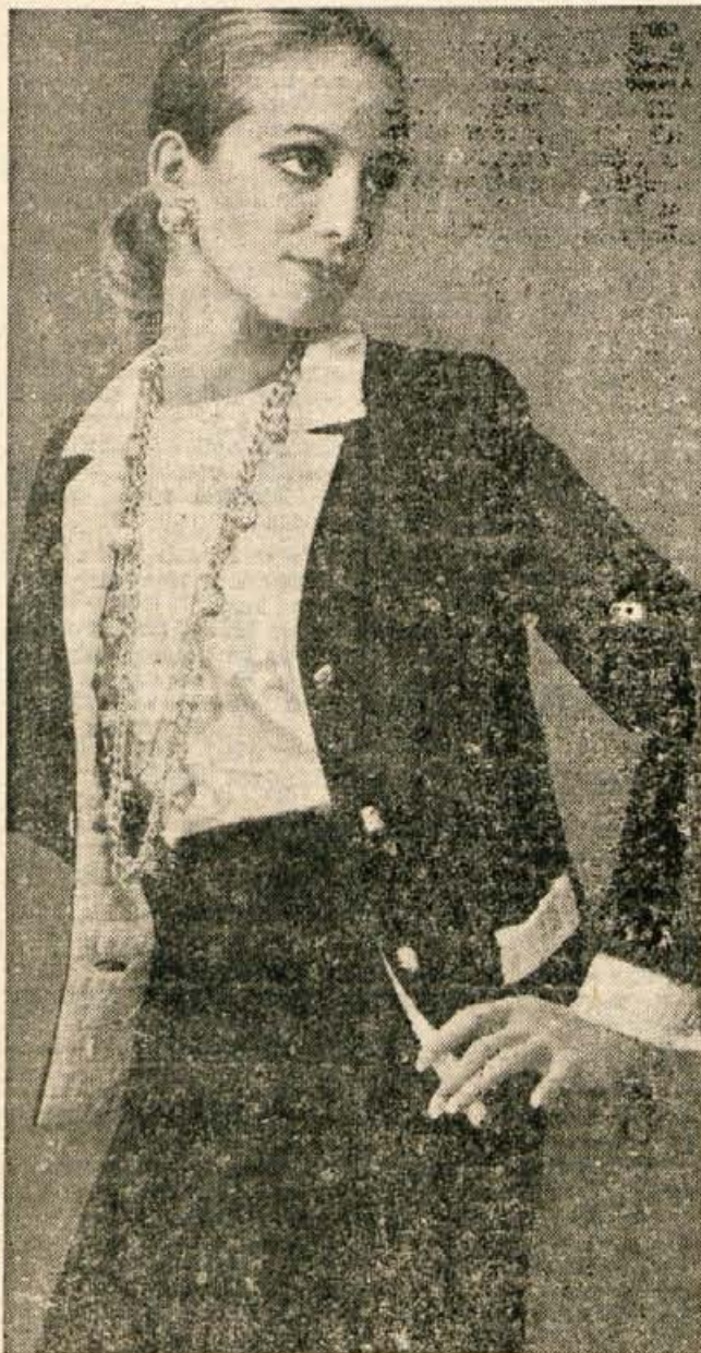
Kostim za vse rojstne letnice in za vse postave. Podložen je s svilo v svetli barvi, ki sega tudi na reverje in ovratnik. Bluza je iz iste tkanine in v isti barvi