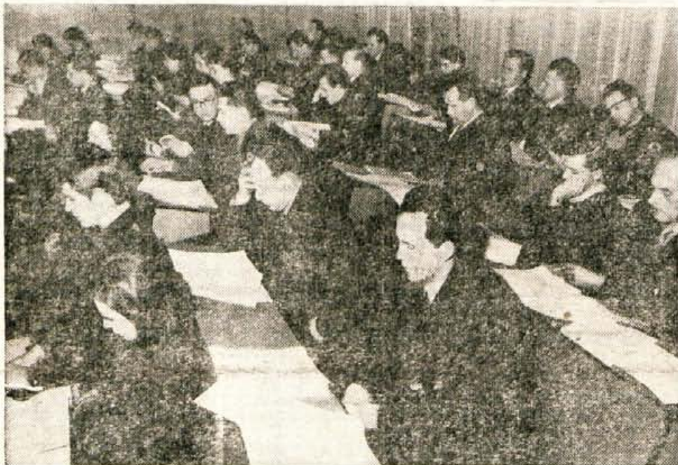
S seje družbenopolitičnega zbora kranjske občine