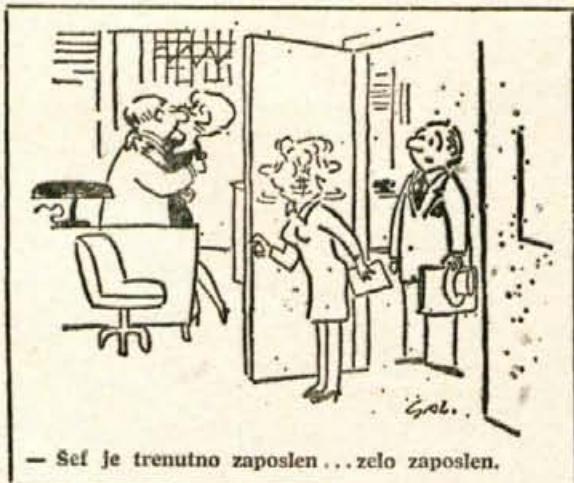
— Šef je trenutno zaposlen . . . zelo zaposlen.

re delovnega dne. Najbrž bo nova metoda zdravljenja utrujenosti in živčnosti najbolj uspešna pri ženskem spolu. Kdo se ne bi zdravil namesto z injekcijami z različnimi kremami in podobno.