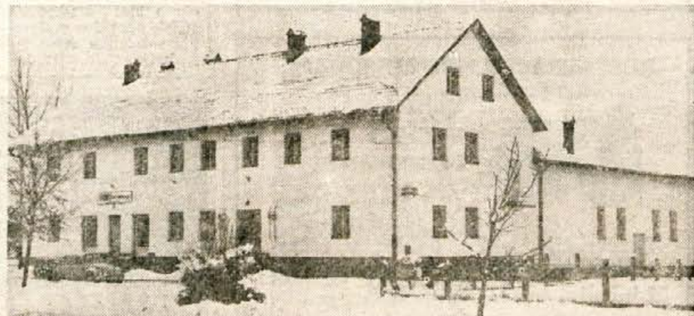
V krajevni skupnosti Vodice so lani med drugim uredili tudi pročelje zadržnega doma