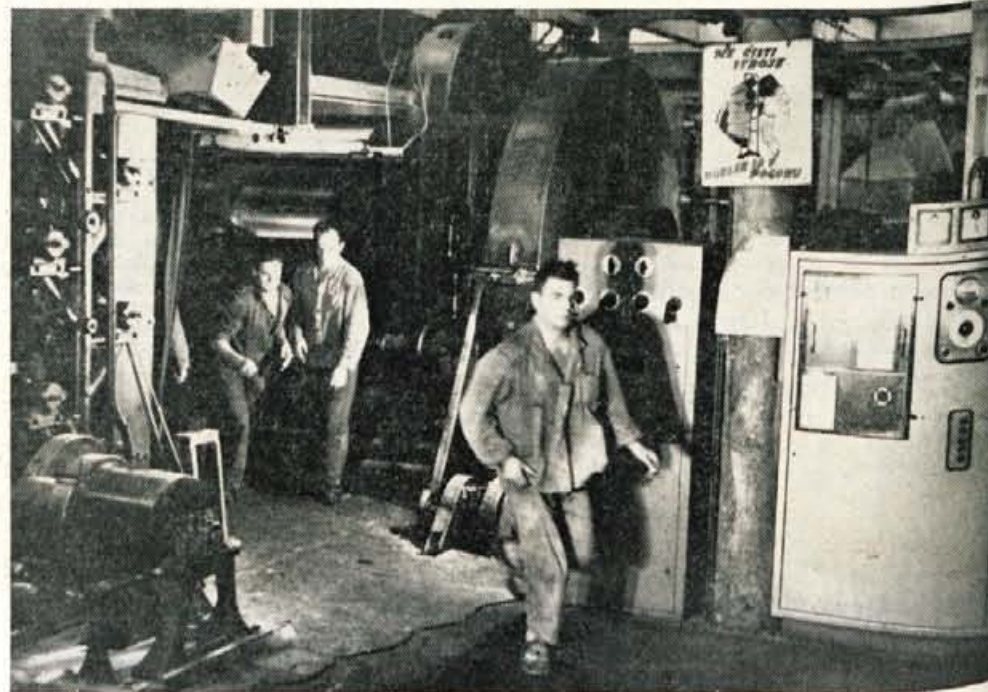
Ob letalskem napadu so delavci v Savi zapustili stroje