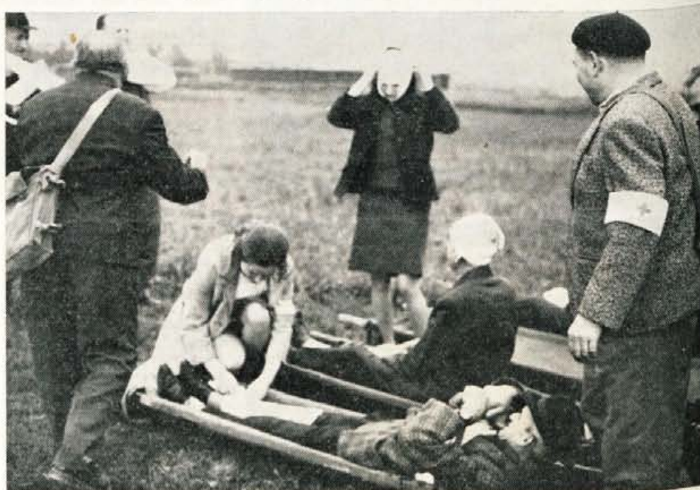
Sanitetne čete krajevne samozaščite pomagajo prvim ranjencem