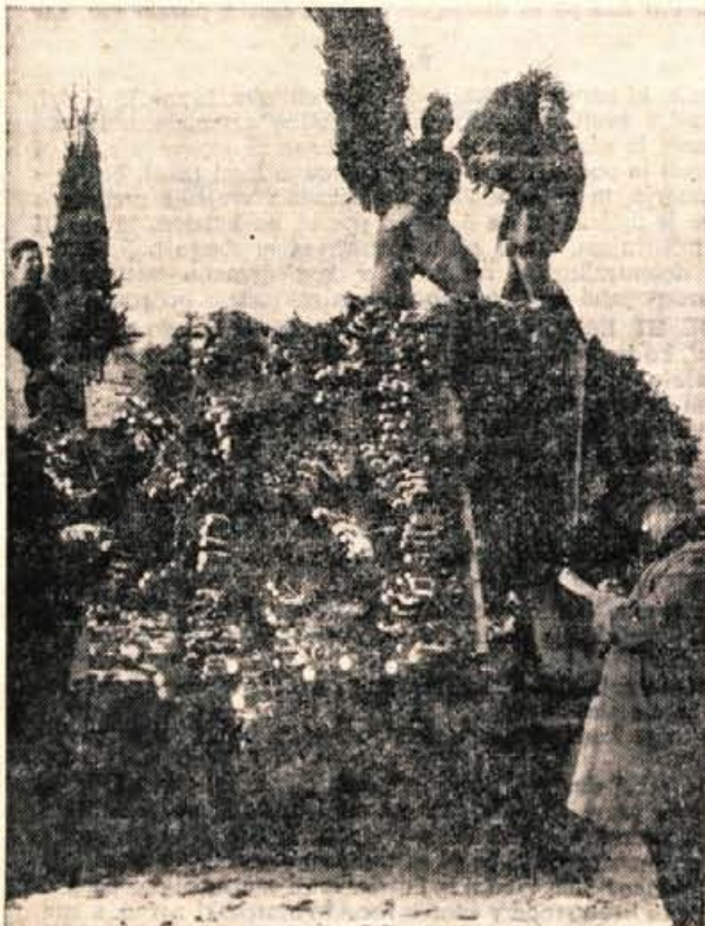
Tako kot prejšnja leta je Gozdno gospodarstvo Kranj tudi letos odposlalo v druge republike precej novoletnih smrečic. V sredo so jih na železniški postaji v Naklem naložili prek trideset tisoč.