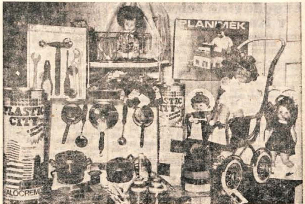
To je le del igrac, ki te dni čakajo malčke v vrtcu Tugo Vidmar v Kranju