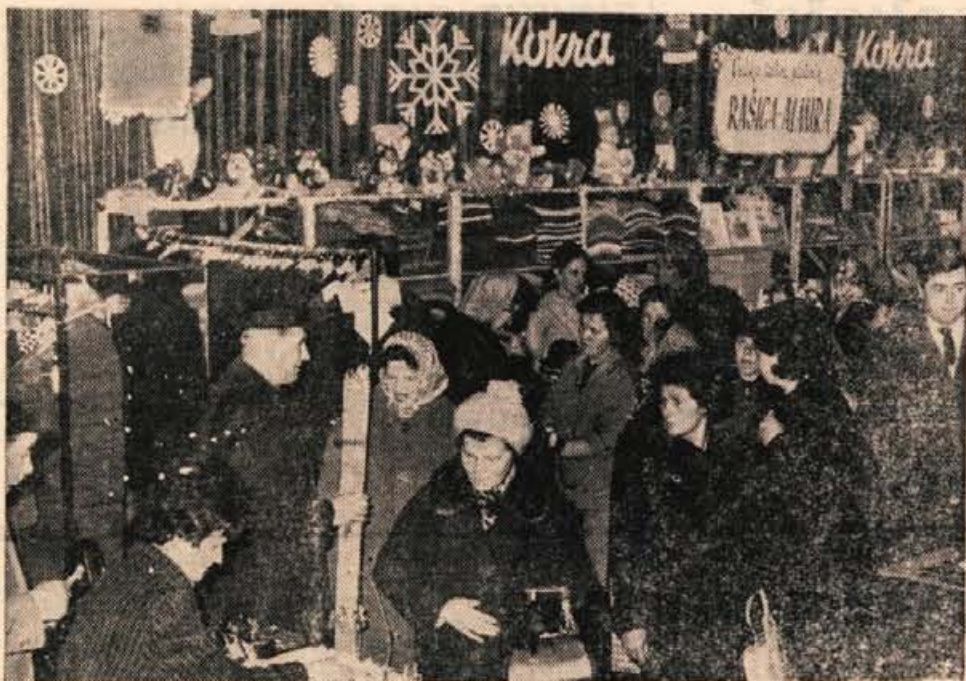
Letošnji novoletni sejem v Kranju je pri razstavljalcih presegel vsa pričakovanja.