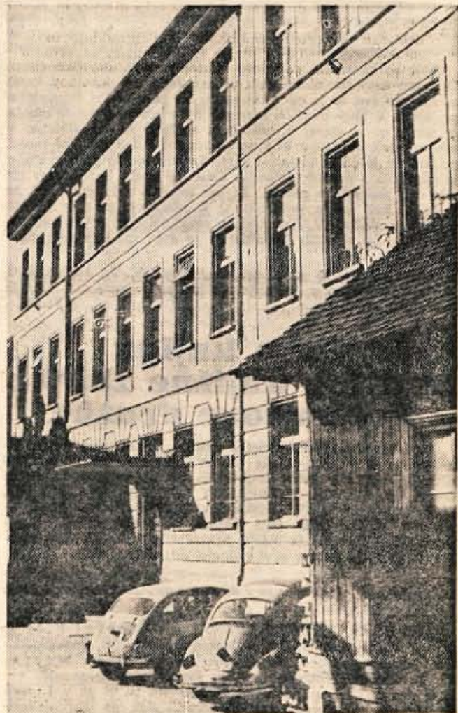
Po organizaciji šolske mreže v Trziču, seveda če bo izid glasovanja na referendumu pozitiven, bo sedanja Bračičeva šola prevzela le nižje oddelke za otroke iz mesta in njegove bližnje okolice. V sedanjem šolskem poslopju pa naj bi uredili tudi prostore za celodnevno bivanje otrok.