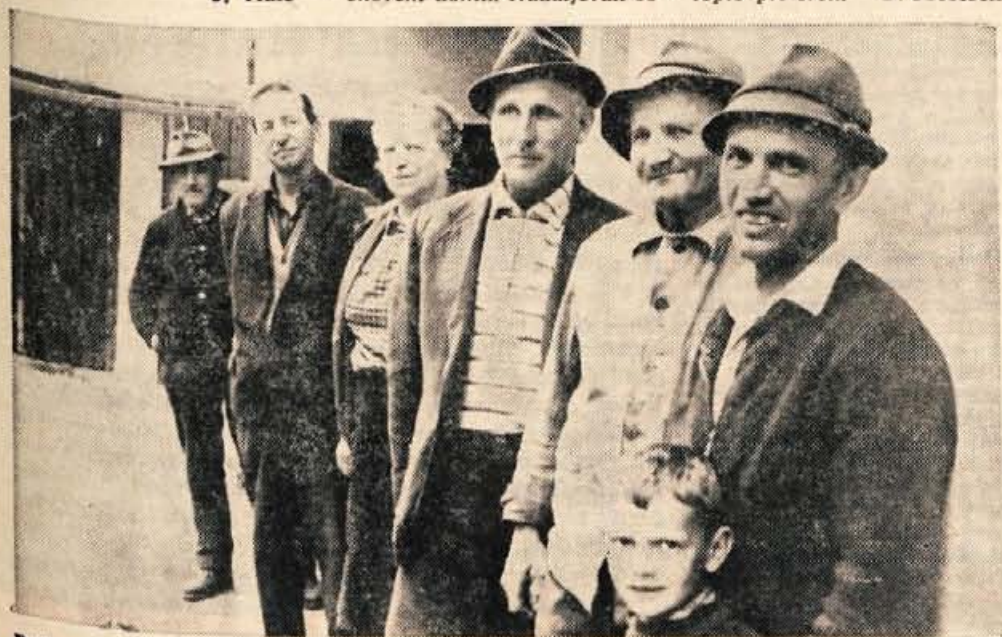
Pašni odbor Dovje-Mojstrana zahteva večje samoupravne pravice

Po planu naj bi bilo v radovljiški občini 1200 krvodajalcev, toda do četrtka, ko to pišem, se je prijavilo samo 700 krvodajalcev, tako da jih je znatno manj, kot je bilo planirano. Sicer pa je še vedno čas za prijavo in upamo, da jih bo več kot 700. J. Vidic