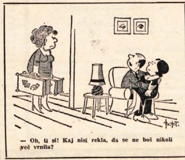
— Oh, ti si! Kaj nisi rekla, da se ne boš nikoli več vrnila?

Policija v brazilskem mestu Sao Paulu ima velike težave z vozniki, ki parkirajo svoja vozila na prepove- danih mestih. Denarne kazni niso zalegle, zato so sedaj kratkoma začeli izpuščati zrak iz vseh štirih zračnic napačno parkiranih avtomobilov.