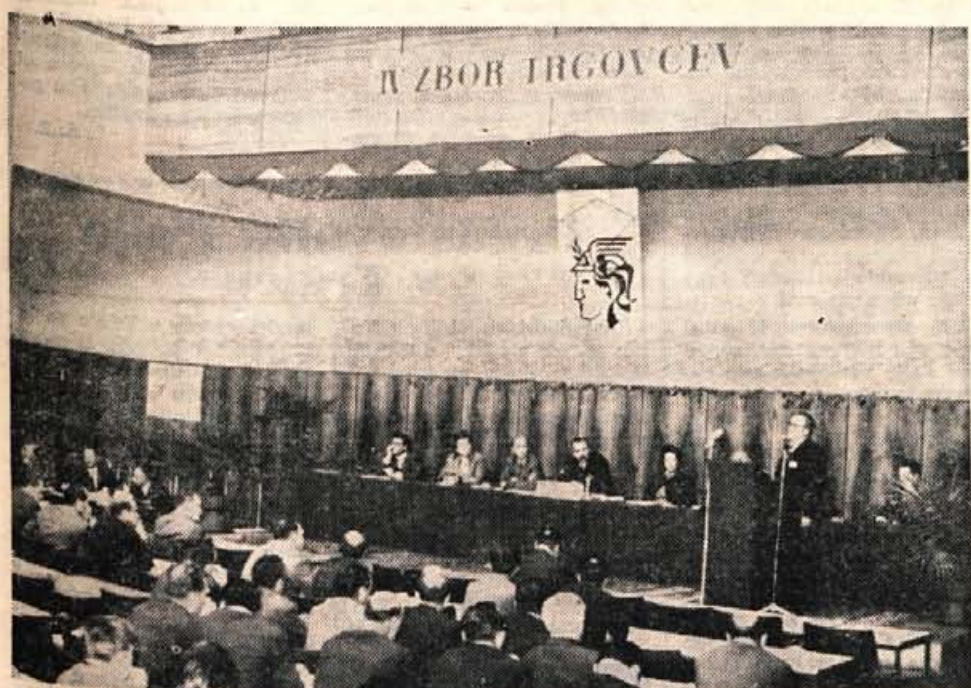
IV. zbora trgovinskih delavcev na Bledu so se udeležili direktorji, komercialisti, vodje razvojnih oddelkov, poslovodje itd.