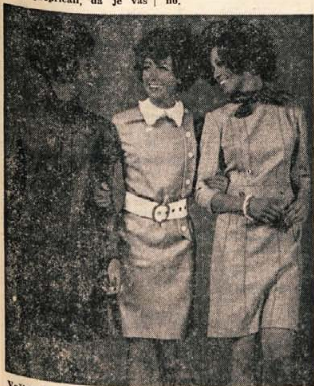
Večina letošnjih jesenskih in zimskih oblek je krojenih iz sive flanelne. Na sliki so tri take obleke, ki jih lahko oblečemo za službo, šolo in za druge priložnosti.