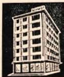
Velika hiša za vsakogar

Morda bi bilo zanimivo spregovoriti še nekaj besed o izvozu. Kot že rečeno, razmere na italijanskem trgu spravljajo mesarska podjetja v škripec. Kaj pa drugod? Pri KG Skofja Loka pravijo, da so zadnje čase začeli izvažati v ZRN. Toda novi kupec se zanima predvsem za telatino. Le-te pa kljub zelo ugodnim cenam ne kaže na veliko pro-