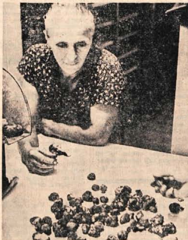
Nabiralka je prinesla dragocene gomolje na odkupno postajo v vasi Livade, kjer jih odkupovalec takoj sortira po kvaliteti in stehta; »ulov« tega dne ni bil ravno najboljši, prava sezona se še ni začela