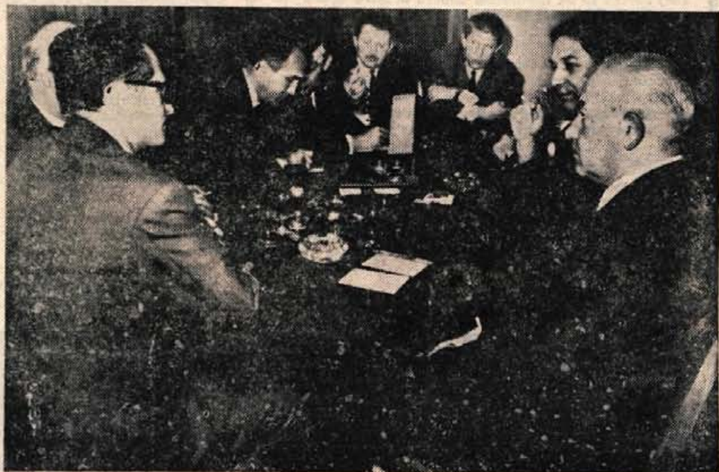
Predsednik evropske komisije EGS v Iskri