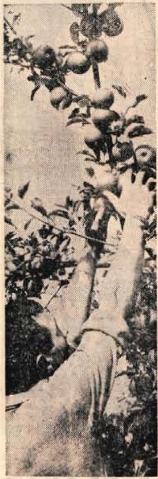
Zadnji čas je, da poskrbimo za ozimnico

Ena izmed najnapornejših športnih disciplin — hoja na 50 km — se je končala dokaj nenavadno. Britanec Nihil, ki je vodil prvih 10 km, je nenadoma skrenil s ceste in začel hoditi po travnikih. Takoj so ga spravili v avto, kjer je — zaspal. Zmagal je vzhodni Nemec Hohne. Svojo zmago je okronal dokaj nenavadno. Na cilju je bil povsem svež. Sprehajal se je in pogovarjal. Ko je prišel v slačilnico in ga je trengravil v odejo, je že čez nekaj minut tudi on — trdo zaspal.