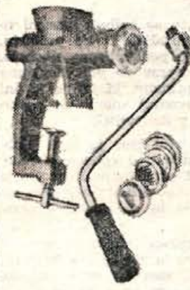
Strojček za popolno iz-delavo domačih rezancev

Gostilna pod Sv. Vrbanom pri Gor. vasi prireja v nede-ljo VINSKO TRGATEV ob 15. uri. Igrajo veseli kvartet Metoda iz Ljubnega. Vablje-ni! 5147